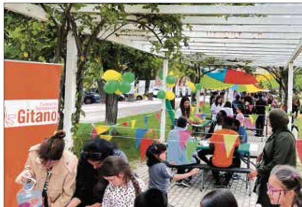
▲ Alguna de las actividades de la pasada edición MPDL

de la Avenida de Entrevías, frente al antiguo dispensario médico Padre José María de Llanos, será el escenario el viernes 23 de mayo de un nuevo Entreencuentro, que en 2025 llegará a