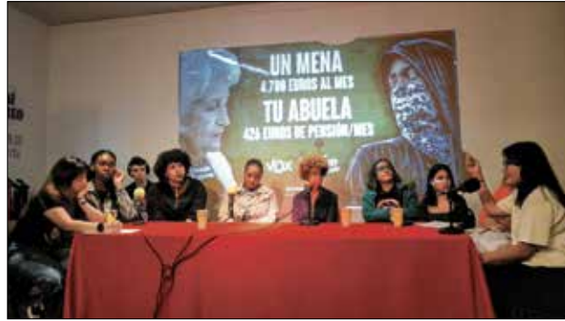
▼ Encuentro contra el racismo organizado por jóvenes del proyecto LA ASOCIACIÓN