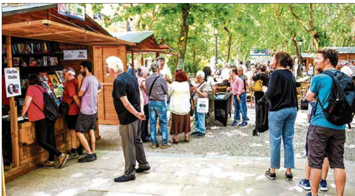
▲ La edición del pasado año en el bulevar de Peña Gorbea. JESÚS INASTRILLAS