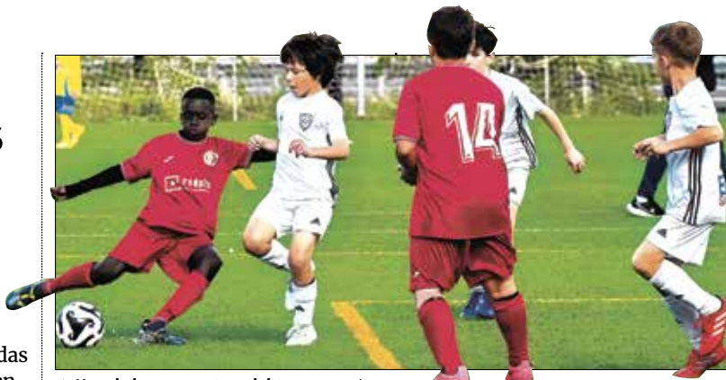
▲ Uno de los encuentros del torneo. JESÚS INASTRIM

TorresRubí ComprarCasa, patrocinador de la sección deportiva del Pozo estuvo presente en el torneo de la Asociación de Vecinos del Pozo, un espacio que cobra vida gracias al esfuerzo de clubes, familias y voluntarios del barrio.