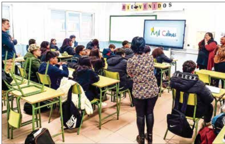
▲ La visita de la activista de la ONGD Mil Colinas y de la educadora de la ONG Urubuto al IES Madrid Sur

Por alumnos 3º E de Diversificación IES Madrid Sur