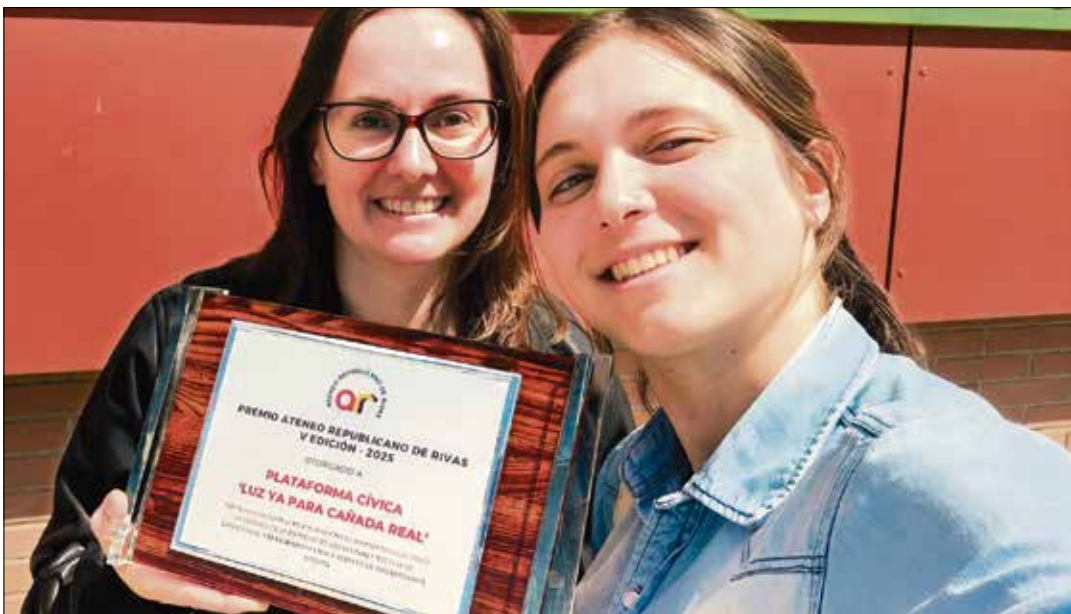
El 25 de marzo se concedió el Premio Ateneo Republicano de Rivas V Edición - 2025 a la Plataforma Cívica Lutz Ya para la Cañada Real