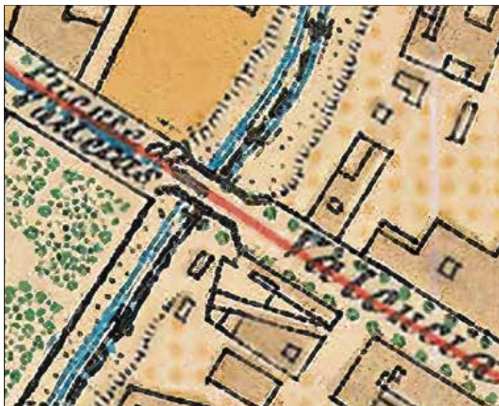
▲ El puente de Vallecass