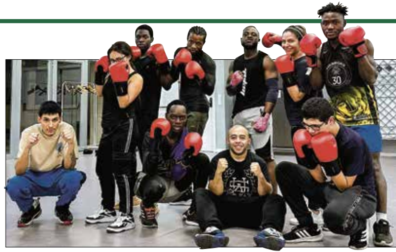
▲ Participantes del taller de boxeo del proyecto El Barrio Más Joven