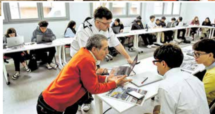
▲ Los ‘profesores’ de Vallecas VA conversan con uno de los alumnos J. INASTRILLAS

La estancia se realizó de nuevo en el Vivero de Empresas de Puente de Vallecas (calle de la Diligencia, 9), que proporcionó al periódico una sala para acoger a los estudiantes. Vallecas VA agradece su espléndida predisposición desde el primer momento.