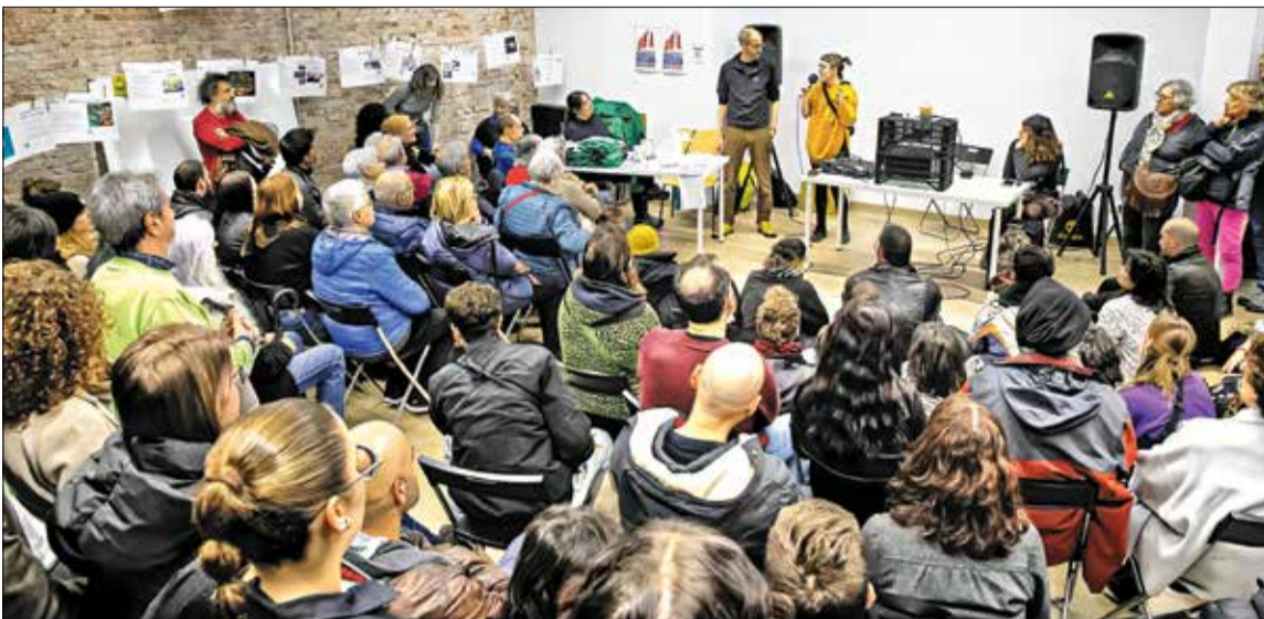
▲ Asistentes escuchan la presentación durante la inauguración del nuevo espacio