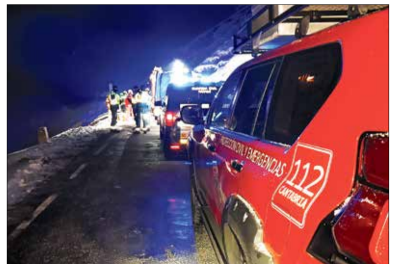
▲ La intervención del 112 de Cantabria.

El Pleno ordinario del Ayuntamiento, celebrado el pasado 25 de marzo en el Palacio de Cibeles, comenzó con un minuto de silencio en memoria de las víctimas.