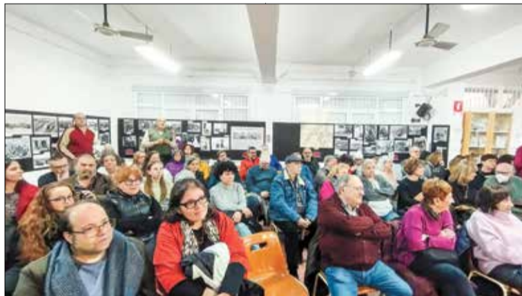
▲ Varios de los asistentes a la ceremonia de clausura, con las fotos de la exposición de fondo

en que las "letras" de este capítulo de memoria histórica vuelvan a poder leerse pronto en otros espacios", dice en su cuenta de Instagram la poeta,