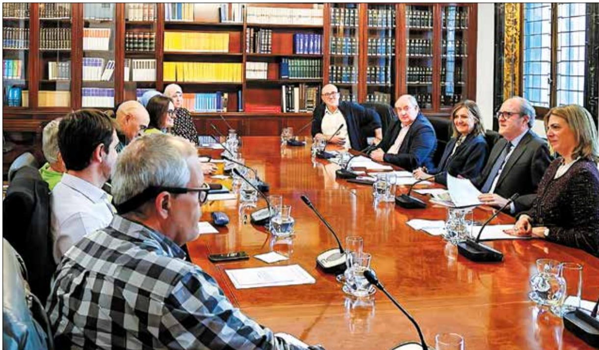
▲ La reunión del pasado 24 de febrero del Defensor del Pueblo con vecinas de la Cañada Real y portavoces de la Plataforma Cívica de Apoyo a la Lucha por la Luz