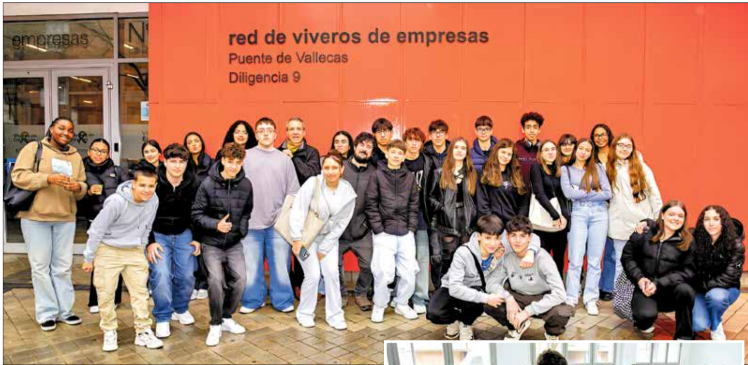
▲ Foto de familia de los participantes en la entrada del Vivero de Empresas de Puente de Vallecas JESÚS INASTRILLAS

El propósito fue brindar a los jóvenes un acercamiento al equipo y colaboradores de un medio de comunicación local, permitiéndoles compartir la experiencia con otros estudiantes