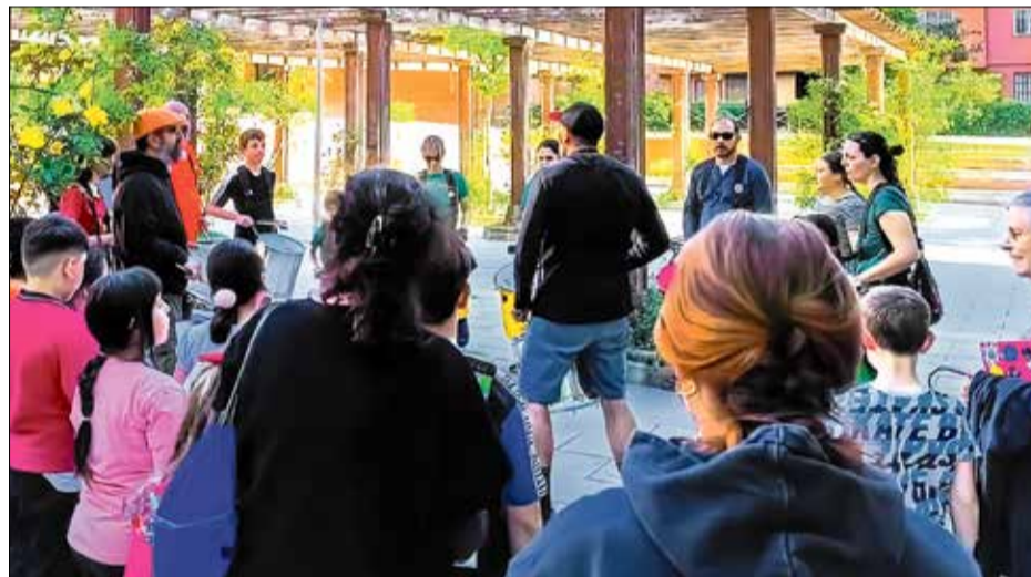
◀ La lectura organizada por Ciudad Joven y la Asociación Vecinal La Unión en la XXV edición