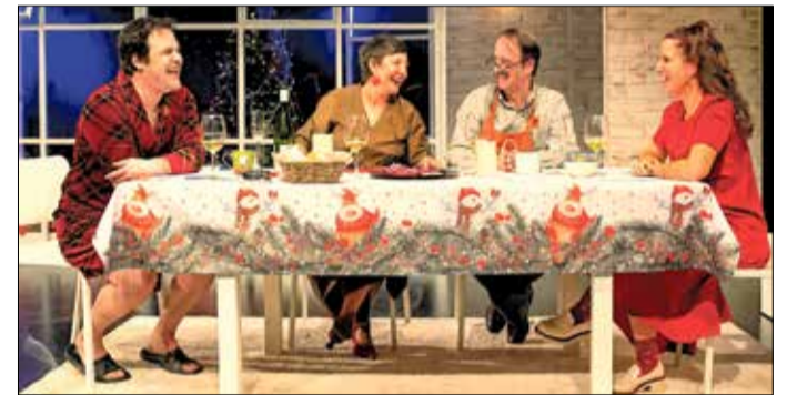
▲ Los protagonistas de la función