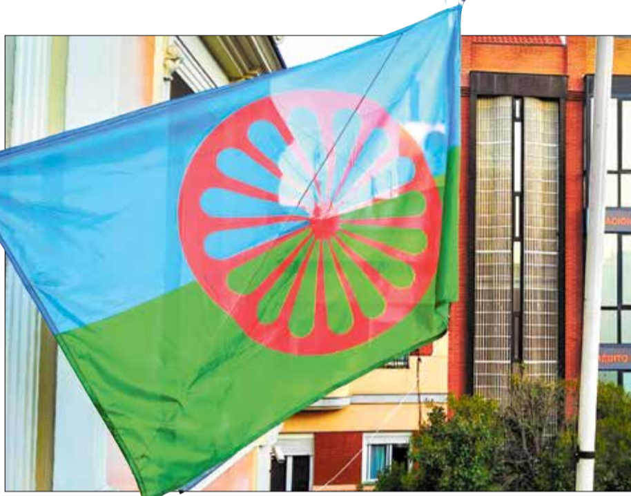
▲ La bandera del pueblo gitano representa el cielo, el campo y la libertad de movimiento

Los determinantes sociales de la salud son factores económicos, sociales y ambientales que influyen en el bienestar de las personas y tienen un impacto en los resultados de salud: educación (menor nivel educativo limita el acceso a información y empleo en mejores condiciones,