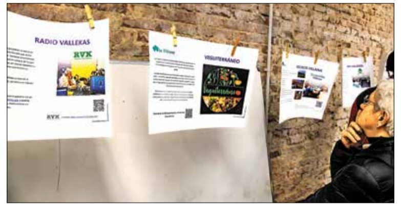
▲ Una vecina contempla los diferentes proyectos que se desarrollan en la Villana J. INASTRILLAS