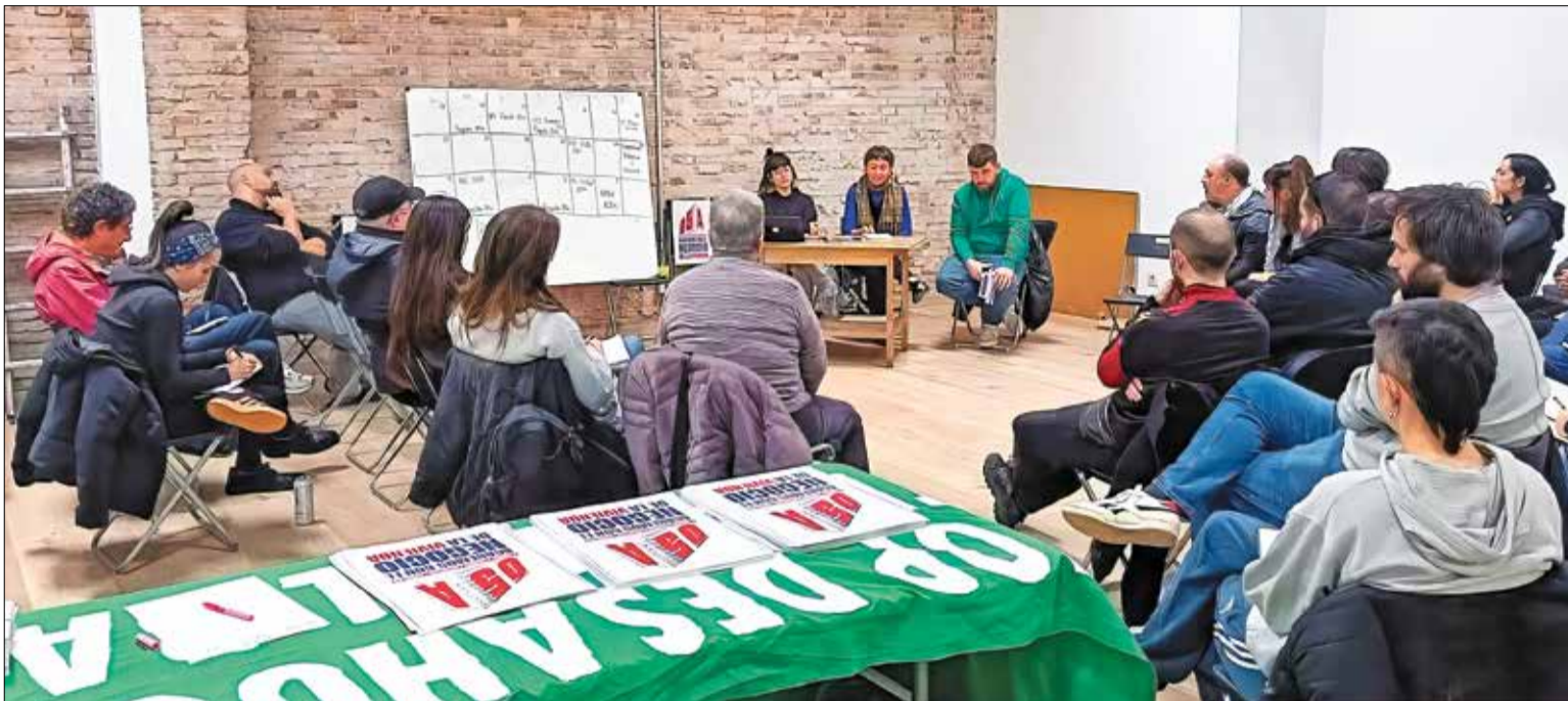
▲ La asamblea abierta del pasado 16 de marzo tuvo lugar en la Villana de Vallekas