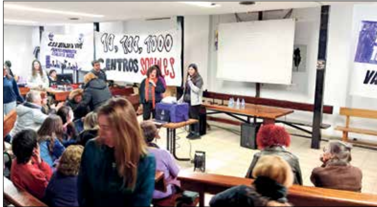
▲ Un momento de la Jornada Feminista Vallekana del pasado 22 de febrero

● Reivindicación feminista y cultura se darán la mano para conmemorar el Día Internacional de la Mujer en los dos distritos