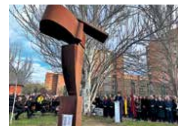
▲ El acto in memoriam que tuvo lugar en 2024 en Santa Eugenia

Al igual que en años anteriores, se llevarán a cabo diferentes minutos de silencio, ofrendas florales y se interpretará música de cámara.