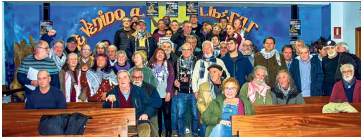
▲ Foto de familia de los asistentes al final del Encuentro Estatal Dignidad.

Fuentes municipales explican que los objetivos principales son el impulso de la movilidad sostenible, a través del fomento de espacios para peatones y ciclistas, y la mejora del transporte público, con conexión entre autobús, metro, tren y bicimad. Para ello, se llevará a cabo la construcción de una pasarela sobre la M-40, una conexión con el anillo ciclista, enlaces peatonales y ciclistas en la calle de Arboleda y en la Avenida de la Albufera y la reforma del entorno del Colegio Público de Educación Especial (CEE) de la avenida del Campus Sur. También se abrirán tres nuevas estaciones de bicimad, se instalará una pantalla acústica en la M-40 a la altura del colegio y se ejecutará la conexión de todo este ámbito del intercambiador de Sierra de Guadalupe.