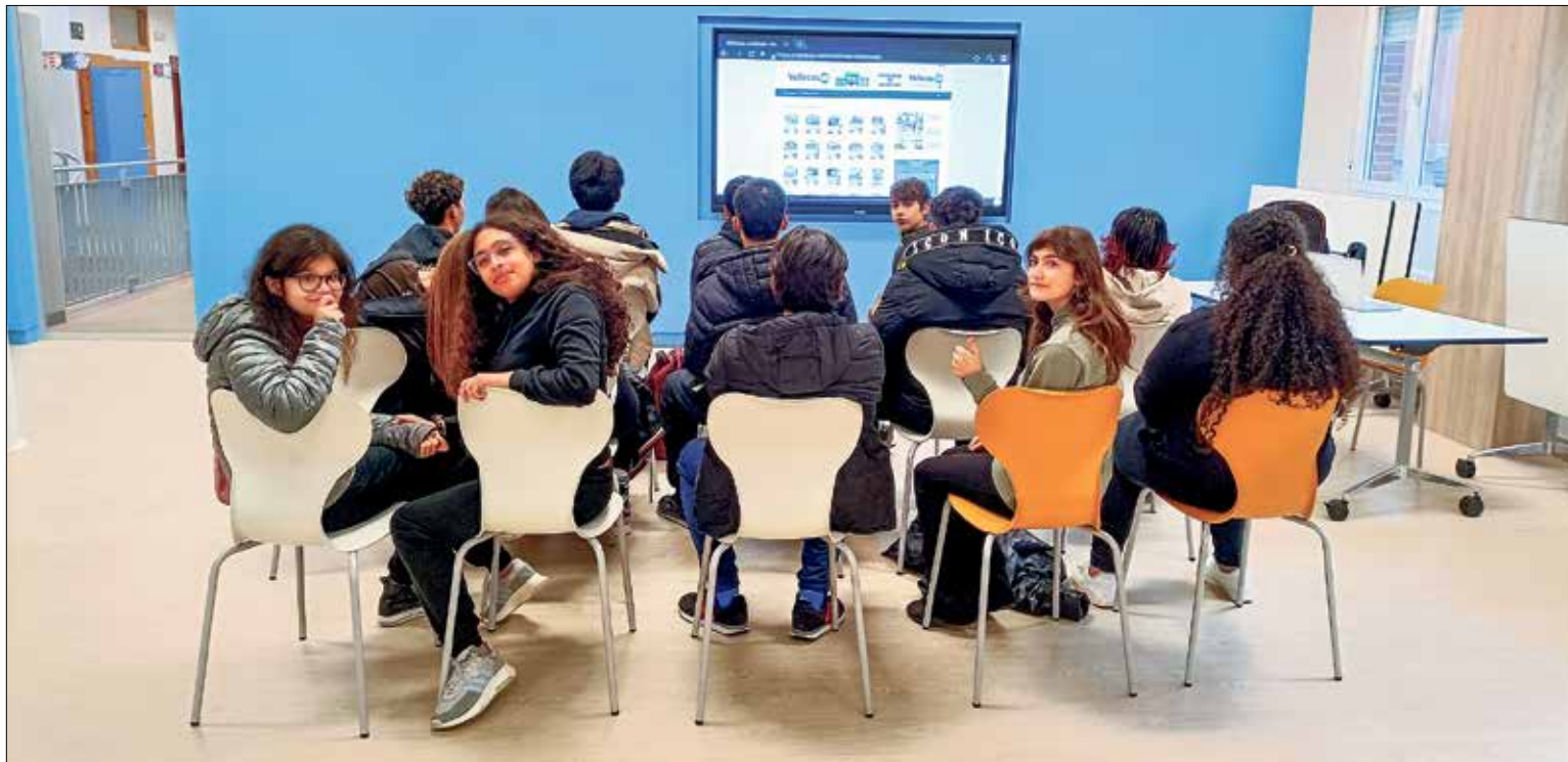
▲ Los alumnos del 3º de Diversificación del IES Madrid Sur, en clase