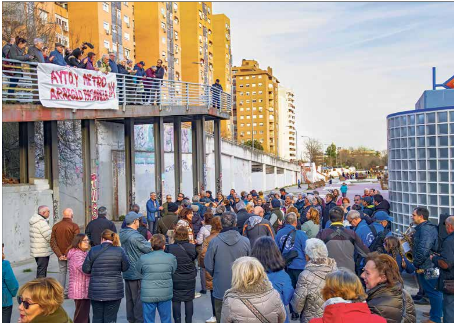
▲ Los asistentes a la concentración convocada por la Asociación Vecinal de Palomeras Sureste.