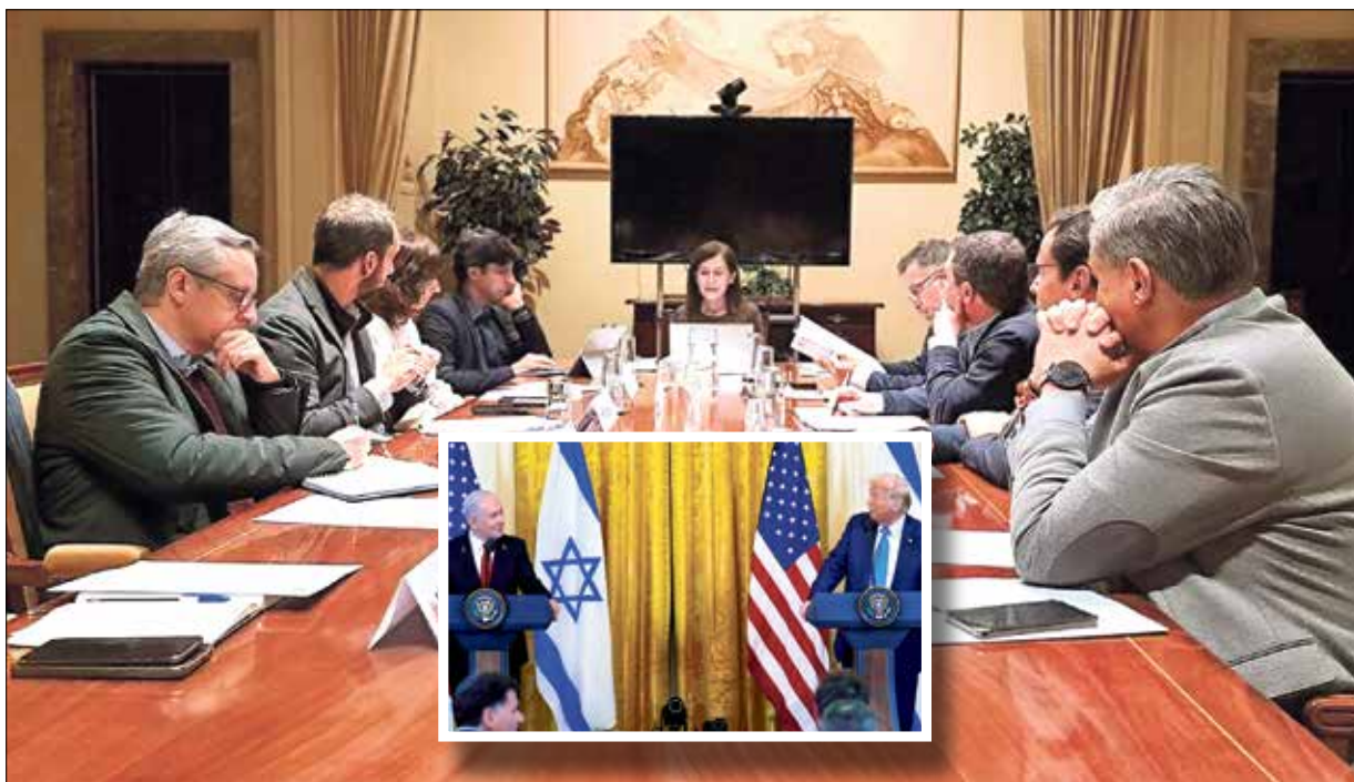
▲ Trump y Netanyahu dan a conocer su plan de limpieza étnica y la Comisión de Realojos da a conocer su plan extraordinario de realojos