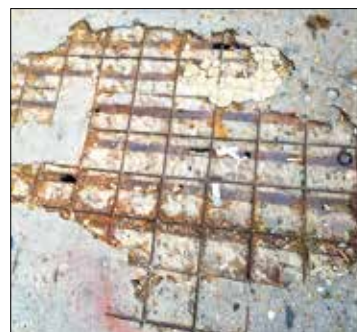
▲ Estado actual de la infraestructura AV PALOMERAS SURESTE

Los residentes denunciaron que los agujeros han aumentado con el tiempo, dejando expuesta la trama de hierro y generando un riesgo evidente para los peatones