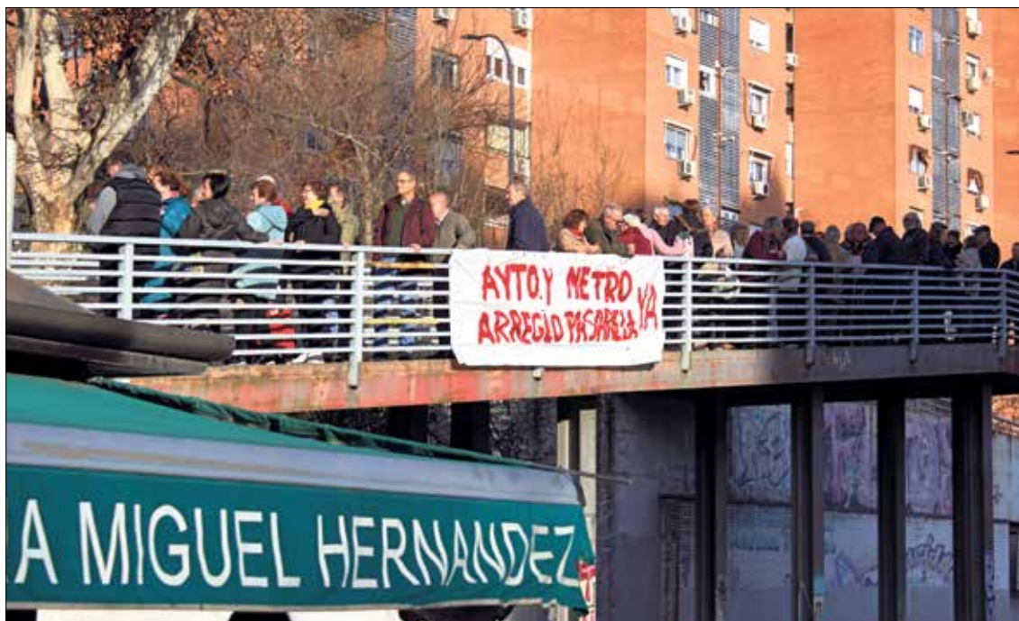
▲ La cadena humana que rodeó la pasarela peatonal de Miguel Hernández