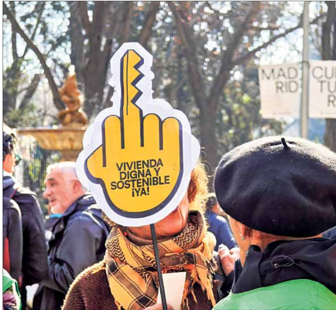
▲ Una de las manifestantes, con un dedo en forma de llave

"Al vivir con mis padres, por suerte no estoy afectado en este momento por el problema de la vivienda, pero creo que en el barrio en general es una problemática que hay que abordar cuanto antes. En vez de mejorar a la clase más desfavorecida, lo que pasa es que a la gente con más dinero se la favorece más. Puede comprar más pisos y alquilarlos más caros. Entonces para los que somos jóvenes