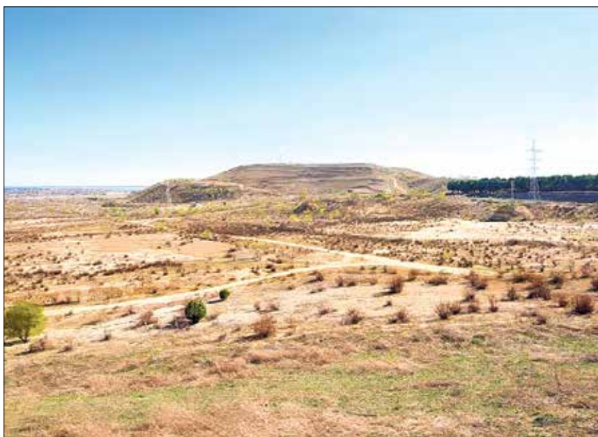
▲ Al fondo, el Cerro Almodóvar

En 1927 Alberto Sánchez y Benjamín Palencia se plantean la renovación del arte español frente al arte de vanguardia instalado en Pa-