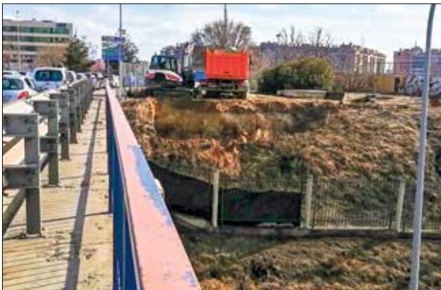
▲ Las obras que se están llevando a cabo en uno de los márgenes de la M-40. AV PALOMERAS SURESTE

● La actuación municipal permitirá la creación de un carril bici que llegará al campus universitario