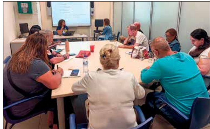
▲ Uno de los talleres de formación de 'Impulso 45+'

Las personas interesadas pueden contactar con la zona que le corresponda por cercanía, en este caso Madrid Sureste (621 415 049), que atiende a los distritos de Puente y Villa de Vallecas, Retiro, Moratalaz y Vicalvaro, o preguntar en las asociaciones vecinales. Pueden hacerlo también escribiendo un correo electrónico a empleo@fravm.org .