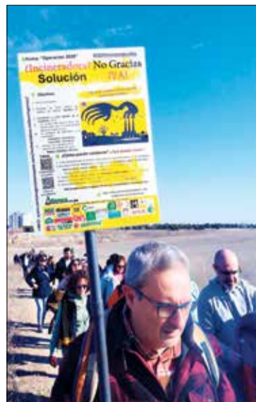
▲ Uno de los carteles que portaron los asistentes a la marcha

su actividad incluso hasta 2040, con el fin de rentabilizar las inversiones de las empresas concesionarias.