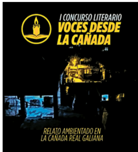
▲ El cartel del certamen literario

"Este premio se crea con el objetivo de difundir y concienciar sobre la situación de la Cañada Real, que lleva ya cuatro años sin suministro eléctrico. Se busca promover la solidaridad y dar a conocer la realidad del barrio, de quiénes lo habitan, de cómo es el día a día de sus vecinos y vecinas. En el marco de la lucha por la vivienda y por un barrio digno, cuáles son los sentimientos, emociones, vivencias y fantasías de quienes personifican la dignidad de lucha, comunidad, resiliencia y solidaridad del barrio", explican sus organizadores.