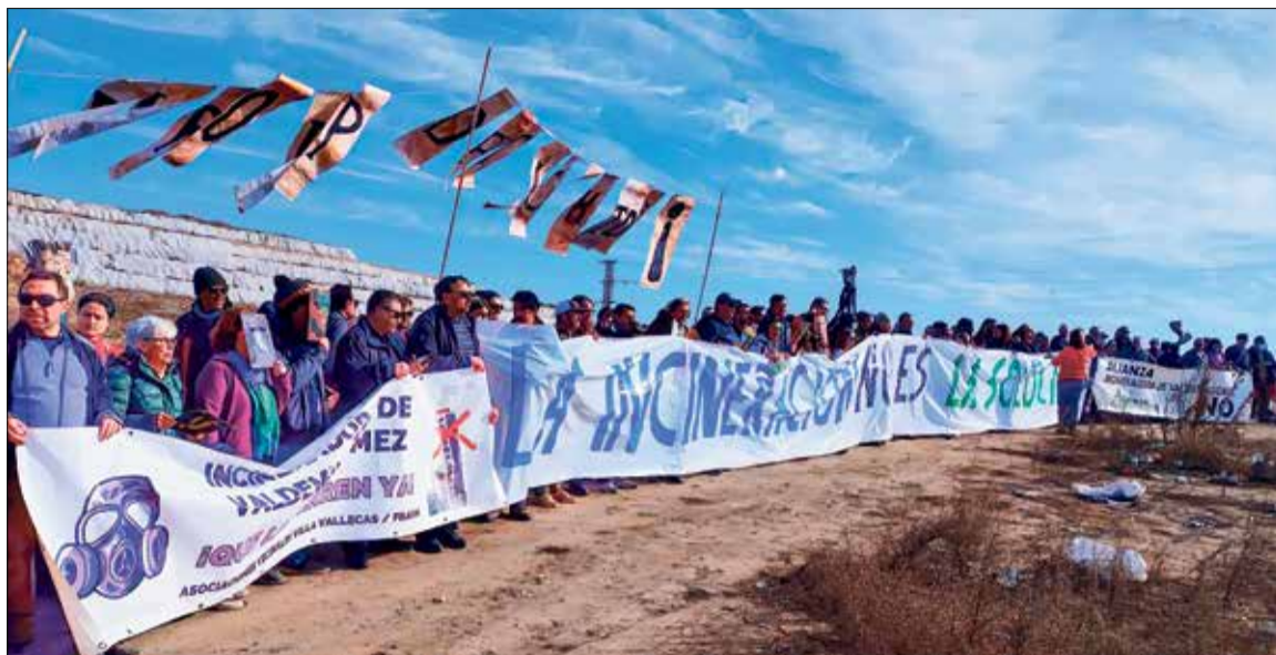
▲ Los vecinos desplegaron varias pancartas junto a la incineradora