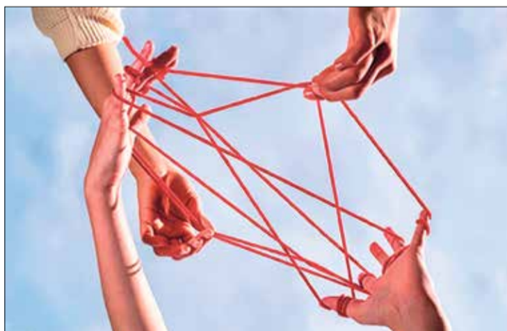
▲ Es fundamental colaborar entre pacientes, profesionales y responsables políticos para reforzar la atención primaria y reducir las desigualdades en salud

Otro aspecto importante es promover la salud y realizar actividades preventivas desde un enfoque comunitario, donde los centros de salud actúen como espacios de promoción de salud. Los profesionales (enfermeras, farmacéuticos, médicos, psicólogas, trabajadoras sociales...) deben colaborar con otros agentes comunitarios (educadoras