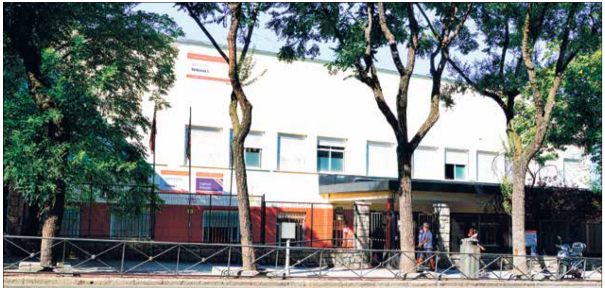
▲ La fachada del IES Vallecas I

Este año se continuarán aplicando las puntuaciones que fueron adaptadas para cumplir con la LOMLOE estatal que, aunque prioriza la proximidad al centro del