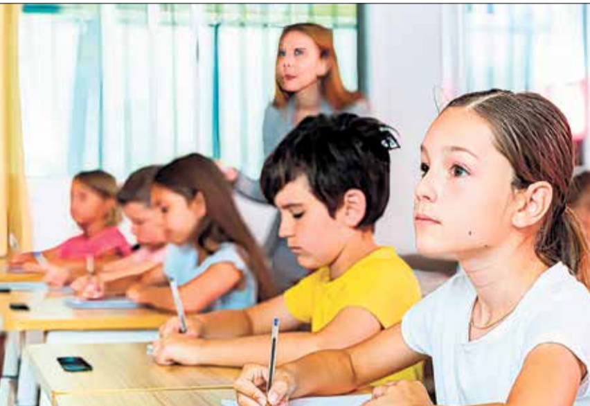
▲ La baremación por hermanos matriculados en el mismo colegio o instituto seguirá siendo la mayor

dos o más. Las calificaciones por el apartado de proximidad al domicilio preservarán el criterio de zona única de escolarización en cada municipio o, en el caso de la capital, distrito municipal, una medida reconocida ampliamente por las familias madrileñas.