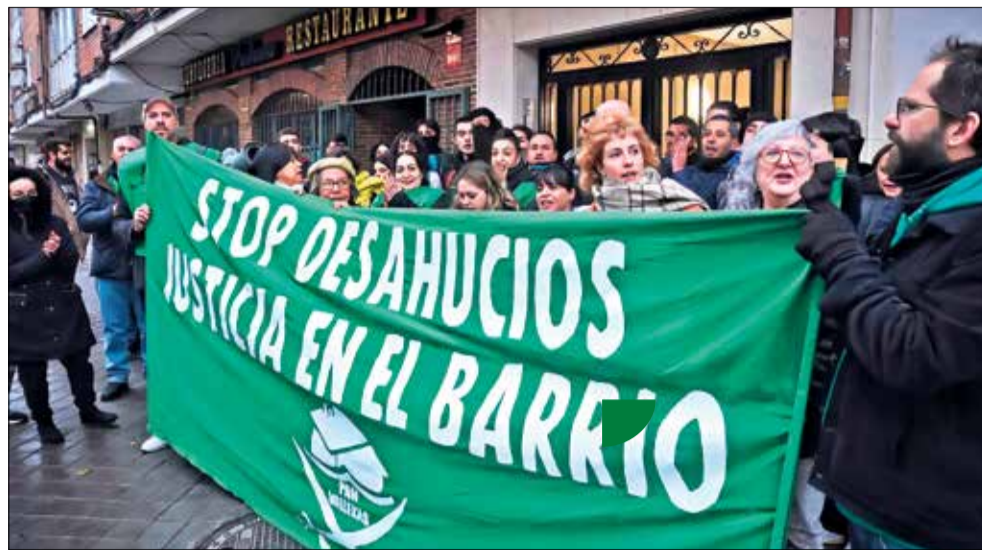
▲ Una de las acciones de la PAH de Vallecas para frenar un desahucio

Además, plantearon, entre otras cuestiones, un incremento del personal sanitario, la reapertura de los Servicios de Urgencias de Atención Primaria (SUAP), mayor inversión en infraestructuras sanitarias, un plan de choque para reducir las listas de espera quirúrgicas y de consultas especializadas, el refuerzo de la salud mental con más plazas en psicología y psiquiatría, una financiación suficiente y garantizada, y canales de comunicación para que la ciudadanía y los profesionales puedan participar en la gestión y toma de decisiones.