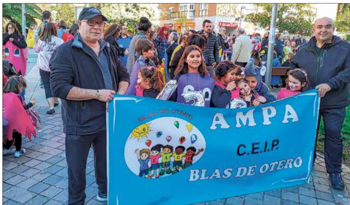
▲ El AMPA del colegio Blas de Otero participó en la edición del pasado año

Los interesados en ponerse en contacto con la organización, pueden hacerlo mandando un