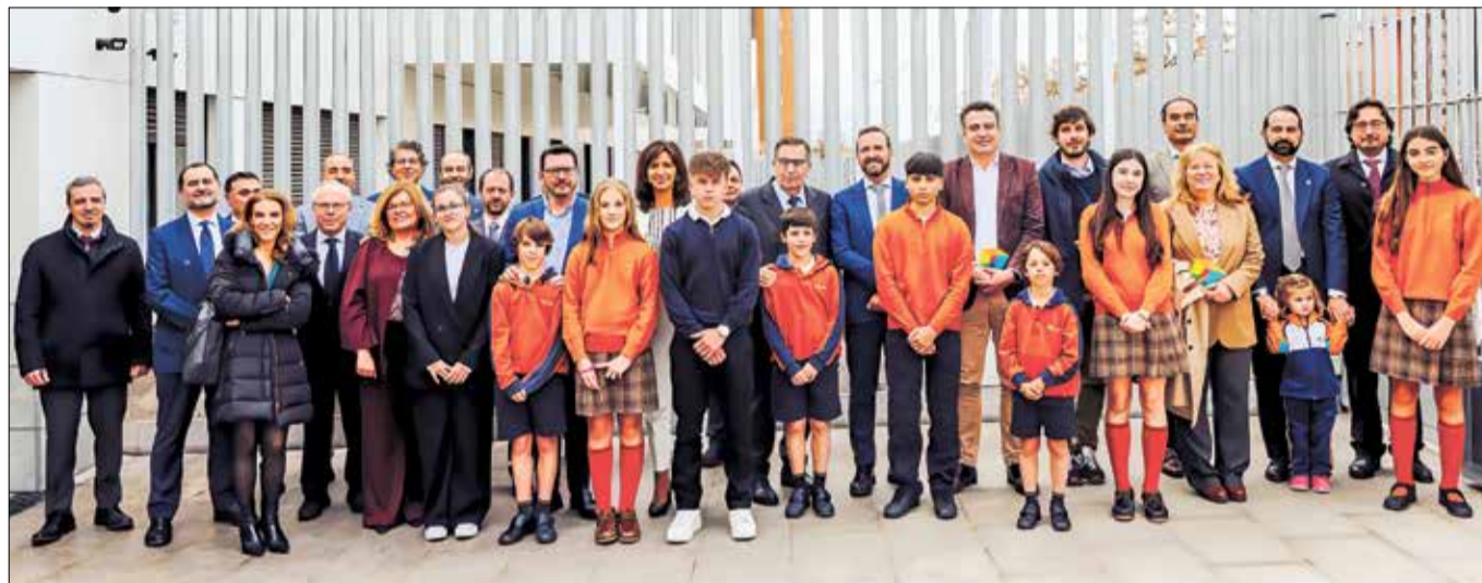
▲ Autoridades y alumnos posan tras la inauguración oficial

La inauguración comenzó con un recorrido general por todo el centro,