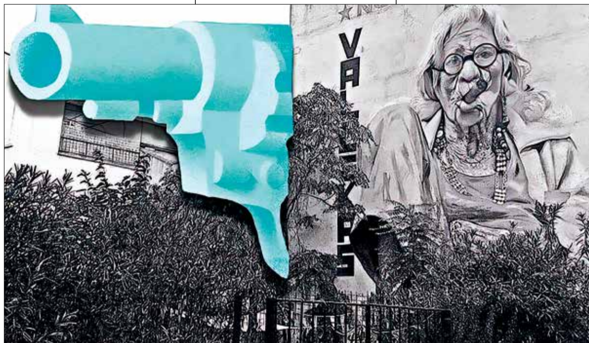
▲ El cartel de la edición de 2025