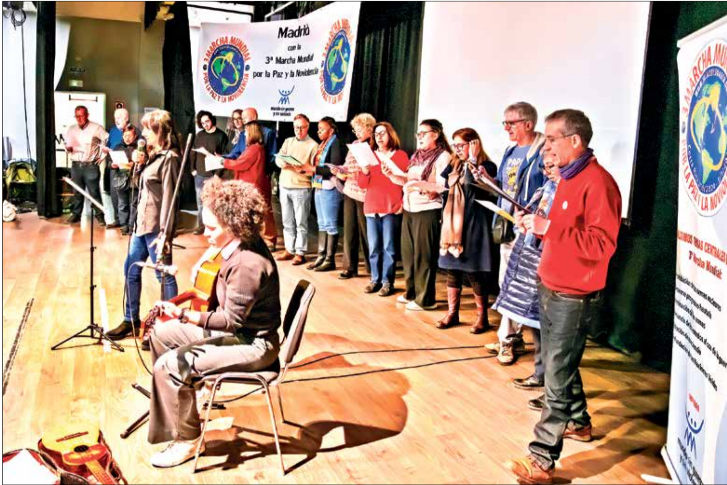
▲ El Dúo Valor, acompañado por coralistas, interpretaron la canción 'Sólo le pido a Dios'