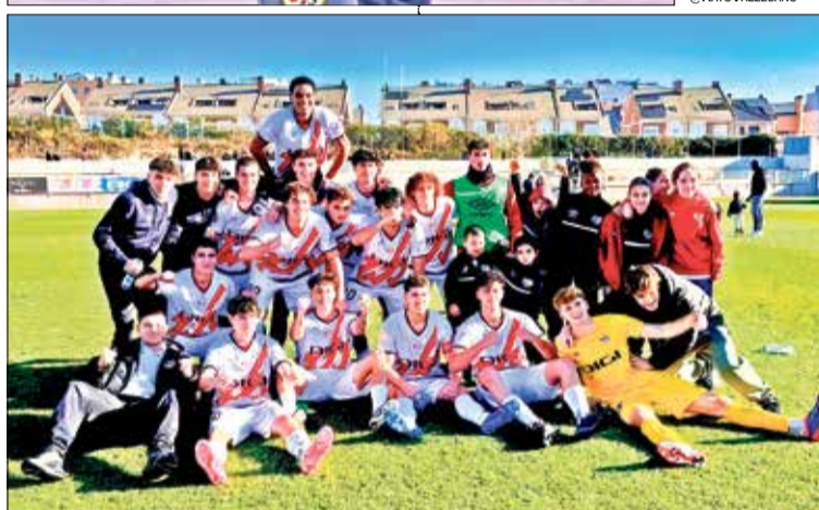
▼ Los jugadores del Rayo cerraron el año con una gran victoria en la Ciudad Deportiva por 3 a 2 contra Las Rozas