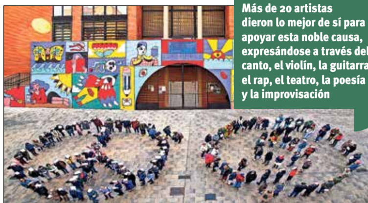
▲ Los símbolos de la Paz y la No violencia realizados por los participantes al encuentro