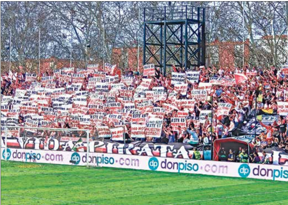
▲ La afición mostró carteles en defensa de la continuidad del Rayo en su estadio