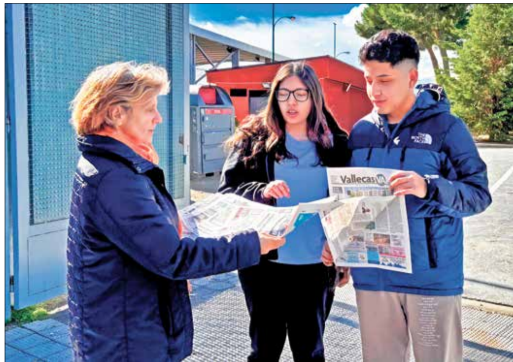
▲ Una trabajadora de Vallecas VA entrega el periódico a dos jóvenes