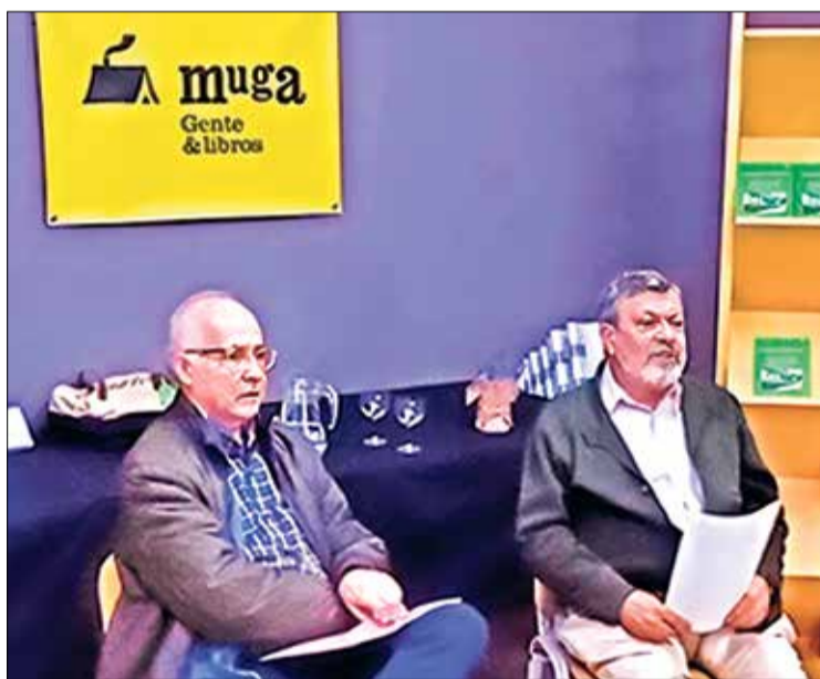
▲ Un momento de la presentación del libro en la Librería Muga