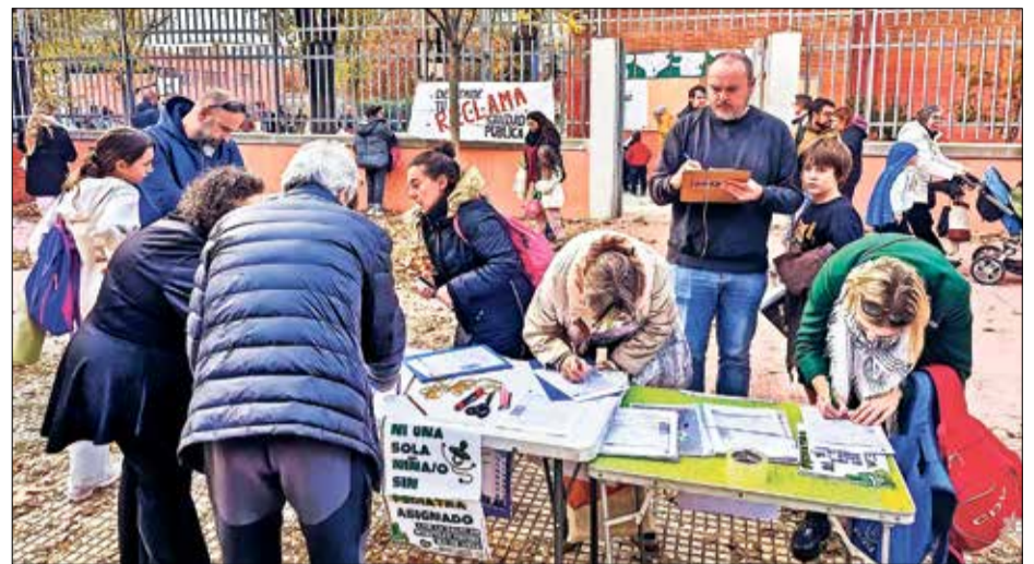
Una de las mesas instaladas a la salida de un colegio de Puente

La Asociación de Comerciantes minoristas del Mercado de Doña Carlota, que gestiona por concesión del Ayuntamiento de Madrid este centro comercial situado en el número 16 de la calle de Doctor Lozano, cedió el mencionado espacio en 2019 a la Asociación Vecinal Doña Carlota Numancia de manera verbal para dar impulso al mercado. Durante este tiempo, el colectivo ciudadano desarrolló, entre otras actividades, la única biblioteca existente en el barrio, gestionada de forma voluntaria por las propias vecinas y vecinos, y una 'escuelita', que permitió dar clases de apoyo escolar a niñas y niños vulnerables en el barrio. Además, este local fue sede de iniciativas como la premiada por la Unión Europea Somos Tribu, que tejió una red de apoyo vecinal que palió los efectos de la pandemia de 2020.