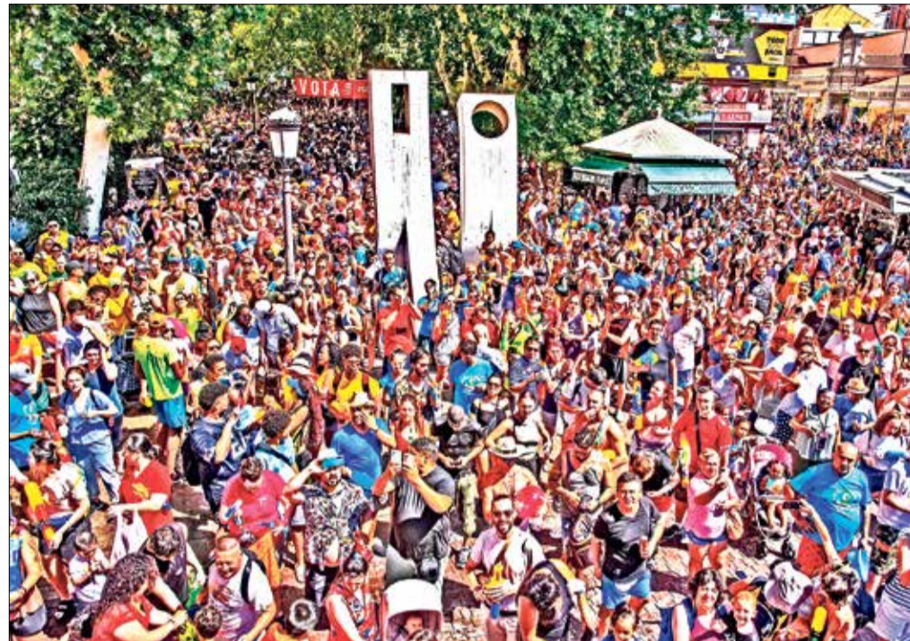
▲ La multitudinaria participación de la última Batalla Naval