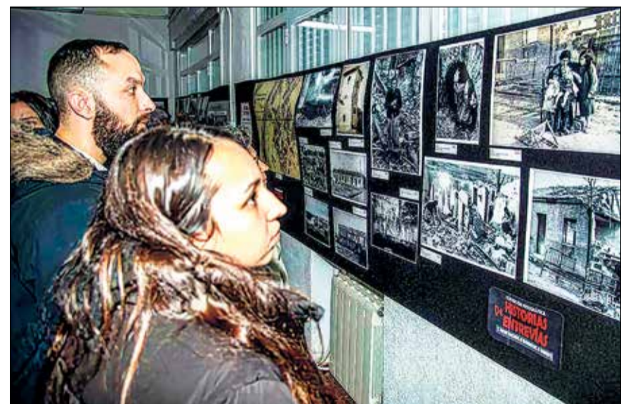
▲ Dos vecinos contemplan algunas de las imágenes