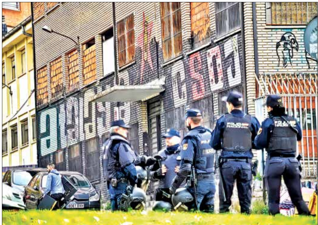
▲ La Policía Nacional desalojó La Atalaya el 26 de noviembre