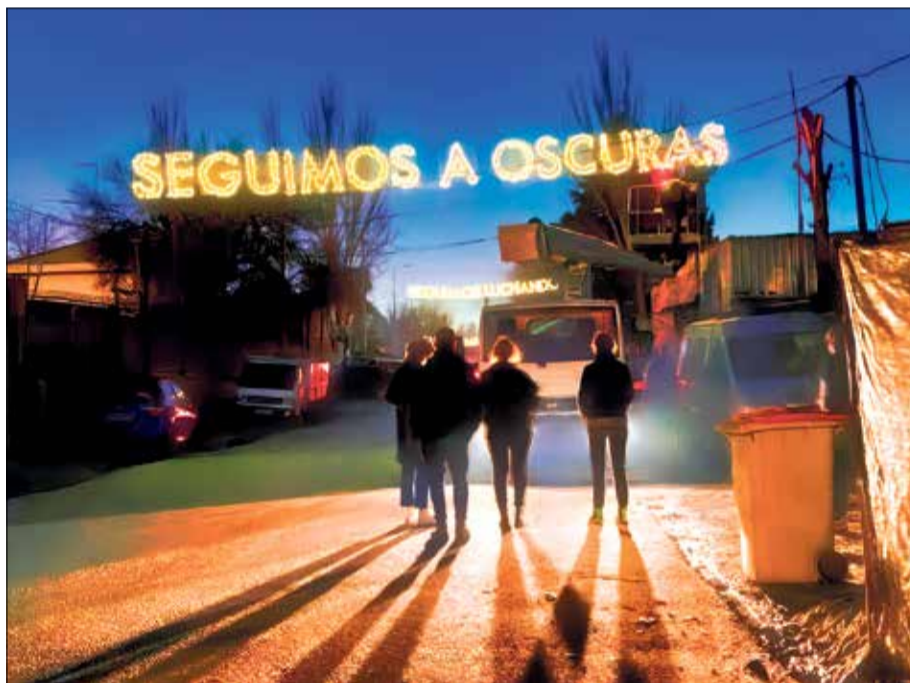
▲ Europa apoya al barrio de la Cañada Real en su lucha por la luz

Ahora, al Estado español, empezando por el Gobierno de la nación, pero también los de la Comunidad de Madrid y de los Ayuntamientos de Madrid y Rivas-Vaciamadrid, no le queda otra que devolver la luz al barrio de Cañada Real, permitir que se hagan contratos de suministro eléctrico y dar participación real y efectiva a los habitantes, a través de sus asociaciones, también en la solución a la falta de suministro. Que todos esos Gobiernos sean muy conscientes de que la ciudadanía sabe que están obligados a devolver la luz al barrio de Cañada Real y que nosotros estamos comprometidos a no cejar hasta que cumplan con sus obligaciones.