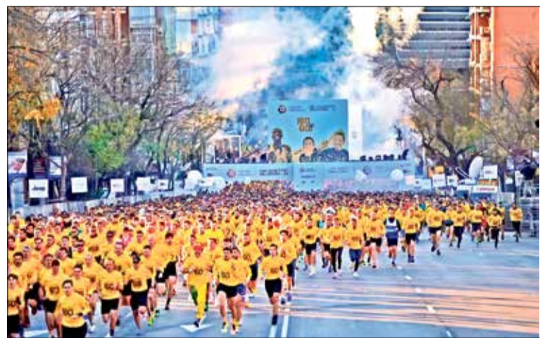
▲ La salida de la carrera popular