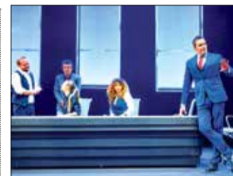
▲ Un momento de la función