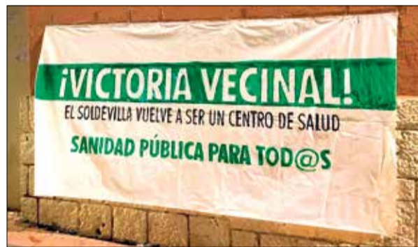
▲ La pancarta desplegada en una de las paredes del centro de salud O.A.

del MIR, que presentaron una candidatura grupal para ocupar algunas de las plazas vacantes en el ambulatorio. Estos residentes no dudaron en asegurar que se trata de un triunfo de la lucha vecinal. "Cuatro años pidiendo más personal sanitario para el Vicente Soldevilla, y hoy es una realidad. La defensa de la sanidad pública será siempre una prioridad para el barrio", comentó la Asociación Vecinal