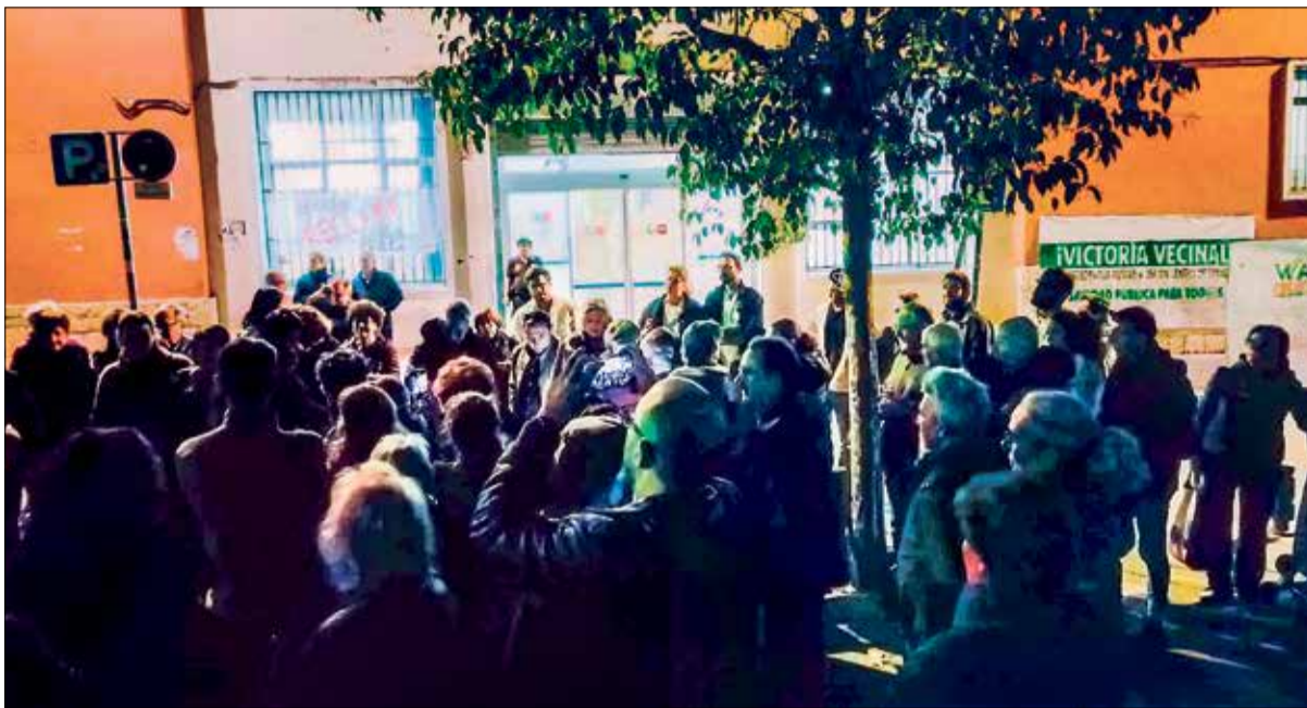
▲ Un momento de la concentración vecinal