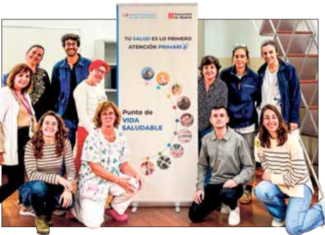
▲ Las enfermeras y enfermeros que están detrás de nuestra sección 'De la mano de tu enfermera'

Estamos con vosotros y vosotras desde 2020, fruto de una necesidad, a raíz de la pandemia, de saber que todos necesitábamos de todos en un momento tan duro que nos hacía muy vulnerables en lo físico, en lo emocional y en lo social. Ese inicio nos