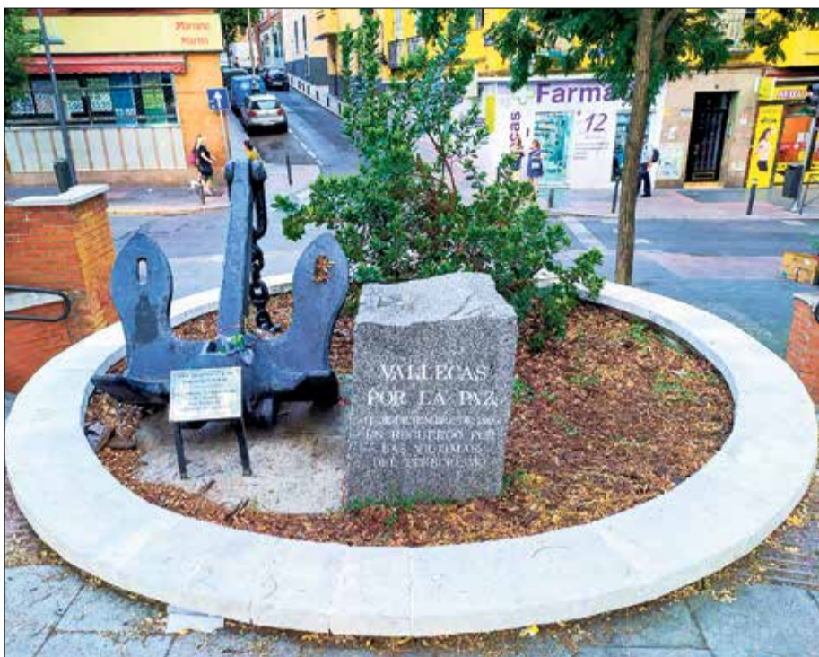
▲ El monumento a las víctimas del atentado terrorista de ETA de diciembre de 1995, en Puente de Vallecas

Las prácticas injustas de cualquier tipo despiertan formas violentas. La cultura de la violencia alimenta la espiral de violencia