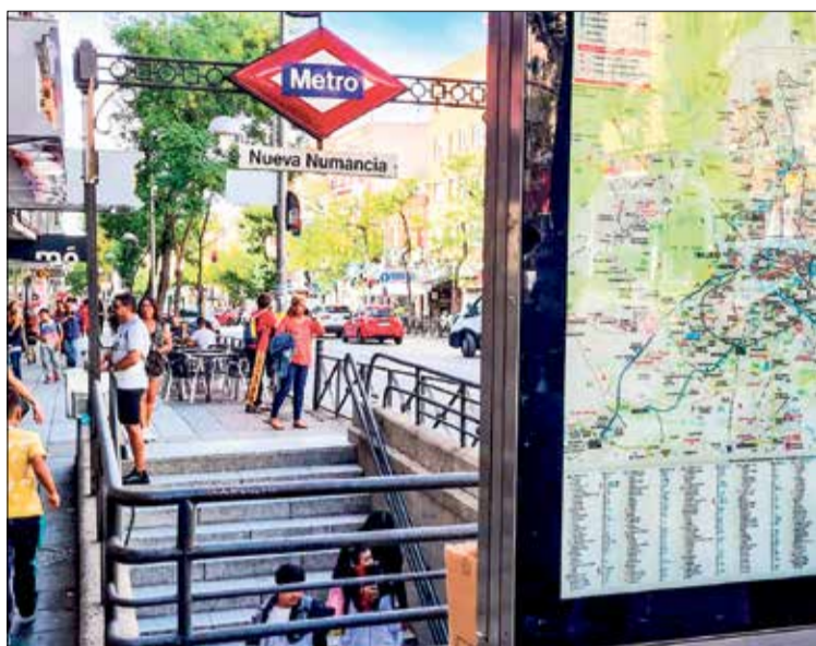
▲ La entrada al Metro de Nueva Numancia.