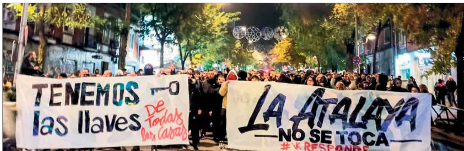
▲ La pancarta que abrió la manifestación del pasado 26 de noviembre