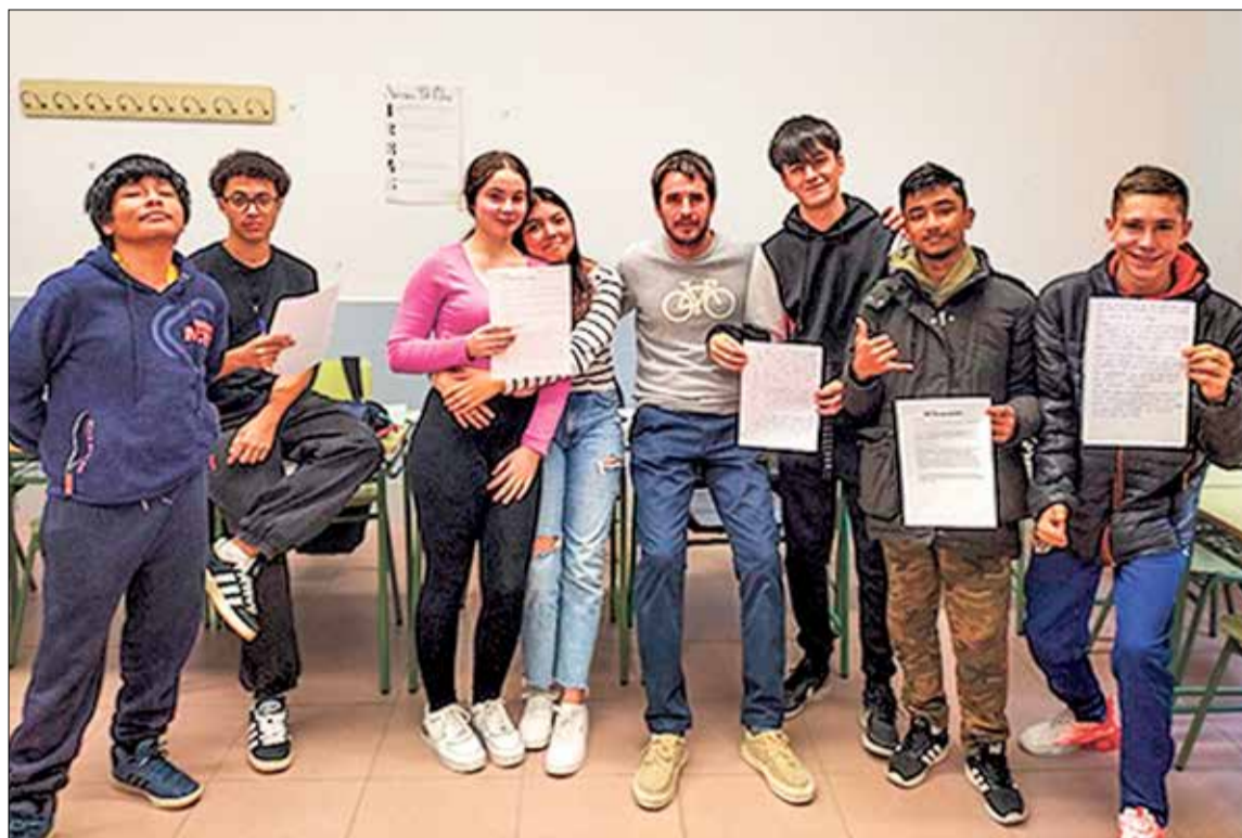
▲ Alumnos y alumnas del curso 4º Diversificación muestran los artículos publicados en el periódico con su profesor de ámbito socio-lingüístico IES MADRID SUR

Todo el tiempo tenemos que estar acostumbrados a ver y vivir cada día situaciones de racismo. En España lleva ocurriendo esto desde hace mucho tiempo. El racismo es uno de los principales problemas en la integración y en la convivencia de muchas personas que venimos de otro sitio y más en un barrio tan multicultural como es Vallecas. Además, muchas