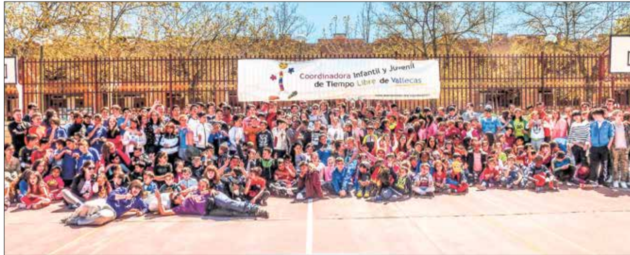
▲ Los participantes de una de las actividades de la coordinadora

Este año, la red de la coordinadora está celebrando su 35 aniversario, un hito que representa más de tres décadas de dedicación, esfuerzo y