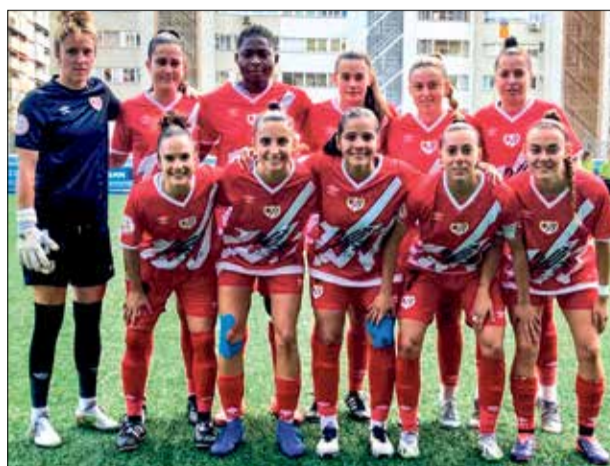
▲ El once inicial del Rayo Femenino frente al Club Esportiu Europa