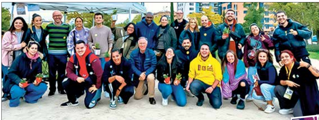
▲ Representantes de diversas entidades que conforman Red VIVA

Este evento congregó a 213 personas del Ensanche de Vallecas y alrededores, participando tanto población infanto-juvenil (128), como adultos (85). Se hicieron