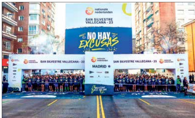
▲ La salida de la San Silvestre Vallecana popular de 2023

Las calles de Puente de Vallecas volverán a ser el escenario del tramo final de una nueva edición de la San Silvestre Vallecana que, como viene siendo tradición desde 1964, se disputará en la tarde-noche del 31 de diciembre. Deporte y fiesta