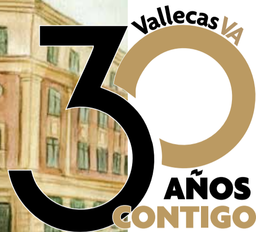
El dibujo realizado por la ilustradora vallecana Isabel Ruiz Ruiz para la campaña de suscripciones