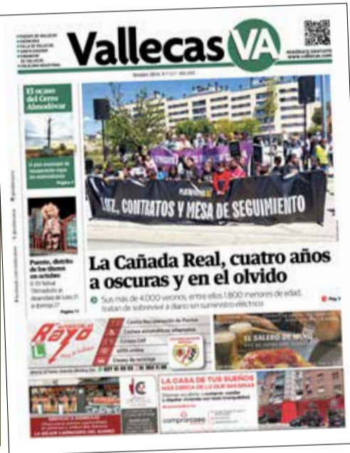
El número de Vallecas VA de octubre de 2024