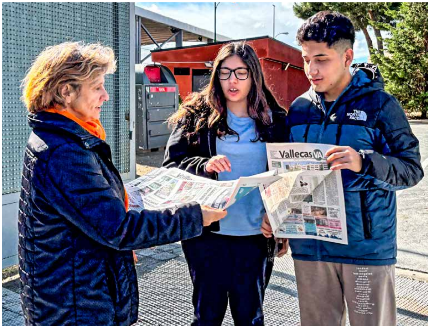
▲ Una trabajadora de Vallecas VA entrega un ejemplar del periódico a dos jóvenes