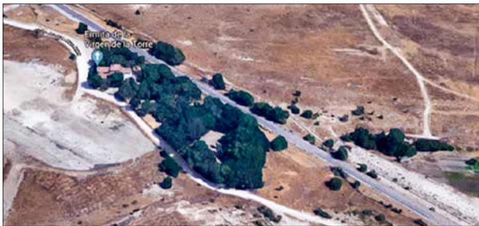
◀ Los terrenos situados junto a la ermita de la Virgen de la Torre