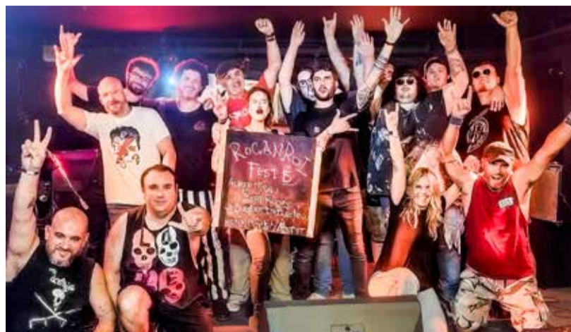
▲ Los participantes en la quinta edición del festival