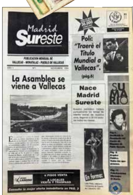
La primera portada, de noviembre de 1994