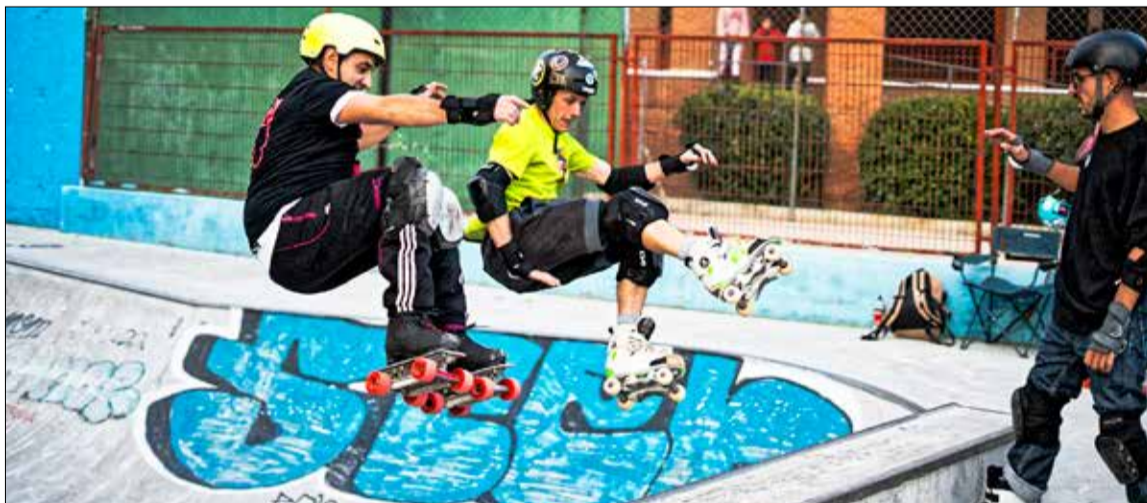
▲ Dos patinadores, en las instalaciones deportivas situadas en la calle de Real de Arganda

se realizan de forma periódica y ordinaria inspecciones en las estructuras y pasarelas y que, fruto de estas revisiones, se detectaron deterioros propios de la vida útil en ambos puentes. Mientras culminan estos trabajos, el único itinerario alternativo para cruzar la A-3 es la pasarela con escalones y rampas ubicada en el kilómetro 9,200.