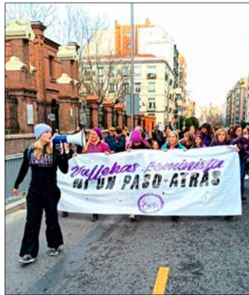
Una de las manifestaciones feministas por las calles de Vallecas @8MVALLEKAS

es crucial que el 25-N no sea solo una fecha conmemorativa, sino un llamado a la acción. Se necesitan políticas públicas efectivas, educación en igualdad desde edades tempranas y sistemas de protección que garanticen que las mujeres puedan vivir libres de miedo. Pero la lucha no debe recaer únicamente en las víctimas o en las organizaciones de mujeres. Es responsabilidad de toda la sociedad, de las instituciones,