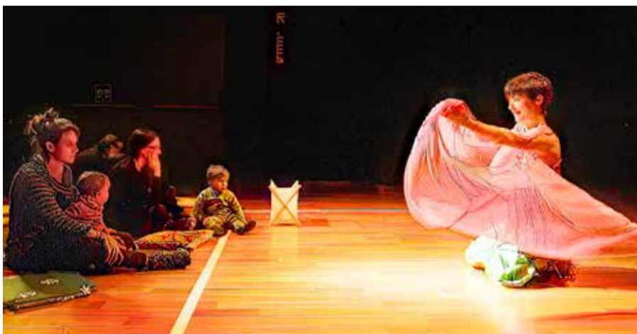
▲ Una escena de la obra de teatro y danza para bebés 'Qué brisa la risa'.