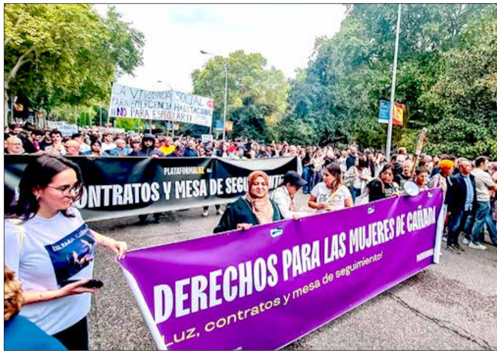
▲ La Plataforma Cívica de Apoyo a la Lucha por la Luz de Cañada Real Galiana, en la manifestación por el derecho a la vivienda del 13 de octubre

público el contenido de la decisión todavía hay un plazo que puede durar hasta cuatro meses. No obstante, la esperanza de los habitantes de Cañada Real y de cualquier persona que esté preocupada por el respeto y la defensa de los derechos humanos es muy alta, ya que el propio comité europeo se pronunció por unanimidad, en octubre de 2022, exhortando a las autoridades públicas competentes para que, con el fin de evitar un daño grave e irreparable a la vida y la integridad física y moral de sus habitantes, tomasen las medidas que fuesen necesarias para garantizar el acceso inmediato a la electricidad y a la calefacción. Las autoridades siguen haciendo caso omiso de esa exhortación del comité, pero ahora cabe esperar que, ante una decisión final de obligado cumplimiento, el Estado español no pueda si no restituir la electricidad. Lo contrario sería su completa deslegitimación moral y jurídica en el