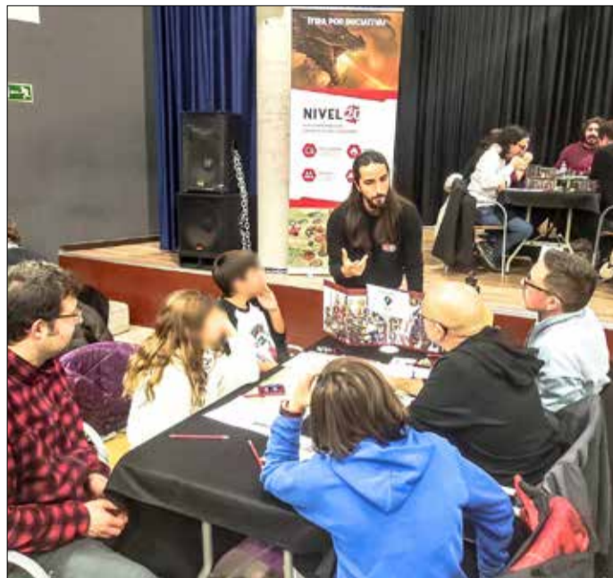
▲ Una partida de rol de la pasada edición

La asociación Bukane-ros del Rol organiza- rá el sábado 16 de no- viembre, de 10 a 20 horas, las IX VillaRol, Jornadas de ocio lúdico y alternativo de Vallecas, en el Centro Ju- venil El Sitio de mi Recreo (calle de Real de Arganda, 30), en Villa de Vallecas. Co- mo cada año y con la inten- ción de acercar esta forma de ocio a la ciudadanía, jue- gos de rol y de mesa, minia- turas, cosplay, stands y ta- lleres llenarán de actividad toda la jornada. En 2024 se remarca su perfil solidario,