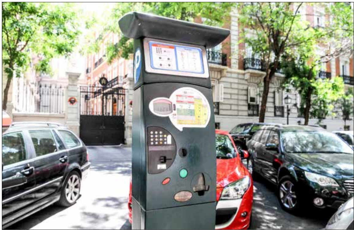
▲ Los vecinos de Puente tendrán que decidir si quieren o no los parquímetros