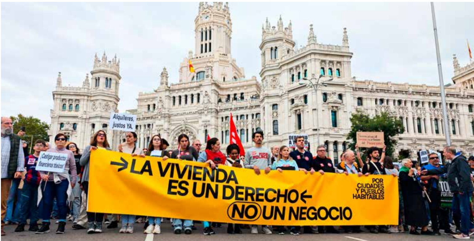
▲ La manifestación que recorrió las calles del centro de la capital el 13 de noviembre

El piso más económico en alquiler en Puente de Vallecas es un estudio de 26 metros cuadrados por 580 euros mes y en Villa, un piso de un dormitorio por 800