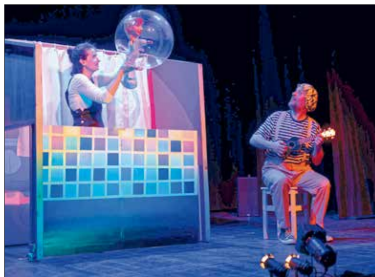
▲ El festival está dirigido a las personas amantes del teatro de títeres, visual y objetos

Con motivo de su 15 aniversario, UNIMA Madrid ha redoblado esfuerzos para ofrecer una edición especial. Para ello, se ha decidido concentrar todas las actividades en un solo distrito, Puente de Vallecas, que se transformará durante una semana en el 'Distrito de los títeres de Madrid'. Asimismo, se ha buscado innovar con una programación que incluye espectáculos, instalaciones y talleres inéditos en la capital.