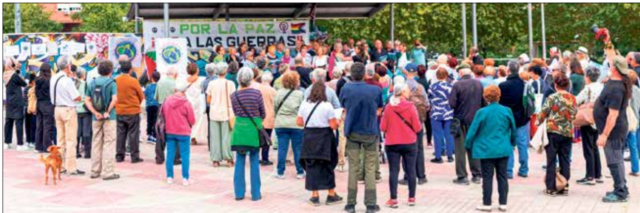
▲ Un momento del encuentro coral