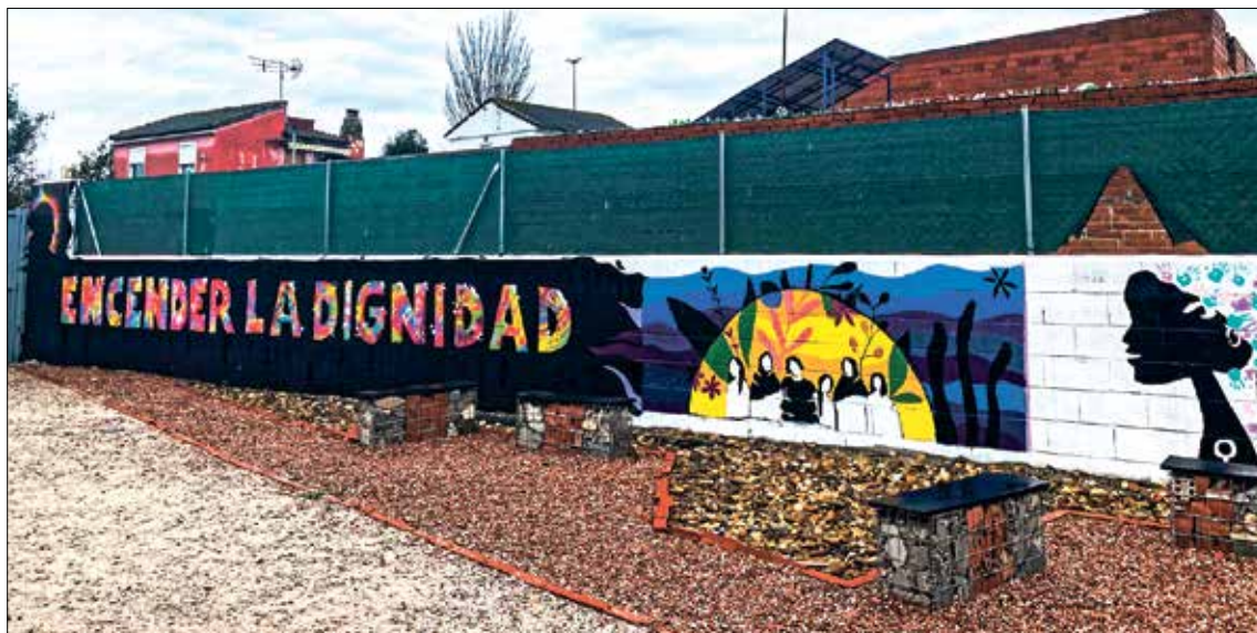
▲ Uno de los murales pintados en una pared de Cañada Real que reivindica el restablecimiento del suministro eléctrico PLATAFORMA LUZ

casa y pudieran tomar posesión del terreno que habitan.