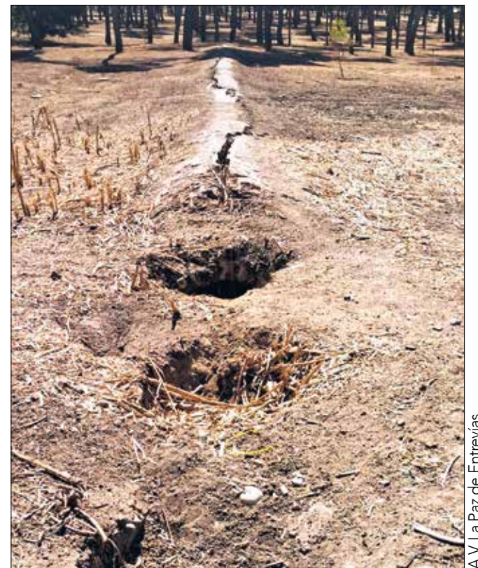
A.V. La Paz de Entrevías