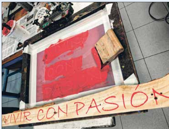
▲ El trabajo es un pilar fundamental para la identidad personal, la autoestima y el bienestar

Los últimos datos publicados por la Dirección General de Atención a Personas con Discapacidad así lo demuestran. En 2023 de las 1.971 plazas disponibles, se han insertado el 57,3 % de hombre y el 42,7 % de mujeres, respectivamente, con una tasa de inserción laboral del 65,45%.