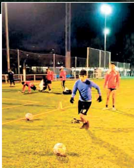
▲ Los juveniles del Atlético Vallecas entrenan a oscuras en uno de los campos de Santa Eugenia

"Nuestro primer equipo de fútbol tiene nueva casa. Entrenará y jugará sus partidos como local en el CDM Wilfred Agbonavbare. Después de muchos años jugando en nuestro distrito de Villa de Vallecas nos vemos en la obligación de cambiar, debido a la precariedad de las instalaciones que nos proporciona la Junta Municipal y la falta de instalaciones municipales en el distrito para poder alquilar. Agradecemos el trato y las facilidades del distrito de Puente de Vallecas para poder