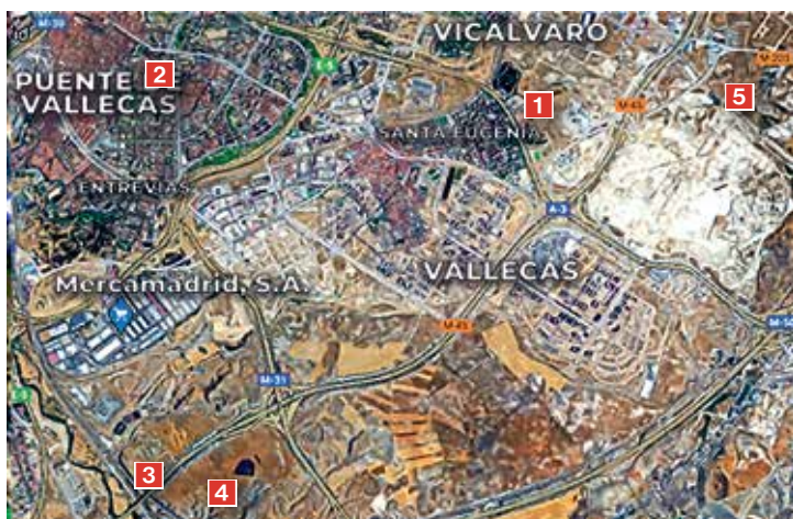
1 Cerro Almodóvar, 2 Loma de Chiclana, 3 Cerro de la Gavia, 4 Los Llanos, 5 Torrepedrosa.

Aunque después de la presencia romana el lugar quedó totalmente despoblado en un par de siglos (...), en la época visigoda se pobló de nuevo: Hacia el siglo V la zona vuelve a ser frecuentada, con un claro carácter estacional que se concreta en una serie de cabañas dispersas, dispuestas en las proximidades de antiguos pozos romanos o altomedievales.