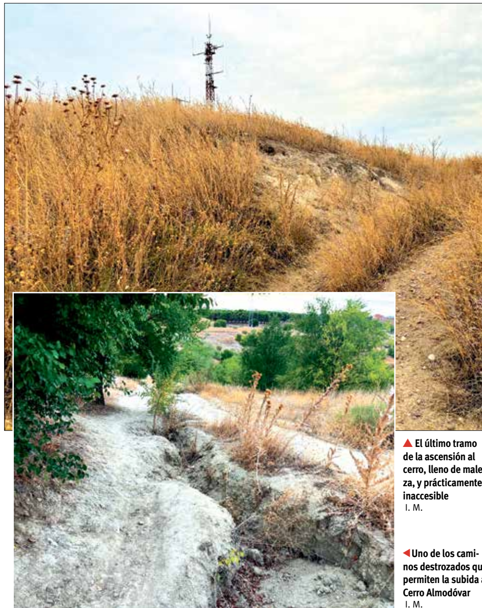
▲ El último tramo de la ascensión al cerro, lleno de maleza, y prácticamente inaccesible I. M.

"El Cerro Almodóvar se encuentra en un preocupante