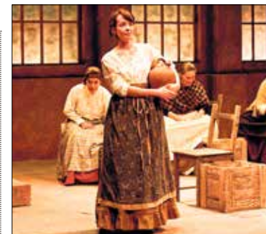
▲ Una escena de la obra.