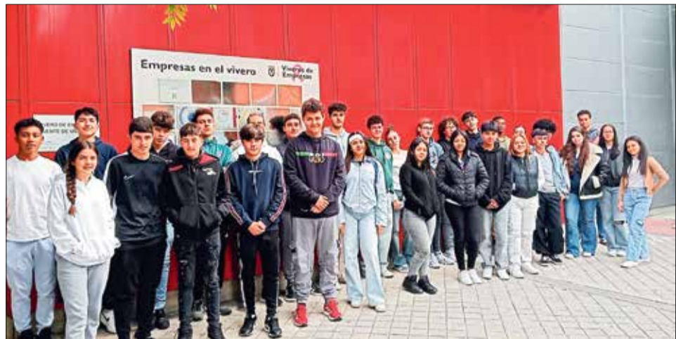
▲ Foto de familia de los alumnos al término de las actividades

"Lo que más nos ha gustado es conocer gente nueva y sobre todo el proyecto, salir