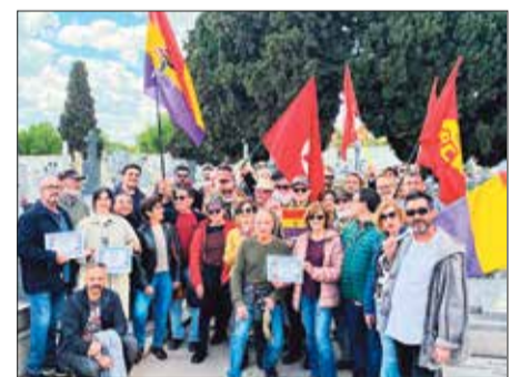
▲ Foto de familia en el camposanto vallecano

Los asistentes, que tras el acto se reunieron en el Centro Social La Trinchera, sede del PCE en Villa de Vallecas, coincidieron en la importancia de reivindicar la memoria democrática en una situación en la que resurgen los métodos y los discursos de la extrema derecha.