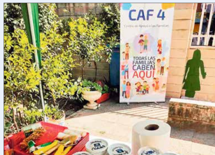
▲ Una de las actividades de ediciones anteriores

En Vallecas contamos con un Centro de Apoyo a la Familia (CAF-4), recurso del Ayuntamiento de Madrid que trabaja junto con las familias para ayudarlas a afrontar las dificultades que surgen en el desempeño de sus funciones. Y como otros años, desde este centro se organizan, en conmemoración