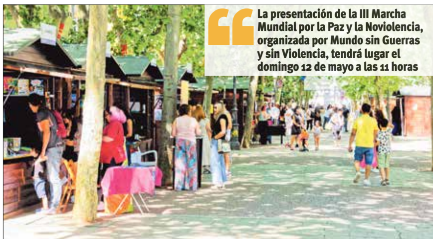
▲ Las casetas instaladas en el Bulevar de Peña Gorbea el pasado año