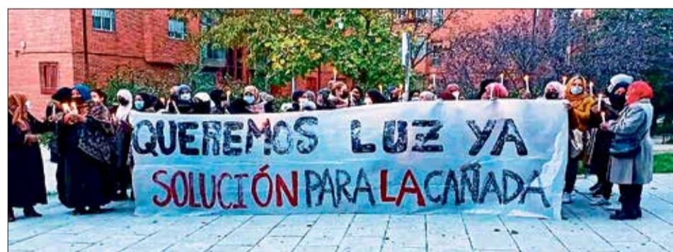
▲ Una de las protestas del vecindario de Cañada Real

A la vista de todo el mundo están las imágenes, los datos y la información que