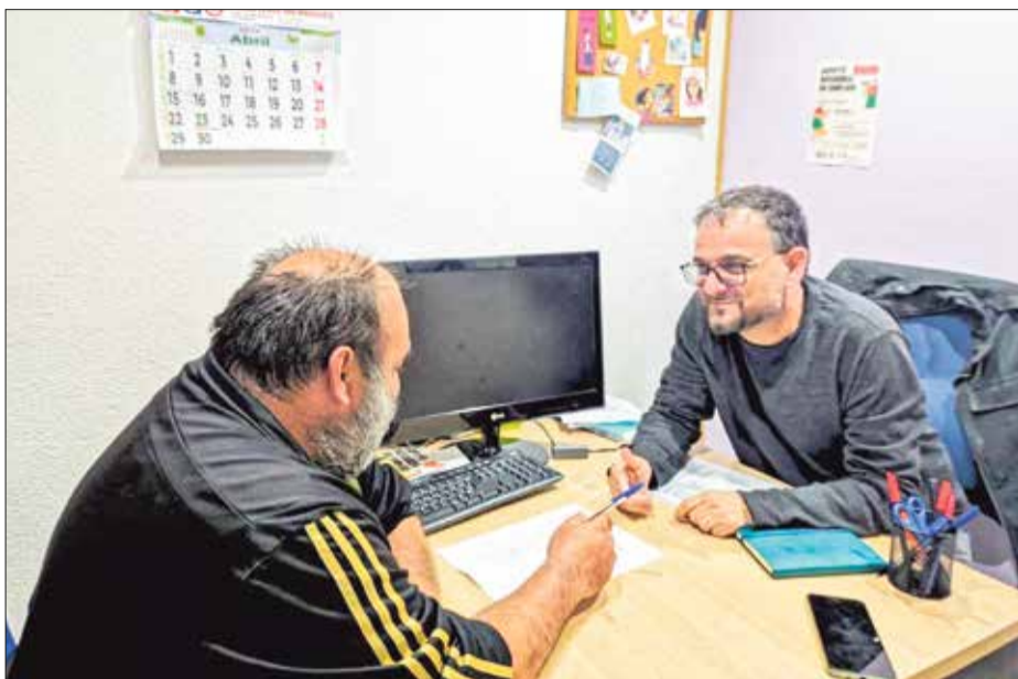
▲ Uno de los profesionales del Servicio de Empleo de la FRAVM atiende a un desempleado

"Como la inmóvil mirada del pájaro ante la ballesta, así la palabra y la sombra de esa palabra aguardan su permanencia más allá de la revelación de la muerte" ('La Poesía ha caído en desgracia', Juan Carlos Mestre).