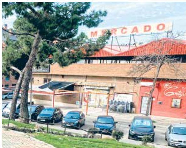
▲ La parte trasera del Mercado de Numancia vista desde la calle de Pico de la Maliciosa

comenzarán en unas semanas, durarán hasta el verano de 2025, y supondrán la inversión de 1,6 millones de euros. Fuentes municipales explican que esta actuación tiene como objetivo regenerar un espacio que constituye un centro neurálgico de socialización e interacción de los vecinos de la zona y que abarca las calles de Josefa Díaz, Castalia de Vallecas, Dolores Folgueras, Rogelio Folgueras, Pico de la Maliciosa y el parque ubicado junto a este último viario. Para ello, se renovarán y mejorarán los pavimentos, se actualizarán los itinerarios peatonales para garantizar la accesibilidad, se instalará un nuevo alumbrado de alta eficiencia energética y se plantarán 51 nuevos árboles.