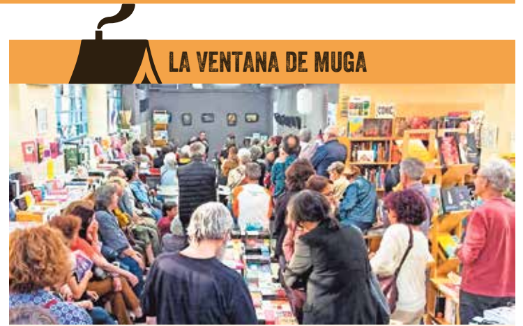
▲ Una de las actividades realizadas en Librería Muga

➤ Vamos a trabajar para consolidar Vallekas Negra, para que, ojalá, algún día sea una cita tan reconocida como la paella republicana o la San Silvestre. Es nuestro compromiso y vamos a lograrlo.