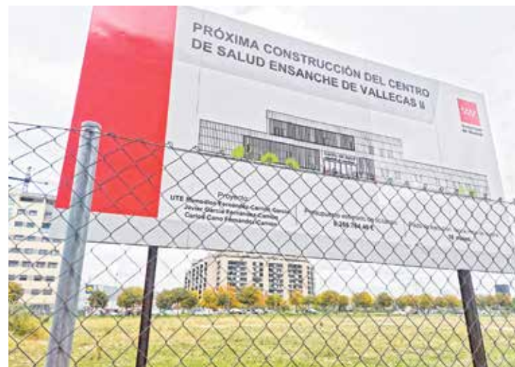
▲ El cartel que anuncia la construcción del segundo centro de salud del Ensanche