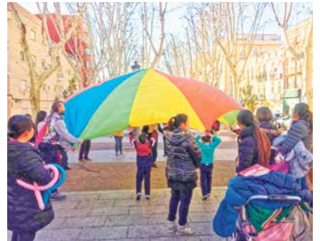
▲ Una de las actividades desarrolladas por el equipo de Educación de Calle

Hay que dotar de más personal en los centros donde se detecta que en los primeros cursos de la ESO existe un índice de fracaso escolar significativo