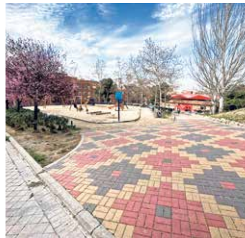
▲ El parque situado junto a Pico de la Maliciosa

La rehabilitación integral de la zona verde emplazada junto a la calle de Pico de la Maliciosa rematará esta operación urbanística