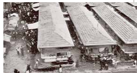
▲ La plaza de abastos, llamada Mercado de San Isidro, compuesta de 12 pabellones, con 212 puestos, acabó siendo más conocida como Plaza Vieja