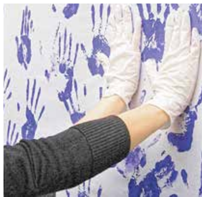
Uno de los murales pintados por el movimiento feminista vallecana

La cabecera de la manifestación que recorrió las calles de Puente de Vallecas el año pasado @8MVALLEKAS