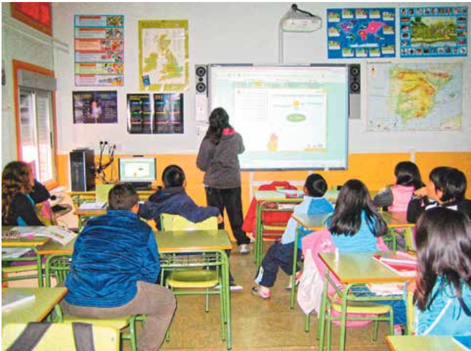
▲ Una de las clases del colegio público San Pablo, en Puente de Vallecas