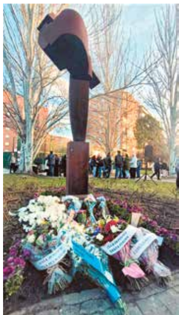
▲ El acto in memoriam que tuvo lugar el año pasado en Santa Eugenia

Los diferentes escenarios de la tragedia albergarán, un año más, el próximo lunes 11 de marzo actos “in-memoriam” con música y ofrendas florales, con la participación de la Asociación 11-M Afectados del Terrorismo. El primero de ellos, tendrá lugar a las 10 de la mañana en la estación de Atocha-Cercanías y los demás serán a las 13:30 horas en Retiro Sur, junto a la calle de Téllez, 30; a las 18 h. en Santa Eugenia, frente a la estación y a junto a la escultura ‘Ilusión Truncada’; y a las 19 h., en el Pozo, junto al monumento de la estación de tren.