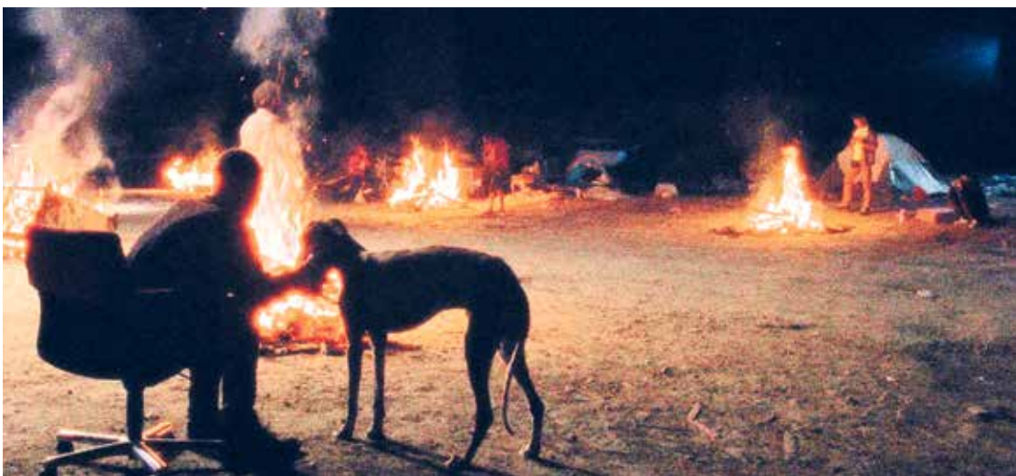
Una de las secuencias del cortometraje ganador del Premio Goya 2024

La cinta cuenta una ficción, pero todo lo que hay detrás de esa narración es absolutamente real. El director ha estado viviendo la realidad de la Cañada Real Galiana durante años, empapándose de ella para que la misma transpirase en cada uno de los fotogramas de su