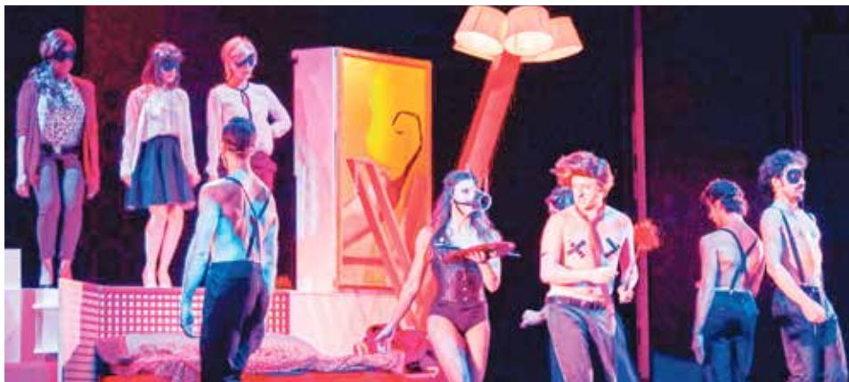
▲ Un momento de la función