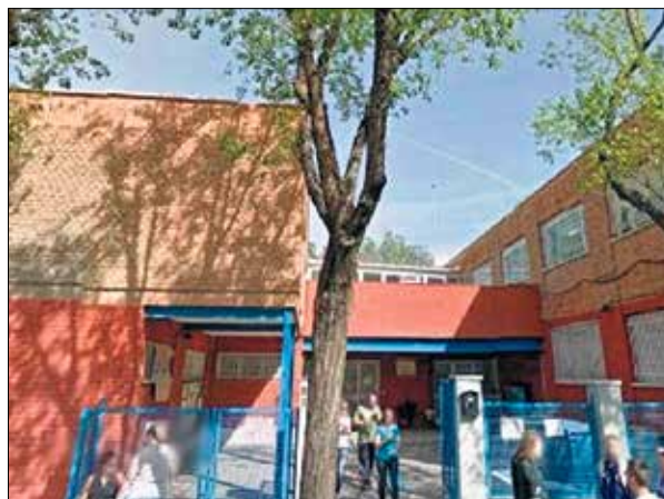
▲ El CEPA Entrevías, calle de la Serena, 394