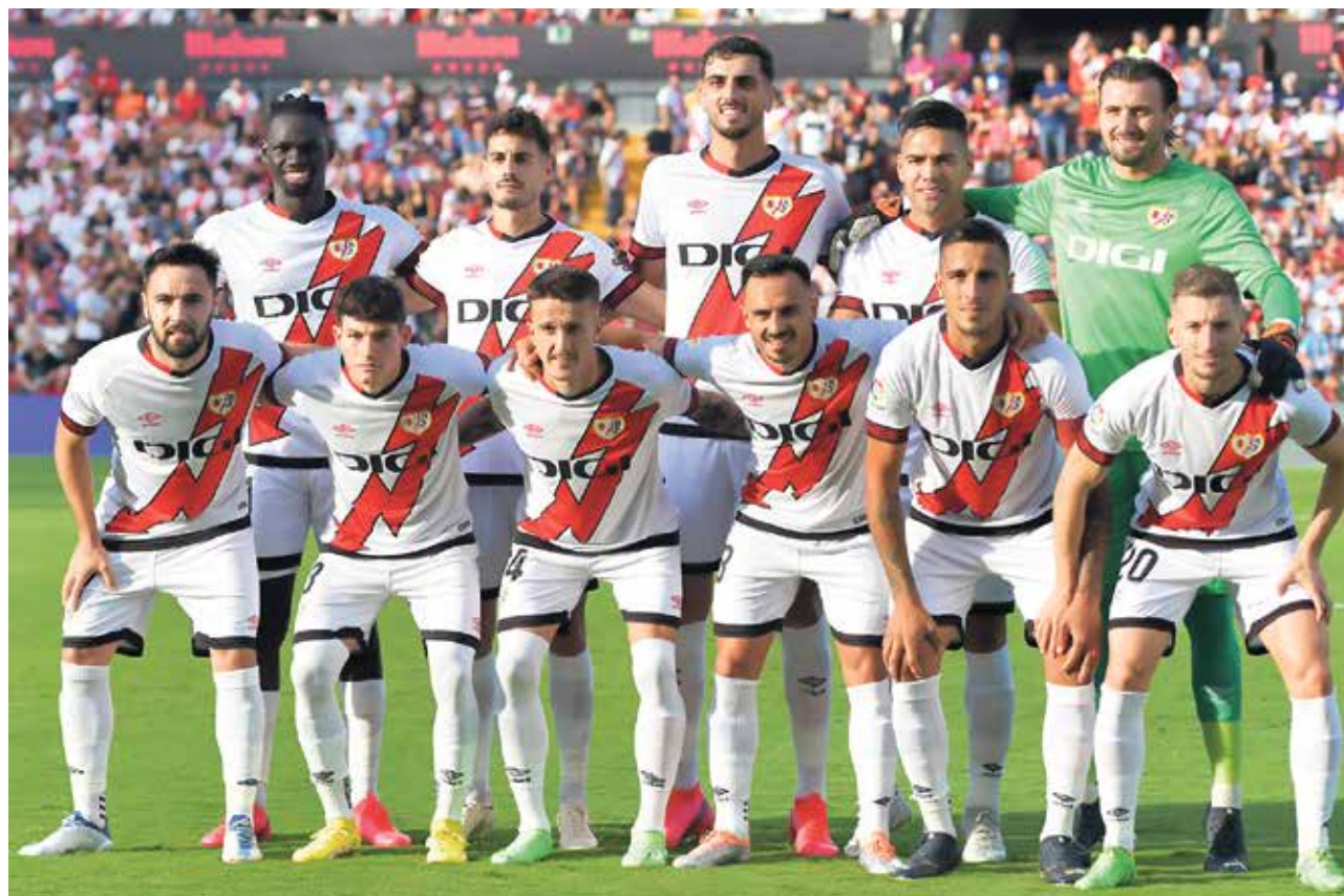
◀ El once inicial del Rayo en el primer partido en Vallecas RAYO VALLECANO

L a Peña Bukaneros organizará la segunda recogida de material escolar el sábado 10 de septiembre, una hora antes del inicio del encuentro frente al Valencia CF, en la puerta del fondo del Estadio de Vallecas. La anterior tuvo lugar el 27 de agosto antes del choque contra el RCD Mallorca. Los responsables de esta iniciativa aseguran que se necesitan mochilas, estuches, cuadernos de