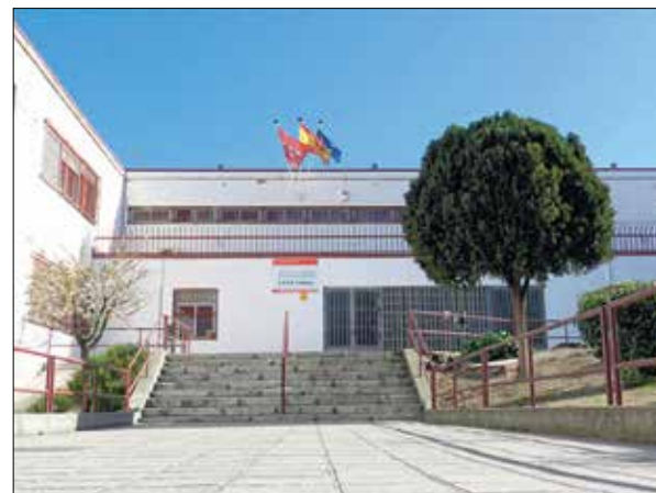
▲ El CEPA Vallecas, plaza de Antonio María Segovia, s/n