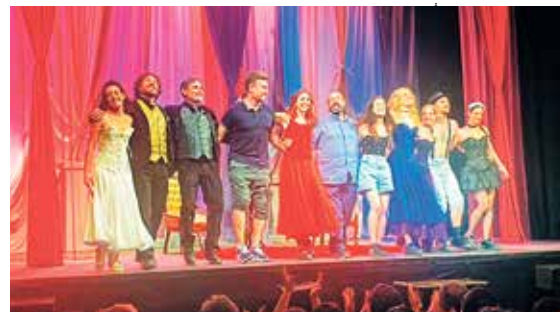
▲ El elenco saluda al final de la función

"N unca confíes en una mujer que dice su edad. Es incapaz de guardar un secreto". Así reza en una de las hilarantes citas de esta comedia de enredo clásica, ácida y escandalosa de Oscar Wilde: 'El abanico de lady Windermere'. Una familia puritana en el final de la época victoriana que hace una "pequeña fiesta", tan solo 100 personas, donde la hipocresía y el puritanismo unidos a una falsa moral, provoca situaciones