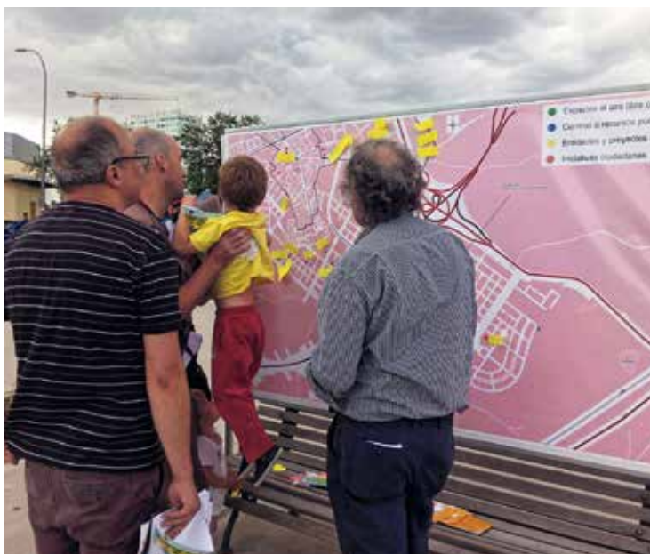
▲ La Feria de Salud Comunitaria, desarrollada entre 2015 y 2019

Durante la pandemia se elaboró un video sobre nuestras actividades, ante la imposibilidad de realizar