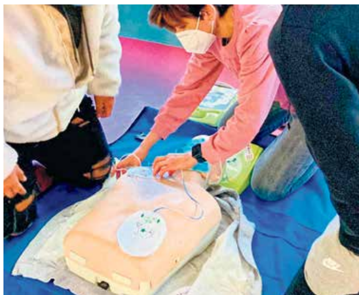
▲ Práctica de simulación de RCP

En total, entre las diferentes temáticas, llegamos a superar las 40 sesiones. Se consigue ponerlas en marcha gracias a la implicación de mucha gente que acumula horas y horas de trabajo, ya que hay que coordinar con el profesorado las fechas, la duración y la elección de las aulas. Necesitamos, además, cuadrar las agendas de los profesionales sanitarios que se ausentan del centro para impartirlas. A continuación, se prepara el material. Revisamos la bibliografía, y actualizamos y adaptamos los contenidos. Intentamos fomentar un clima participativo para que resulte más ameno.