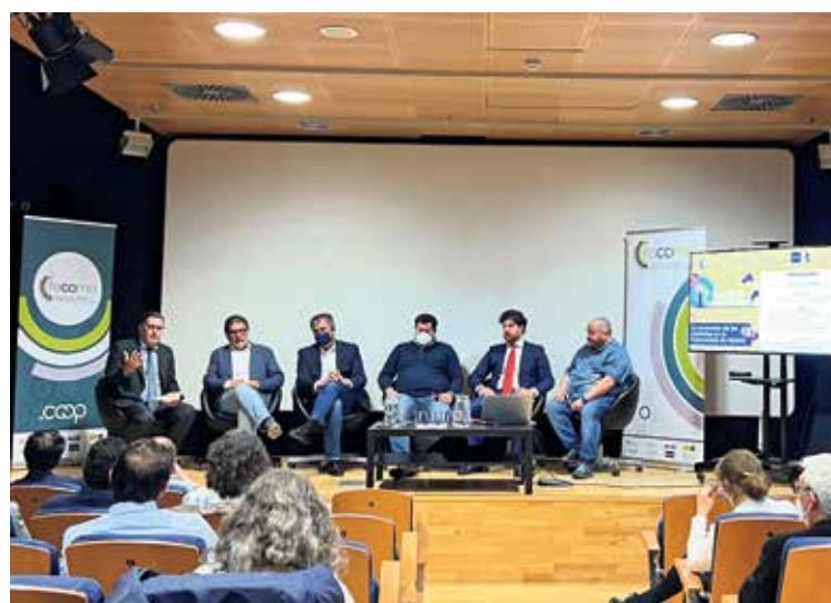
▲ Las entidades galardonadas con los premios ES_MAD de 2022, entre ellas La Garbancita Ecológica y la Escuela de Cooperativismo de Vallecas FECOMA