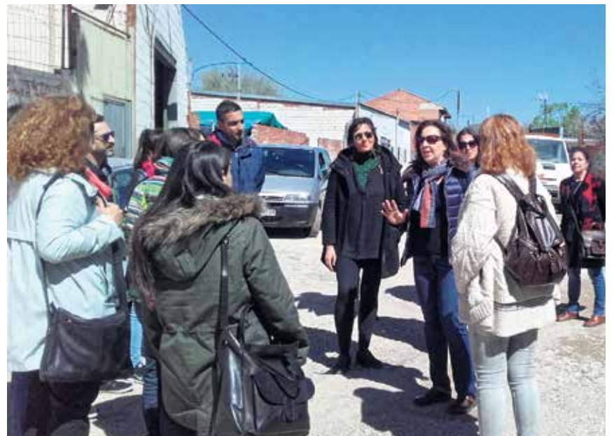
▲ La visita a Cañada Real realizada en 2016