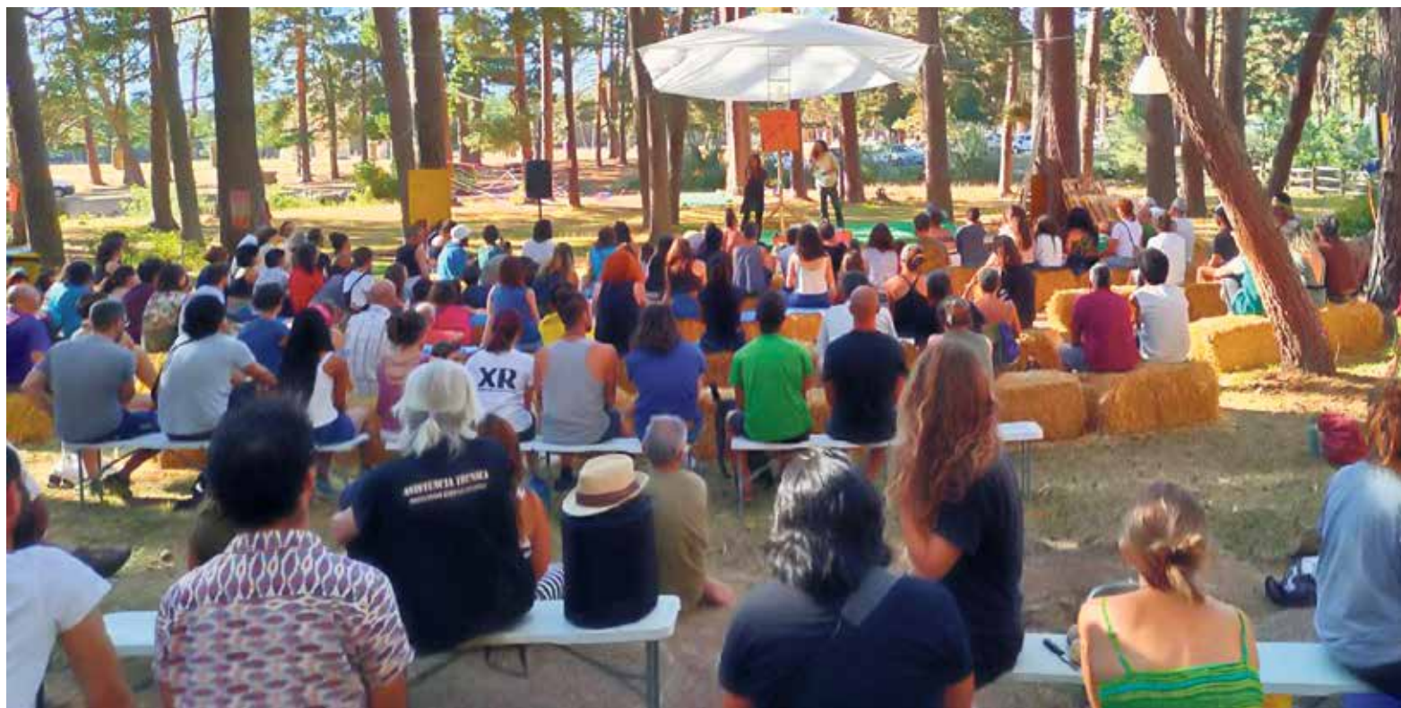
▲ Una de las asambleas