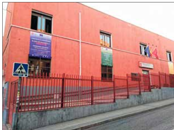
▲ El CEPA La Albufera, calle de Nuestra Señora del Perpetuo Socorro, 23