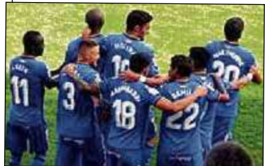
El Getafe perdió tiempo como hasta ahora no se había visto en Vallecas.

La Ciudad Deportiva del Rayo Vallecano ha sido el escenario para la celebración del Partido de los Valores, un encuentro que sirvió para transmitir a la sociedad los verdaderos valores asociados al deporte en general y al fútbol en particular con respeto, compromiso, trabajo, humildad, sacrificio y juego en equipo, buscando la plena integración a través del deporte. Los deportistas del colectivo DI demostraron con su esfuerzo que jugar al fútbol siempre es posible y que los valores deben prevalecer por encima de cualquier otro interés. El encuentro lo jugaron futbolistas de los equipos de la Fundación Rayo Vallecano y Fundación Getafe CF y el resultado fue el que estábamos esperando: ganaron todos.