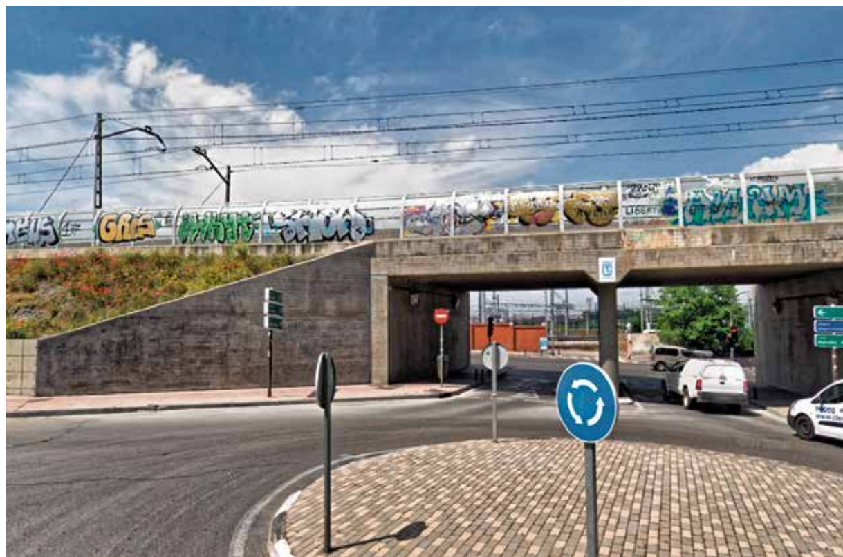
Lugar donde se propone que se cree la nueva estación: Intersección de Calle convenio con Avenida de Monte Igueldo.