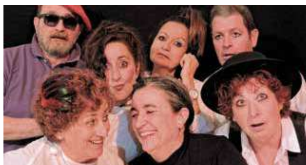
La Viña, grupo de teatro de Vallecas.

La programación puede consultarse en la página web de Vallecas Todo Cultura: www.vallecastodocultura.org y en www.enredandoenvallecas.com . ■