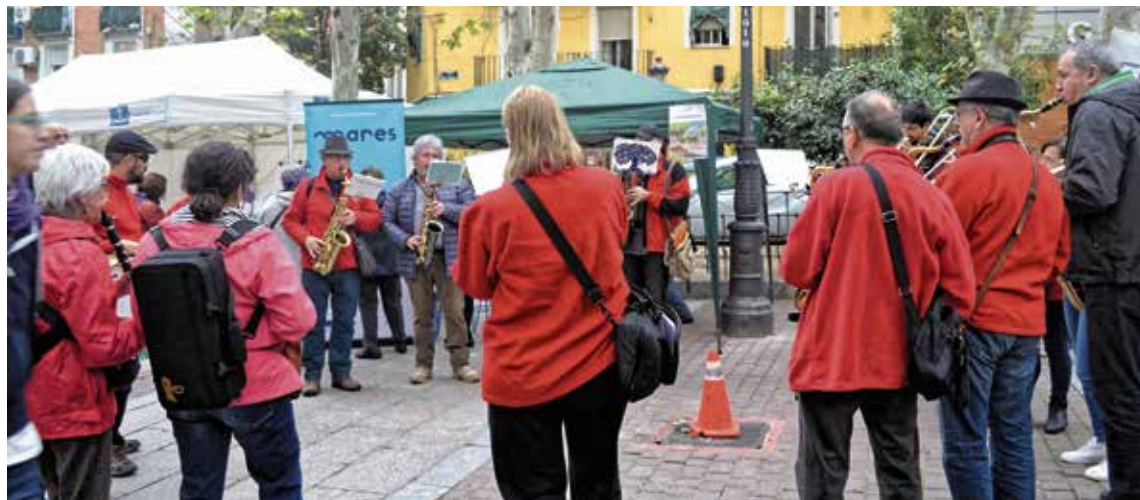
La Charanga C. P. Palomeras Bajas amenizando la jornada y los distintos puestos alrededor.