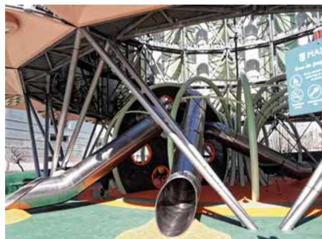
Parque de juego.