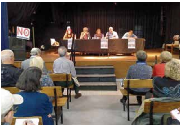
Presentación de la nueva plataforma.

Desde entonces a ella se han ido uniendo muchos colectivos; la Plataforma Vallekana de Pensionistas es uno más. El acto de presentación tuvo lugar en el Centro Cultural Al Alba, con una gran afluencia de público que