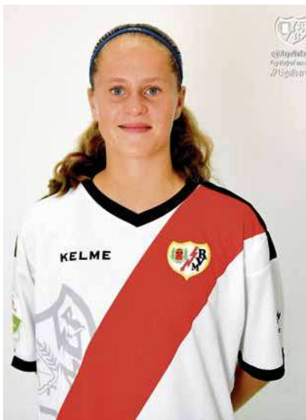
Participantes y asistentes jugando al ajedrez.

Antes de que el equipo se desplace a Uruguay el equipo entrenará en la Ciudad del Fútbol de las Rozas desde el miércoles 31 de octubre para ir preparando su paso por el Mundial. ■