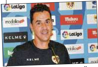
El puesto de Michel peligrará si no llegan pronto los buenos resultados.