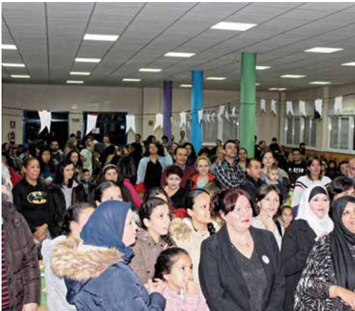
Cena intercultural del pasado año