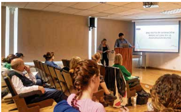
Asociación Barró en la USVK

Los mediadores y mediadoras de la Asociación Barró que realizan su trabajo en la zona del “Triángulo de Agua” han participado en una de las mesas de la Universidad Social de Vallecas llamada “Mesa Identidades