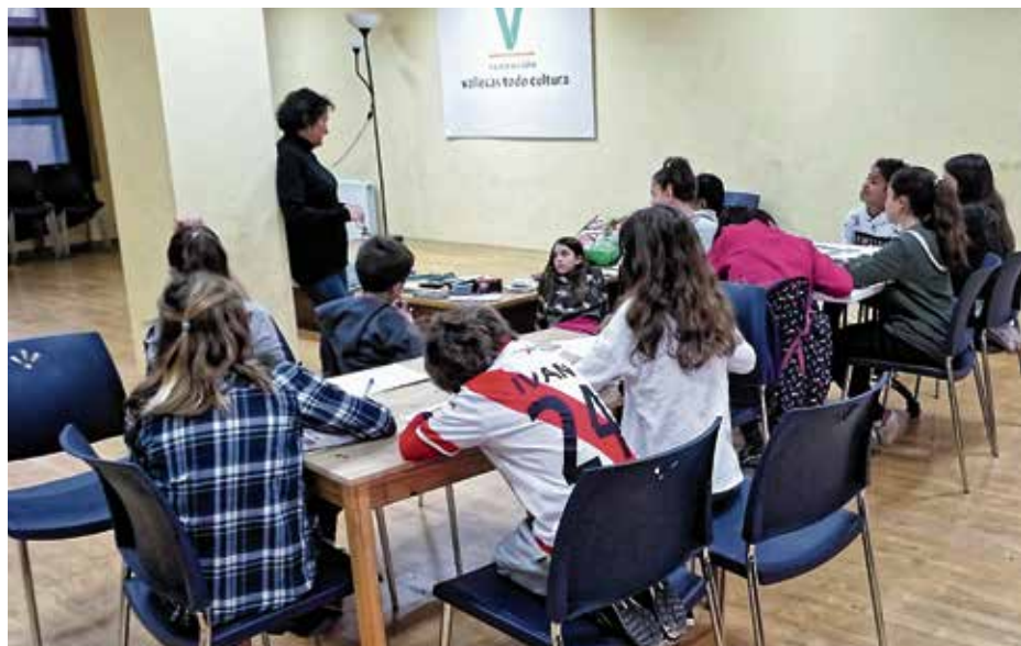
Taller de Lectura de Vallecas Todo Cultura