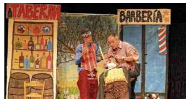
Grupo de teatro Los Mamarrachos.