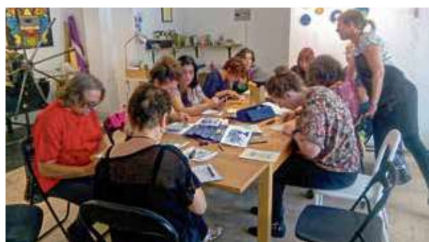
Participantes del taller de grabado trabajando.

Este taller se hace en colaboración con Bicillecas, consistente en un taller de reparación de bicis, además de una serie de actuaciones dirigidas a los jóvenes y vecinos y vecinas del barrio, dentro de su local, donde se im-