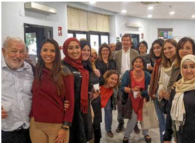
Participantes de la presentación

Se destaca la participación del Comisionado de la Comunidad de Madrid, del Ayuntamiento de Madrid, de la Universidad Autónoma de Madrid, de las entidades: Asociación Barró, Cruz Roja, Cáritas, Parroquia Santo Domingo de la Calzada, Fundación Secretariado Gitano, Equipo ICI, Fundación Voces, ACCEM, Alamedillas, Fundación La Caixa, Servicios Sociales Municipales de Villa de Vallecas y Vicálvaro, y cargos públicos y referentes políticos de los Distritos y Municipios que comprenden la Cañada.