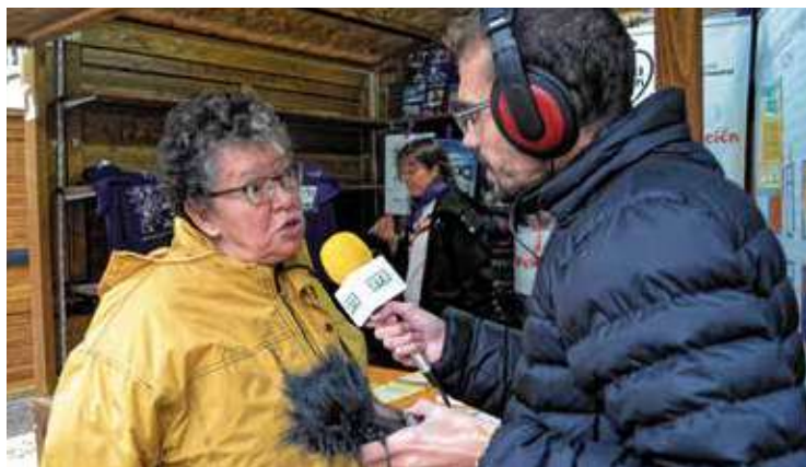
Radio Vallecas entrevistando a los participantes.

Un grupo de una de las mesas redondas daba por iniciada la ronda de intervenciones. Una de las chicas allí presentes explica cómo se encontró con sus tutores, las cuales la animaron a desarrollar sus capacidades creativas y a crear vínculos con otros jóvenes, a asistir a