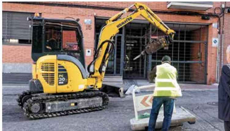
Comienzo de las obras de reordenación del tráfico en la calle Santa Julia

— Dentro de la calle Arroyo del Olivar se construirá una nueva acera en los números impares, para la definición de