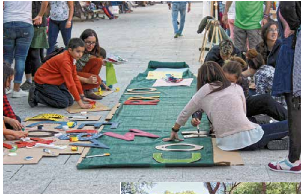
Participantes preparando el cartel 'En el barrio como en casa'

Además de la parte gastronómica, priorizamos el encuentro, la comunicación y el pasar un buen rato, con música y expresiones culturales diversas. Para ello, contamos con la motivación de las personas que quieren acercarse al micro, comunicar su experiencia, mostrar su faceta artística y disfrutar. También contaremos con actividades infantiles durante la primera hora. ■