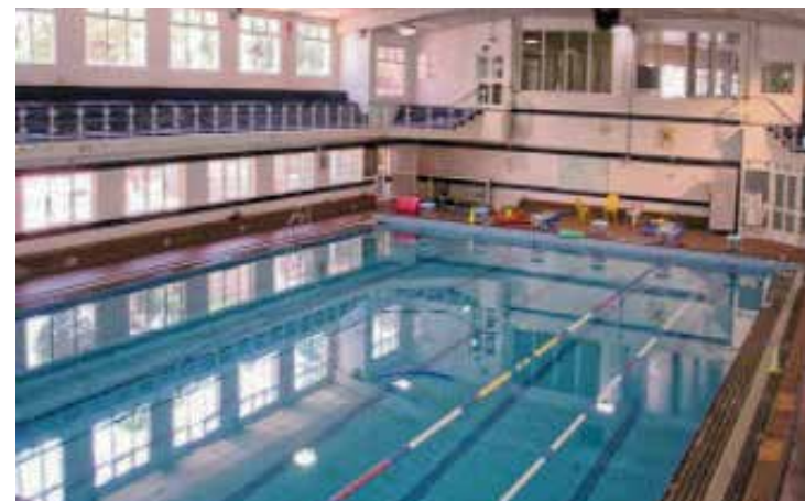
Centro deportivo municipal

— Desde la calle Martínez de la Riva el tráfico se dirigirá hacia Puerto Alto y su posterior salida por Fernando Primo de Rivera, hacia la avenida de la Albufera. ■