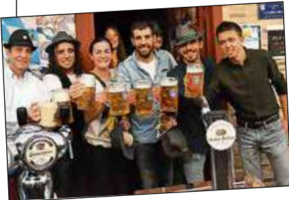
Los invitados especiales de la OktoberFest Vallekana tras abrir los barriles llegados desde Alemania.