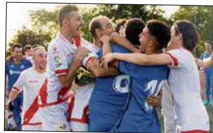
La Liga Genuine acerca el fútbol a deportistas del colectivo DI.