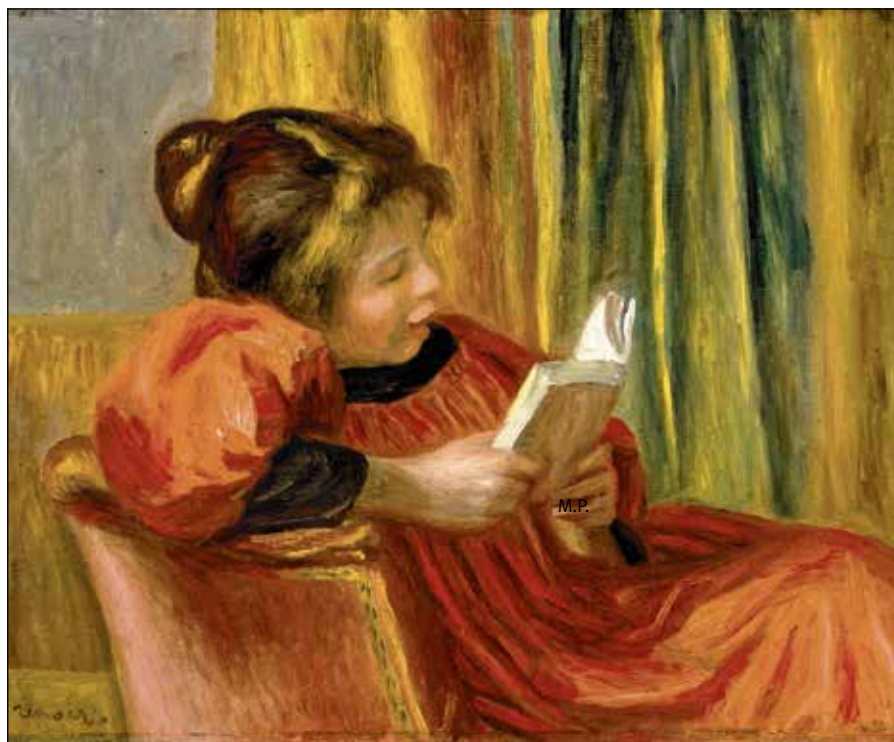
"La lecture", de Pierre-Auguste Renoir.

Hablé con los profesores de Lengua y Literatura, y planificamos unos encuentros en sus aulas en los que lo principal era que los estudiantes se expresasen, que sobre un tema previamente elegido por los profesores, sus alumnos escribiesen microrrelatos (o poemas) de cincuenta palabras máximo. He escuchado cómo estos escolares pasaban las páginas escritas por su imaginación, he aprendido con las historias que nos han contado. De papel, están hechos de papel. Los cimientos de Vallecas no están hechos de piedra o de hormigón o de cualquier otro material. De papel, están hechos de papel, del papel de estos alumnos y de sus profesores que se empeñan en creer en un futuro en el que la literatura forme parte de su vida. Y os hablo de literatura, pero están abiertos a