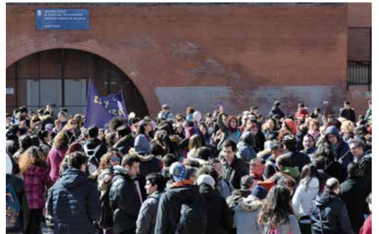
Personas de todo el barrio unidas en una misma lucha.

Dado el éxito que tuvo el acto, se ha valorado desde las entidades participantes que se convierta en una cita anual comunitaria para que todo el vecindario pueda continuar participando y dando visibilidad a las mujeres del barrio. ■