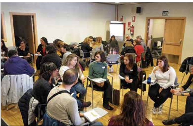
Una iniciativa de los Servicios Sociales de Puente de Vallecas.

Desde el Equipo ICI de Cañada Real queremos agradecer la implicación y la participación de todas las personas que han hecho posible este IV Encuentro Comunitario: vecinas y vecinos, compañeros y compañeras de otras entidades sociales y personal de las Administraciones públicas. Ha sido un acto lleno de emoción, ilusión y motivación para seguir avanzando en el proceso comunitario de Cañada Real. ■