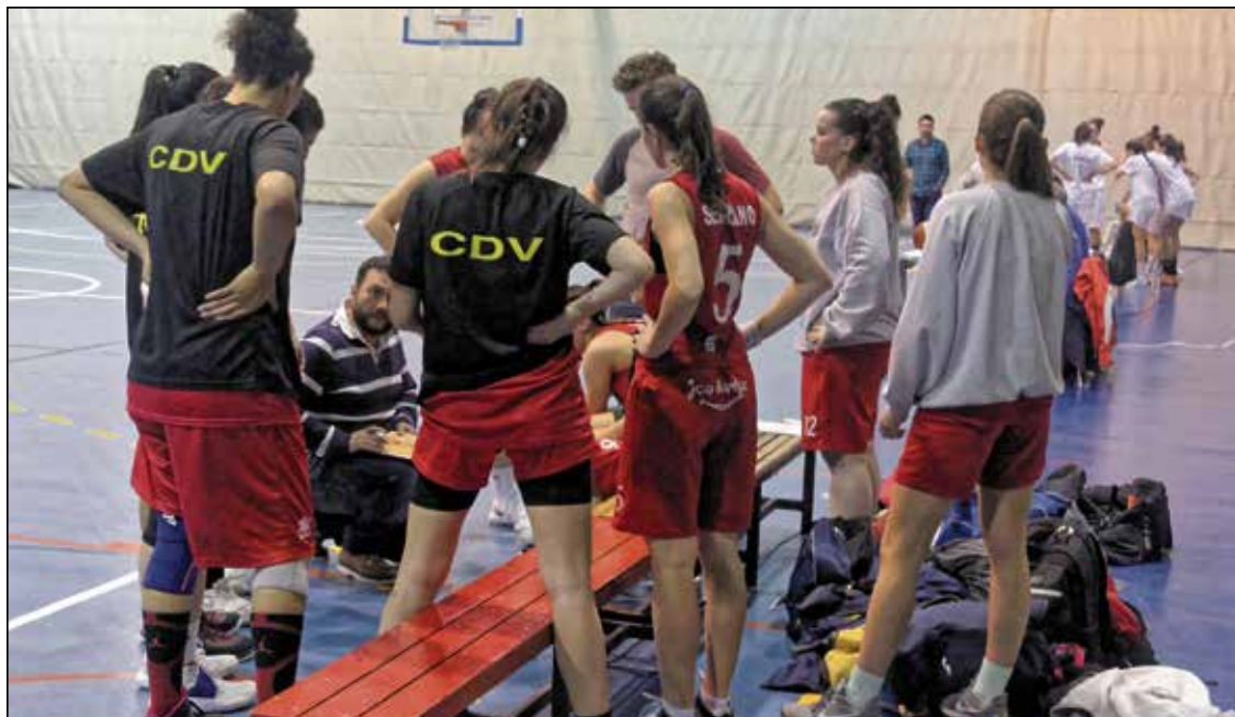
El entrenador da instrucciones a las jugadoras en un tiempo muerto.

Un equipo sénior femenino de baloncesto del Centro Deportivo Vallecas lucha por mantenerse en una categoría a la que le ha costado mucho tiempo y esfuerzo llegar. Algún patrocinador y un mayor apoyo municipal ayudarían decisivamente a superar las lógicas dificultades de un club de barrio que ha ‘tomado altura’ por sus propios y modestos medios