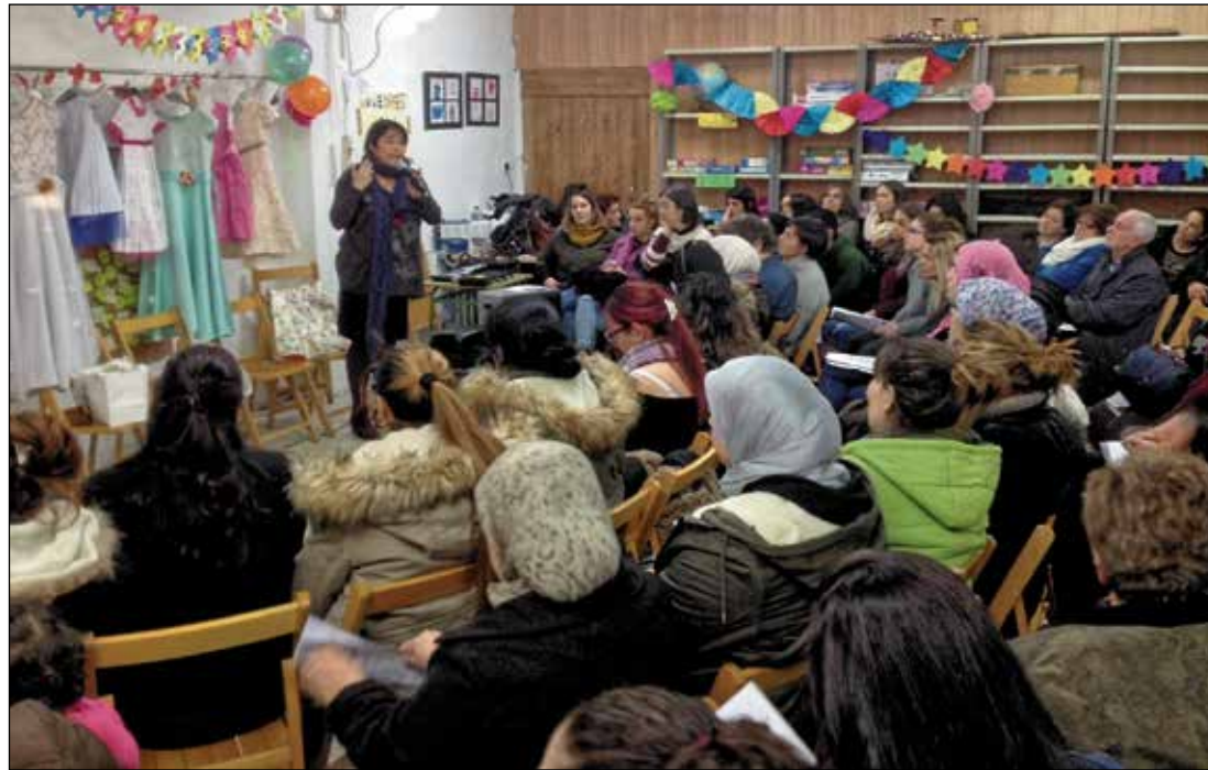
Tuvo lugar el 21 de marzo en el local de Híper Cañada del sector 3.

— Comisiones de Participación Infantil y Adolescente del área de Equidad, Derechos Sociales y Empleo del ayuntamiento de Madrid en los