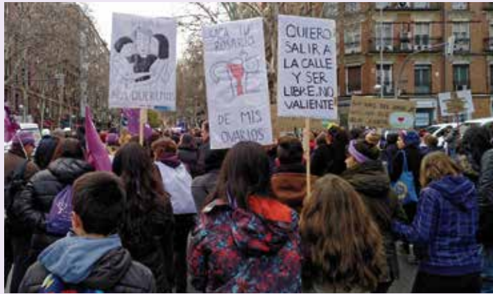
Vallecas se movilizó a tope por esta causa, tanto el 8M como durante todo el mes que lo precedió.