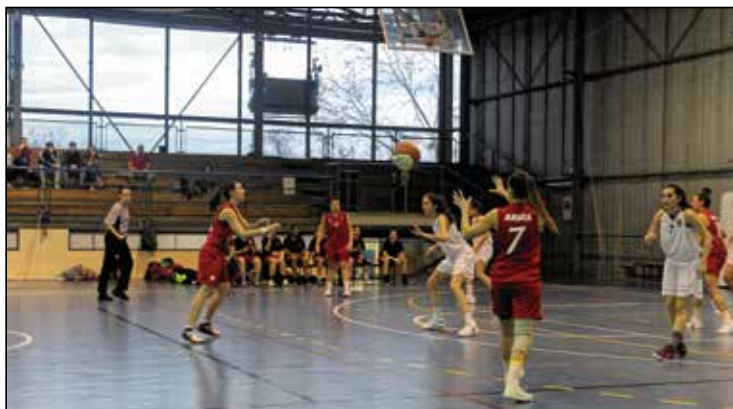
Iniciando una jugada.

Pero las dificultades son grandes: además de lo complicado de realizar algunos fichajes para conseguir que el equipo sea más competitivo (siempre te-