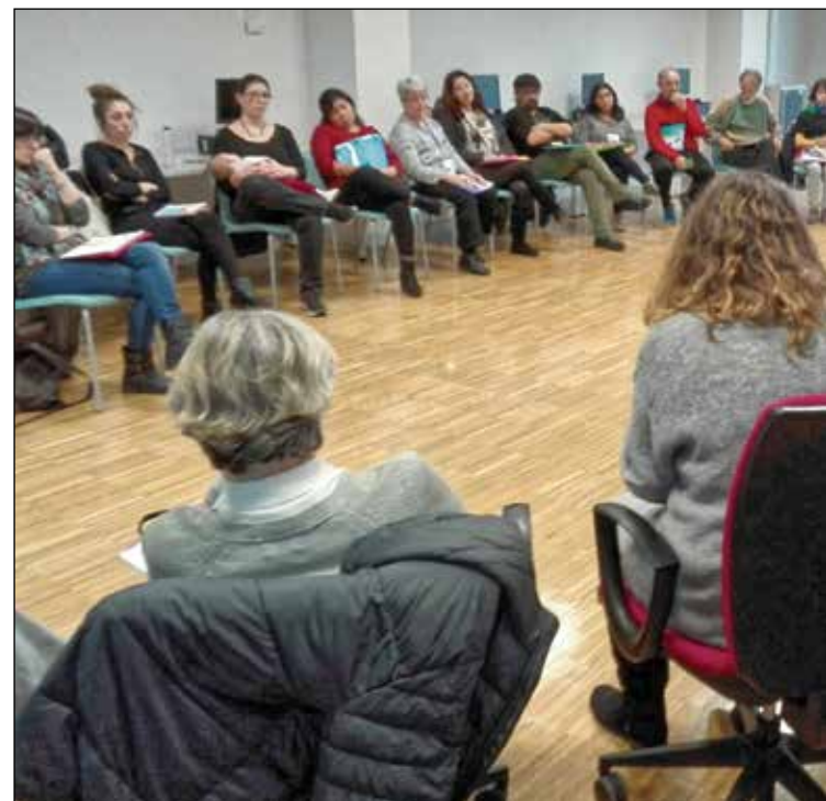
El evento fue organizado por la Mesa de Educación del Foro Local de Puente de Vallecas.

— Desde Rivas Vaciamadrid nos trajeron varias “Actuacio-