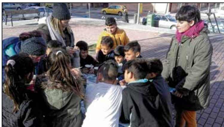
La presentación fue una actividad lúdica orientada a la infancia y la juventud.

El viernes 16 de marzo se llevó a cabo una actividad lúdica orientada a la infancia y juventud de Entrevías que sirvió de presentación de Activando Entrevías, un grupo de trabajo que tiene como objetivo la mejora de la convivencia en el espacio público y el fomento de la participación a través de la realización de actividades comunitarias. El grupo lo integran hasta el momento el Servicio de Dinamización Vecinal de Entrevías, equipo de Educación de Calle, Servicio de Convivencia Intercultural en Barrios, Ciudad Joven, Servicio de Dinamización de Participación Infantil y Adolescente y Servicio de Convivencia Vecinal e Intervención y Acompañamiento Socioresidencial en Puente de Vallecas.