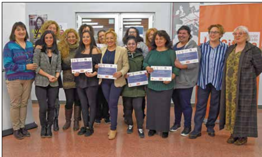
El grupo que ha participado en el curso, en el acto de clausura del mismo.

Lapágina web Gitanas avanzando (www.gitanasavanzando.com) es el resultado tangible del curso que 13 mujeres gitanas han finalizado con éxito en el marco del programa EDYTA de educación digital para mujeres en situación de vulnerabilidad. Impulsado por Fundación Orange y Fundación Secretariado Gitano, y llevado a cabo con la colaboración de la asociación Womenteck, en el transcurso del curso formativo (desde junio de 2017).