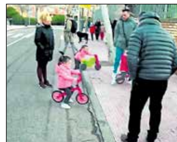
La experiencia ha sido muy bonita y completamente 'diferente'.

¿Y en qué consiste la diferencia? Simplemente con hacer un pequeño cambio en los hábitos de la movilidad en coche se produce una enorme, una gigantesca mejora en el entorno que acompaña a los niños en su camino hacia la escuela. Y es un cambio que está al alcance de todos los colegios y consiste en ordenar un poco el caos de