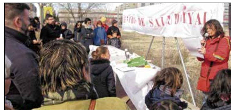
A.V. PAU DEL ENSANCHO DE VALLECAS