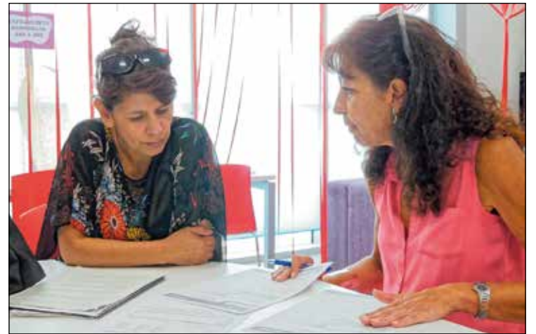
El programa no tiene coste económico alguno para las participantes.

“Si nosotras paramos, se para el mundo”; el objetivo de la huelga es 'pararlo todo'