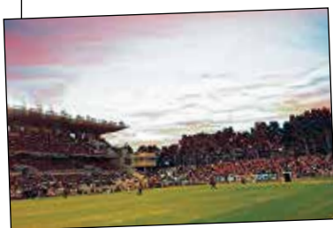
Las obras de mejora del Estadio de Vallecas comenzarán a finales del próximo mes de marzo.