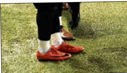
La banda donde calientan los suplentes de ambos equipos también se encuentra en mal estado.