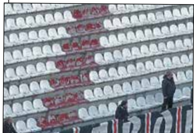
La renovación de los asientos irá acompañada de la ampliación del espacio destinado a las escaleras.

La Comunidad de Madrid ha publicado en su Boletín Oficial la licitación para la adjudicación de las obras de remodelación del Estadio de Vallecas, que cuentan con un presupuesto de 1,43 millones de euros más IVA y un plazo de ejecución de cuatro meses. El objetivo de las obras que se iniciarán en marzo es que la instalación pueda cumplir con la obligada Inspección Técnica de Edificios (ITE), que le resulta desfavorable desde el año 2012. Así, se procederá a tratar las humedades detectadas en los bajos del estadio, sobre todo en las gradas inferiores; eliminación de elementos oxidados que aparecen en vallas y cubiertas; mejora de la accesibilidad a las gradas y reforma de las fachadas exteriores, entre otras actuaciones.