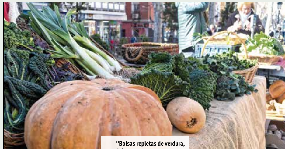
"Bolsas repletas de verdura, miel, cerveza artesana y otros productos. Pequeños puestos con un denominador común: I Muestra Agroalimentaria de Vallecas". A.O.

Los productores, unidos en grupos como la Asociación Unida de Productores Agroecológicos (AUPA), tienen la posibilidad