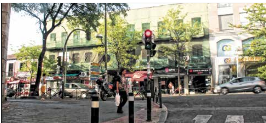
A.V. PUENTE DE VALLECAS