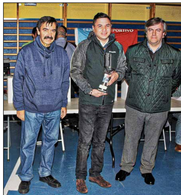
El campeón, con los presidentes de la Fed. Madrileña y del CDV.