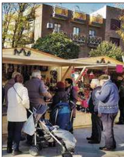
JMD VILLA DE VALLECAS

¿Por qué la gente comete tantos errores políticos al votar, con entusiasmo efímero, por un partido o un candidato y luego se arrepienten de su voto? La respuesta debe de ser porque se sienten engañados, seguramente por ignorantes: todo lo que está sucediendo en la actualidad, especialmente en Cataluña, es la consecuencia de no haber leído y aprendido lo acontecido hace muchos siglos, cuando se impuso la monarquía como Estado soberano,