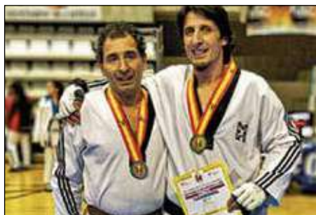
El Club Taekwondo Kyoto se trajo de Castellón un buen puñado de medallas. C.T.K.