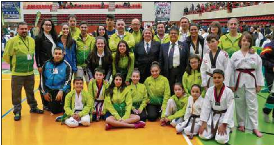
La participación del club en Tres Cantos fue muy satisfactoria (izda). A la dcha., el oro en Trío 2 del Cto. de España por clubs.