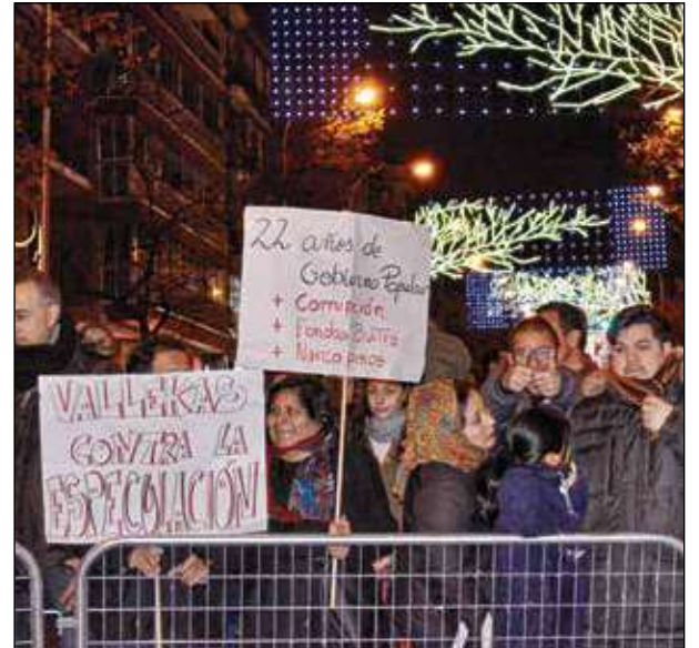
La protesta resultó bien visible.