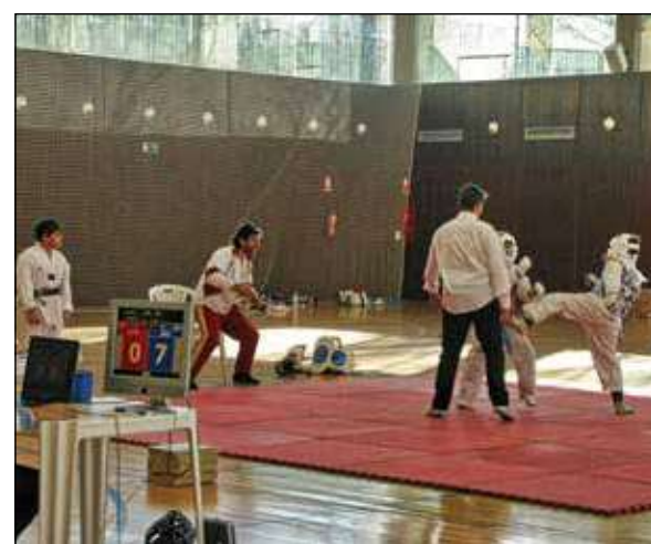
En pleno combate.