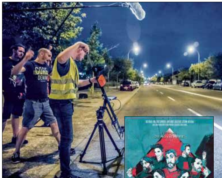
Un momento del rodaje.