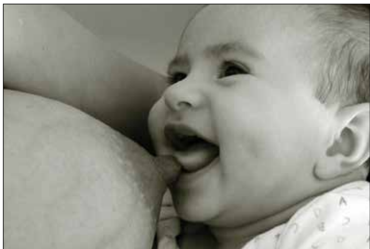
La foto ganadora, de Adriana Giménez Cabrera.