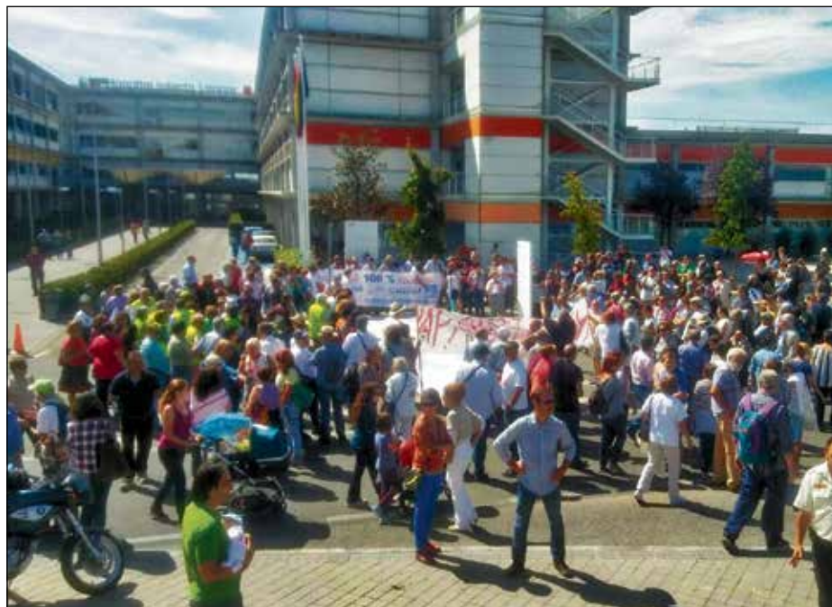
Los vecinos abrazaron a su hospital el 1 de septiembre. En Vallecas, la sanidad pública se defiende.

De hecho, las listas de espera siguen siendo muy largas, y en algunas especialidades y