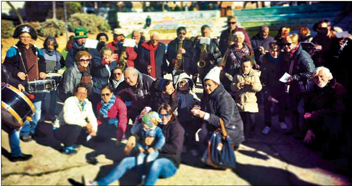
Vallecas no olvida a sus mayores.