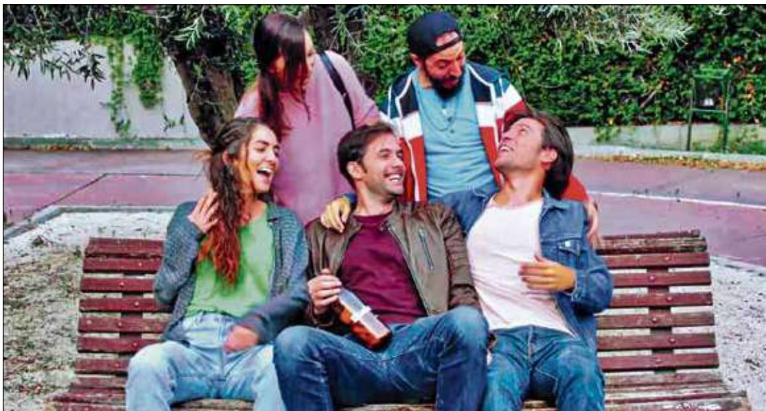
Los cinco protagonistas de la serie..