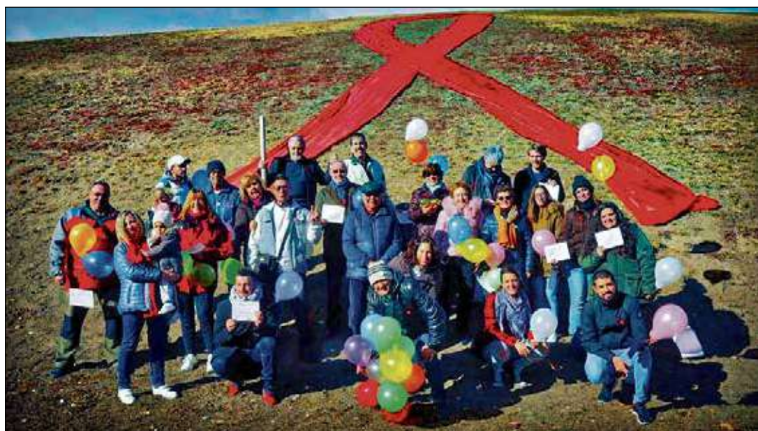
Una de las actividades consistió en la colocación de un lazo rojo de más de 25 m en el Parque del Cerro del Tío Pío.