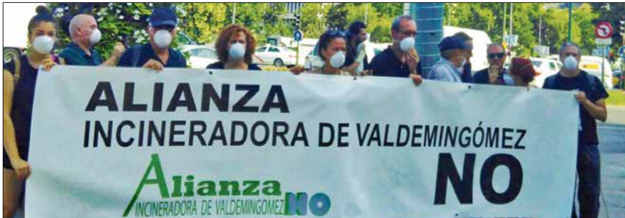
La Alianza Incineradora de Valdemingómez No pasa a la ofensiva.