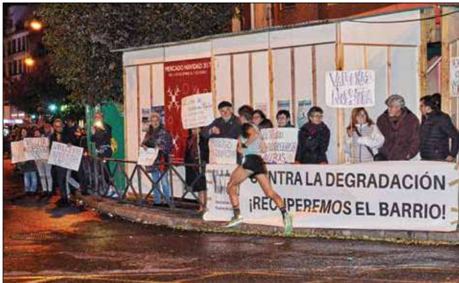
La acción en la San Silvestre ha sido el primer hito de una lucha que se prevé larga.

Después de la manifestación del pasado 15 de noviembre, los vecinos y colectivos sociales del distrito de Puente de Vallecas han continuado aunando esfuerzos con el objetivo de cuidarlo, defenderlo y recuperarlo para sus habitantes frente a la creciente degradación que vive la zona. En esta dinámica, volvían a reunirse en asamblea, esta vez el 19 de diciembre en el Centro Cultural Lope de Vega, para acordar los próximos movimientos. El primero de ellos podíamos verlo casi al cierre de esta edición, y llamó bastante la atención: aprovechando la celebración de una carrera tan emblemática como la San Sil-