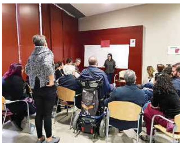
Planificando el 2018.

El pasado sábado 2 de diciembre se celebró la última convocatoria anual del Foro Local de Villa de Vallecas, un plenario en el que las mesas realizaron su planificación de cara a 2018. Tras evaluar las acciones que se han desarrollado a lo largo de este año, se establecieron diferentes grupos de trabajo en los que, en torno a un plan de ac-