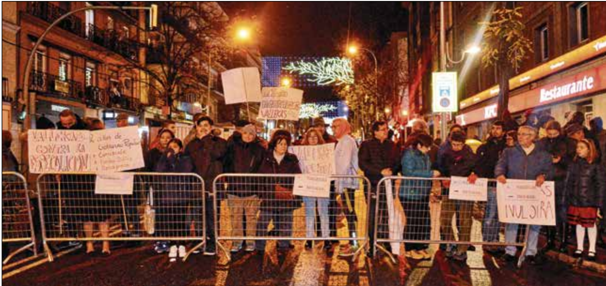
Vallecanos y vallecanas llenaron el recorrido de la carrera de mensajes contra la degradación del barrio.