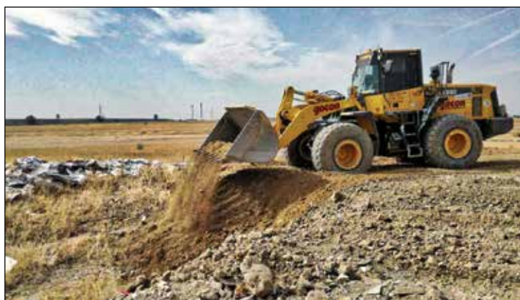
La recuperación ha sido posible gracias al acuerdo Ayuntamiento-AMAEXCO.

El ayuntamiento de Madrid está regenerando una de las zonas más degradadas de la Cañada Real, localizada dentro del Sector 6. La recuperación de estos terrenos ha sido posible gracias al acuerdo que el Ayuntamiento ha firmado con la Asociación de Empresarios de Excavadoras y Transportes de la Comunidad de Madrid (AMAEXCO), por medio del cual se están realizando tareas de limpieza en una superficie cercana a las seis hectáreas. Tras la firma de este convenio, dicha actuación no supone ningún coste económico para la corporación municipal.