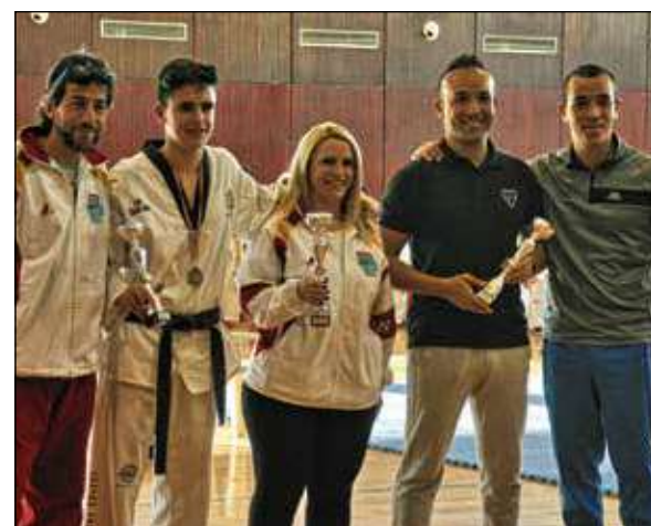
Los maestros posan para la cámara.