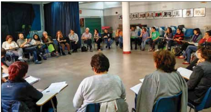
En la asamblea del 23 de octubre se decidió extender el conflicto.