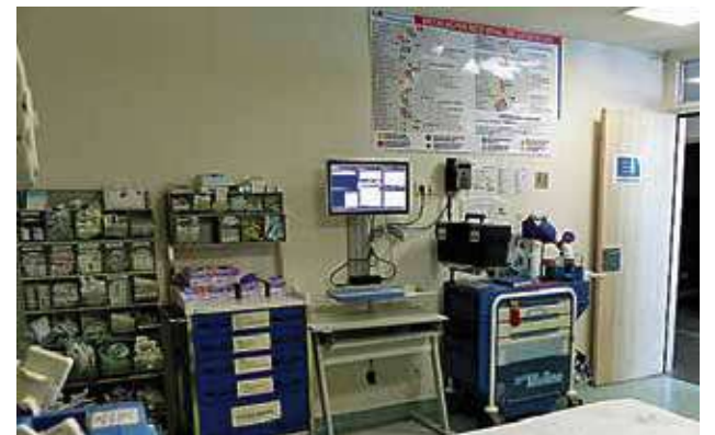
Box Vital del servicio de Urgencias del hospital.