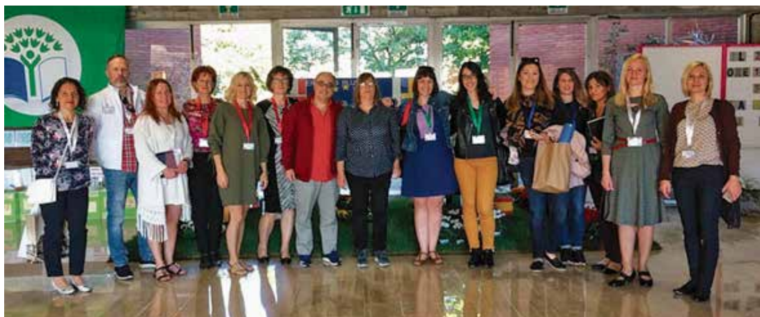
CEIP FRANCISCO FATOU

18:00. Cuentos en verso para niños perversos . Grupo de Teatro Mamarachos y Paparruchas. C.C. Francisco Fatou.