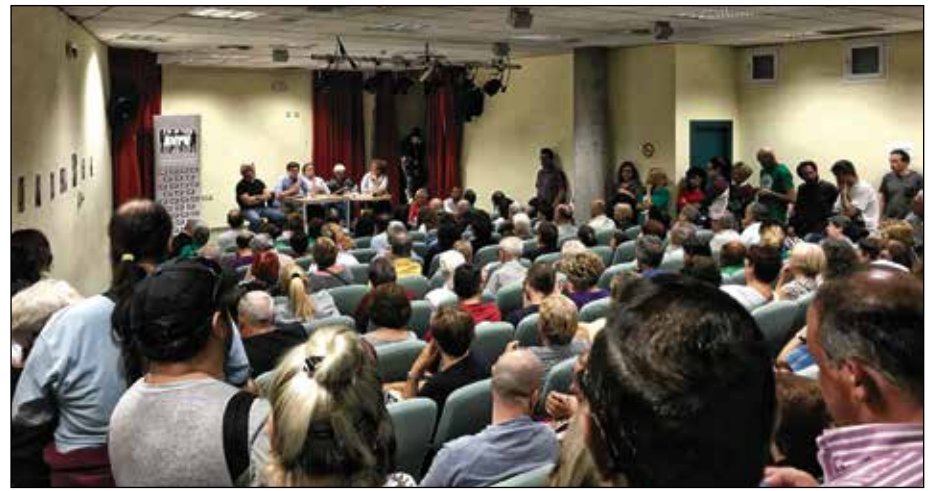
La convocatoria de la manifestación se decidió en la asamblea del 26 de octubre

Múltiples viviendas y locales de estos barrios están en manos de la especulación inmobiliaria de bancos y fondos de inversión, consintiendo ocupaciones mafiosas y la proliferación de "narcopisos" y prostíbulos, con el resultado de un aumento de la degradación de las calles. "¿Qué interés tienen estos bancos y fondos buitre en que la zona se deteriore con el abandono de sus bloques de pisos?", se pregunta la vecindad. Su responsabilidad en este proceso de deterioro es enorme. Por otro lado, la asociación vecinal lamenta que el compromiso del equipo de gobierno de la Junta Municipal en la regeneración del barrio, que hoy se en-