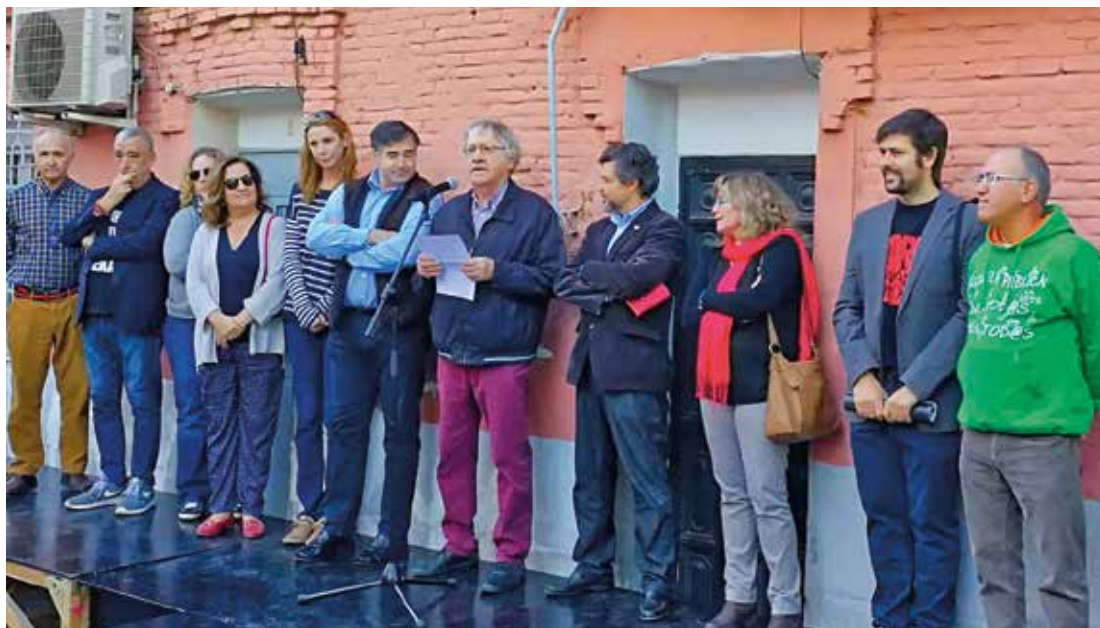
El hispanista Ian Gibson lee la carta abierta a la presidenta de la CAM en el acto celebrado el 28 de octubre.

El proceso arrancó el 5 de diciembre de 2016, y en él se involucraron todas las instancias municipales competentes, que en hasta cinco ocasiones se han reunido en los últimos meses con la plataforma civil #SalvaPeironcely10, así como con diversas asociaciones de defensa del patrimonio y la memoria histórica. Como resultado de esta cooperación se adaptaron dos acuerdos, en primer lugar en el pleno del distrito de Puente de Vallecas el 5 de julio de 2017, y el día 20 de ese mis-