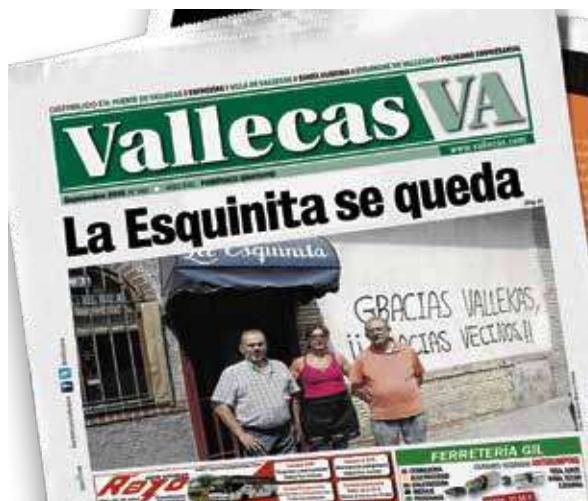
Final feliz para la historia que publicábamos hace un año.