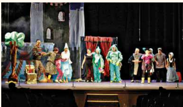
La organización espera superar los 1.200 espectadores de la anterior edición.