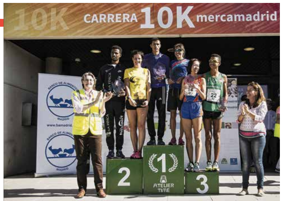
Podios masculino y femenino de la carrera.