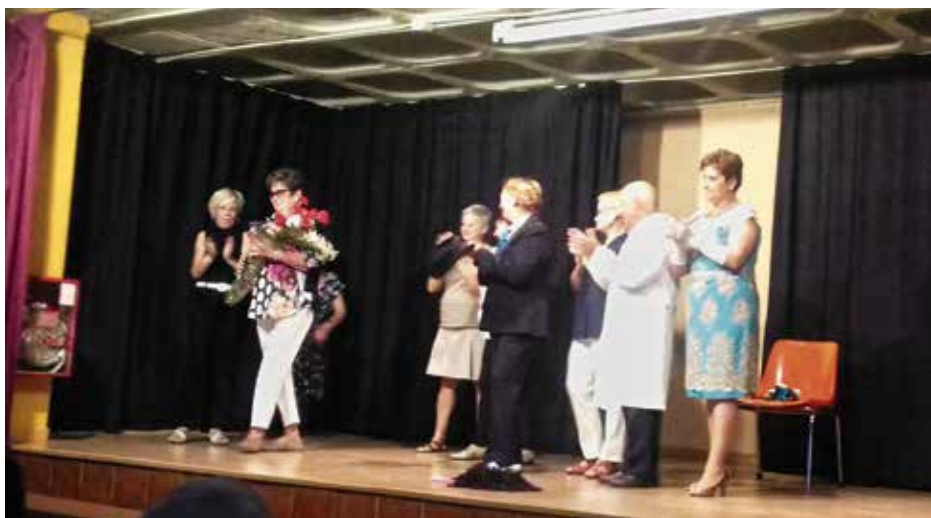
El acto tuvo lugar en los bajos de la parroquia de calle Villalobos.