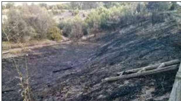
Restos del incendio del 6 de agosto en el Parque de El Soto.

El pasado 15 de febrero, las tres asociaciones de Entrevías-Pozo (La Paz, El Pozo y La Viña) firmaron un acuerdo con la junta municipal de Puente de Vallecas para el desarrollo y regeneración del barrio, que incluye medidas en urbanismo, medio ambiente, limpieza, cultura, seguridad, convivencia, políticas sociales y deporte, entre otras. Las razones para la firma de acuerdos como éste son evi-