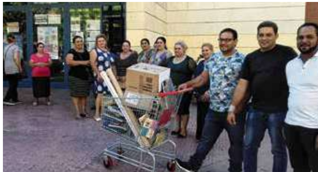
La noticia tuvo que ser comunicada a los alumnos en la calle.

Soy la coordinadora de la Escuela de Adultos de la Asociación de Vecinos de Madrid Sur, desde donde realizamos el programa de Alfabetización que impartimos en las aulas del centro cultural desde 1999. Me ha sorprendido la nota que hemos recibido el 5 de julio, donde el C.C. nos comunica la denegación de la cesión para la realización de los talleres de Alfabetización; comentario nun-