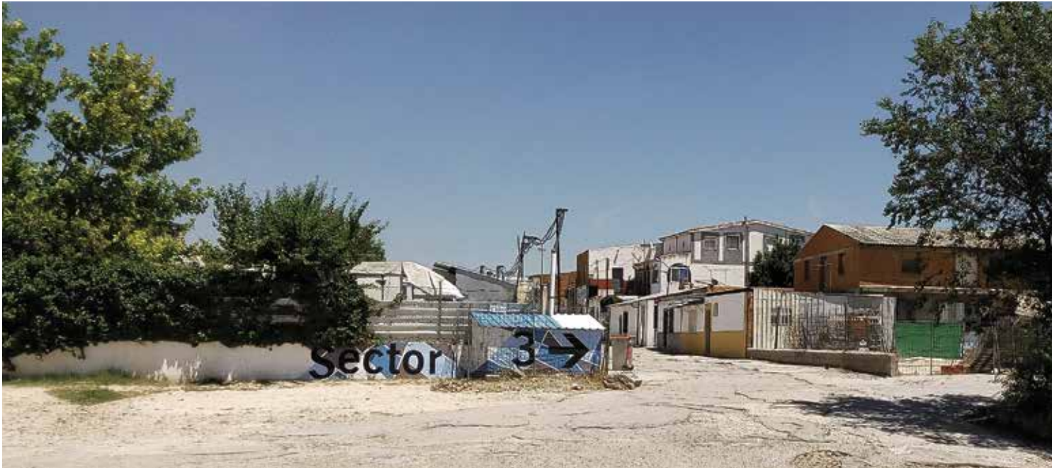
Arquitectura Sin Fronteras, junto a los vecinos y con la colaboración y financiación de la junta de Vicálvaro, ha señalado los cruces de los sectores 3 y 4.