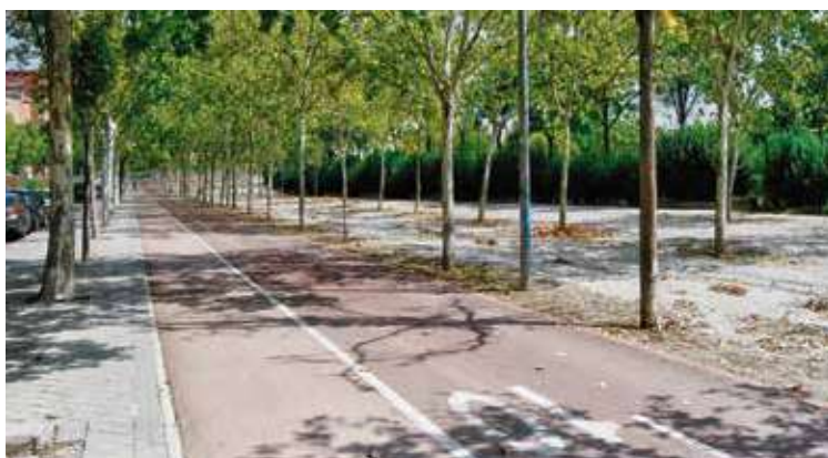
Este es el carril bici que los vecinos consideran "de alto riesgo" para los peatones.