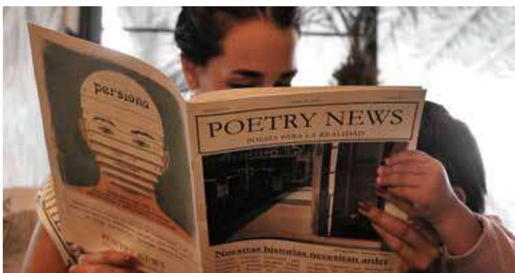
Leyendo 'Poetry News'.

El plazo de recepción de propuestas para la 3ª edición de Poetry News está abierto hasta el próximo 15 de septiembre. Puedes obtener más información en: inventos@lemotbulle.com www.revistapoetrynews.com