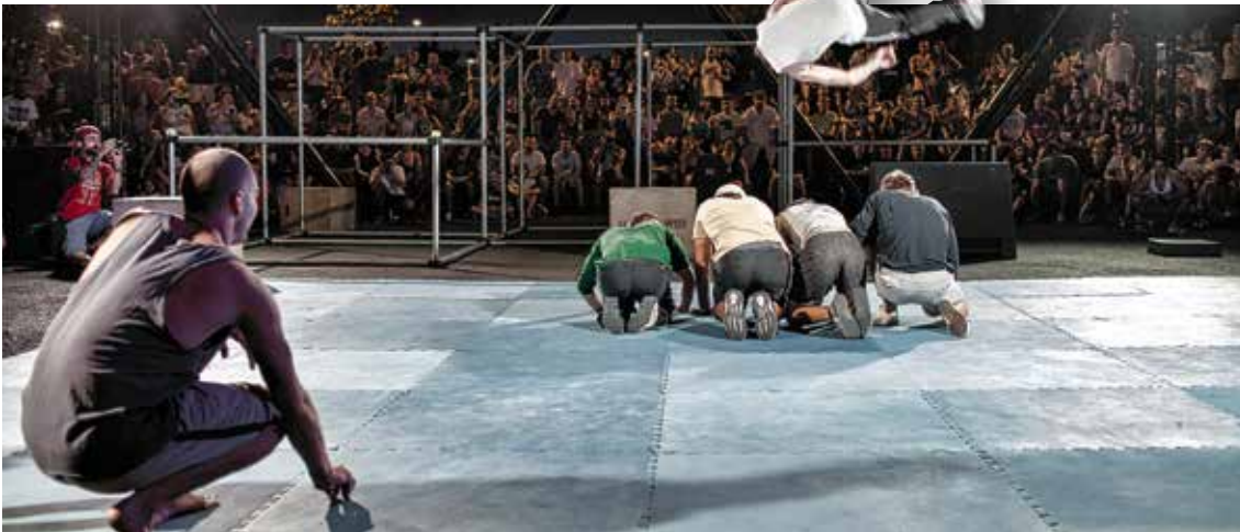
Un momento del espectáculo.