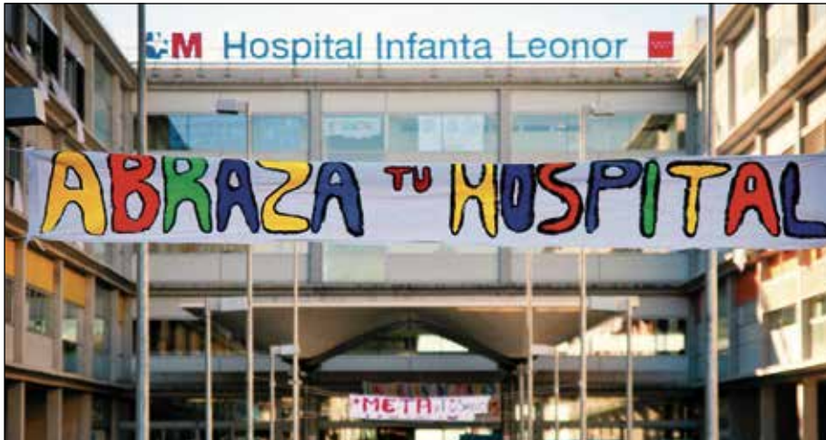
"Abraza tu Hospital Infanta Leonor" en mayo de 2013.

La Marea Blanca, convocada por la Medsap (Mesa en Defensa de la Sanidad Pública de Madrid) desde el 2012, sale a la calle los terceros domingos de mes en Madrid a denunciar el desmantelamiento y privatización de nuestra sanidad pública. La Marea Blanca, además de las manifestaciones/concentraciones en el Ministerio de Sanidad, este año 2017 está acudiendo a los barrios