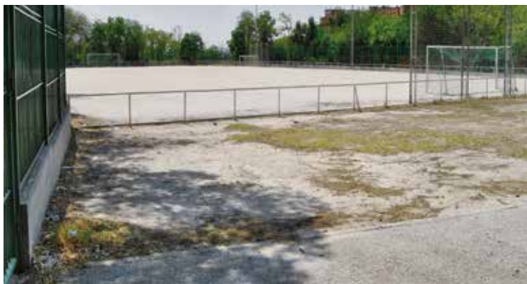
La parcela de Cerro Cabezero, hoy un campo de fútbol de tierra.