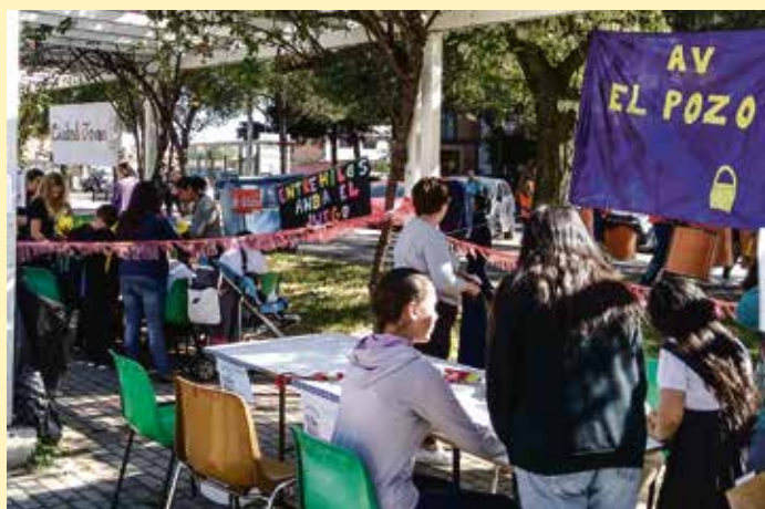
Orientado a los más jóvenes, pero también a la población en general.

Este acto está organizado por las entidades sociales de Vallecas, siendo la mayoría de Entrevías y El Pozo: Fundación Amoverse, Fundación Secretariado Gitano, FRA-VM, Proyecto Primera Prevención Parroquia Santa Mª de El Pozo, Centro MENNI Vallecas, CMS Puente de Vallecas, Movimiento por la Paz (MPDL), Asociación Cultural La Kalle, Centro de Apoyo