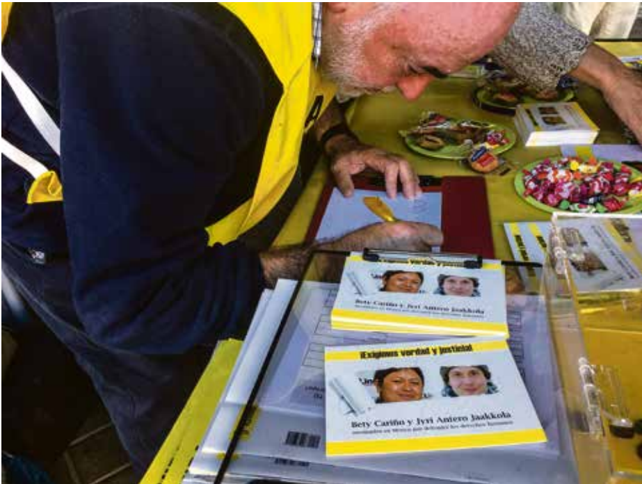
Los vecinos firmaron decenas de postales dirigidas al presidente mexicano.