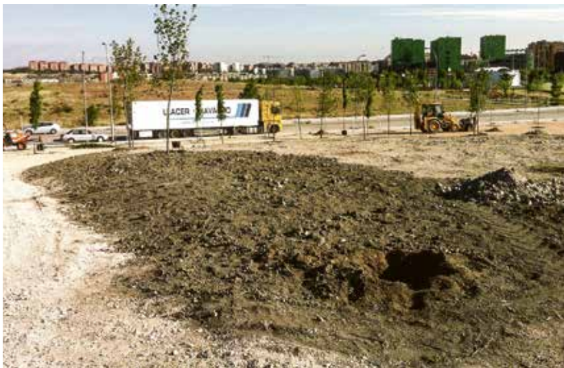
Las obras corresponden a una primera etapa de las dos programadas por el área de Medio Ambiente y Movilidad para la culminación del parque.