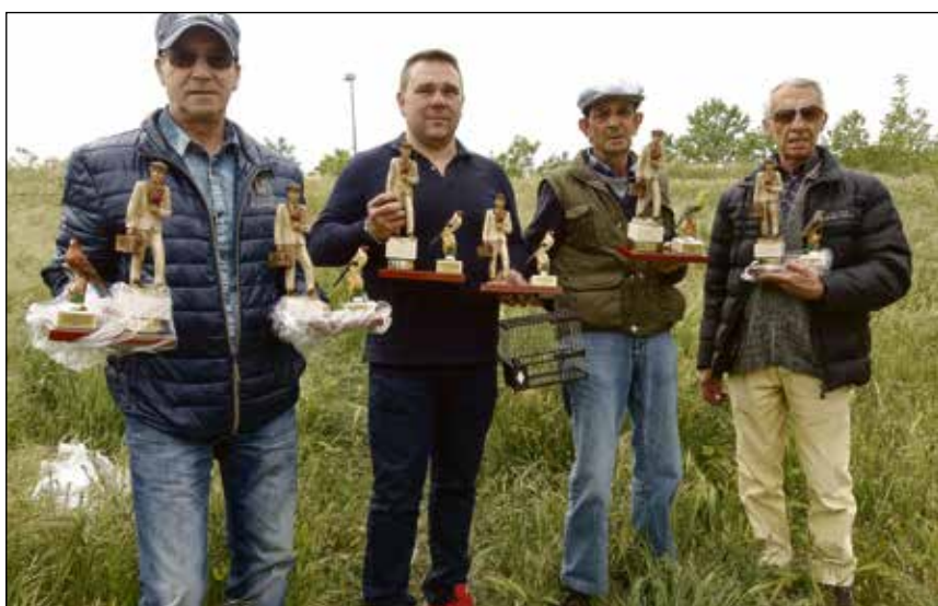
Premiados en la competición.

La clasificación y premios por categorías quedaron como sigue: