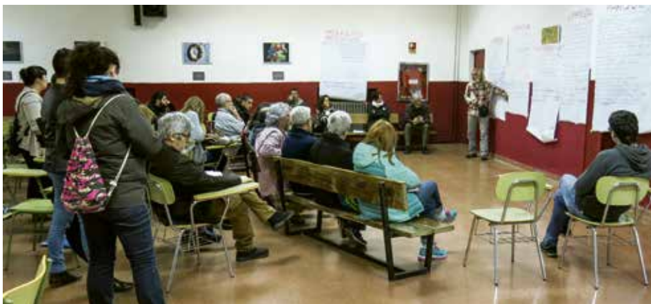
El evento tuvo lugar el pasado 1 de abril en el Instituto Arcipreste de Hita.