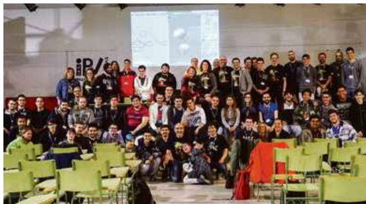
Participantes en el taller.