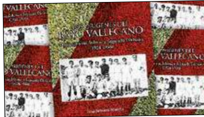
Ejemplares del libro sobre los primeros años de historia del Rayo Vallecano.