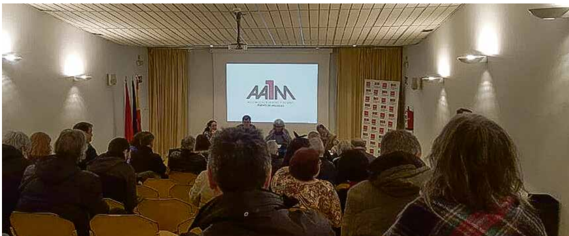
Más de medio centenar de personas asistieron al acto.