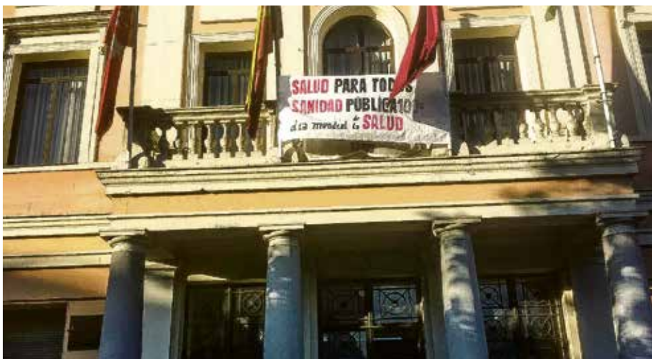
Pancarta en el balcón de la junta de Ponte, en el Día Internacional de la Salud.