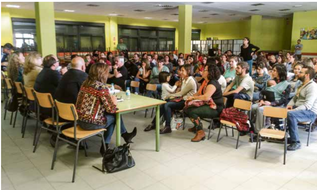
Los padres y madres afectados se han reunido con una representación de la Consejería de Educación.