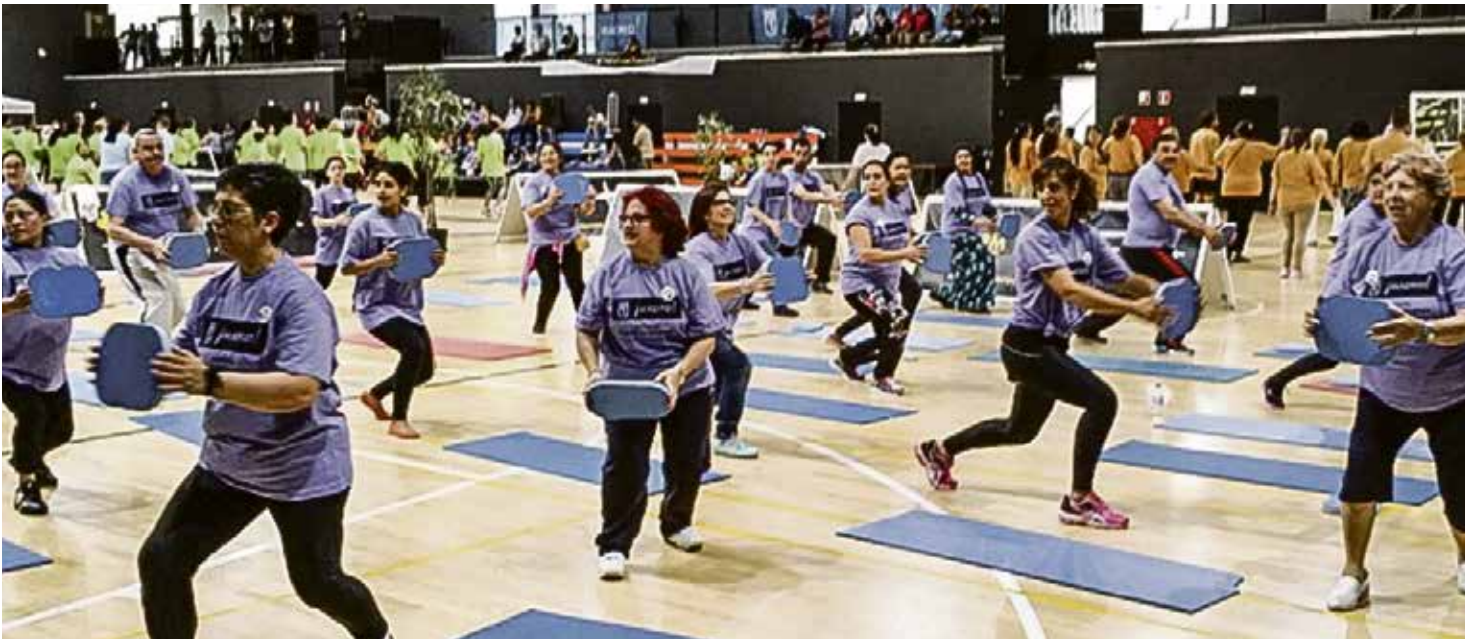
En este programa han participado cerca de 300 vecinos de Puente de Vallecas.