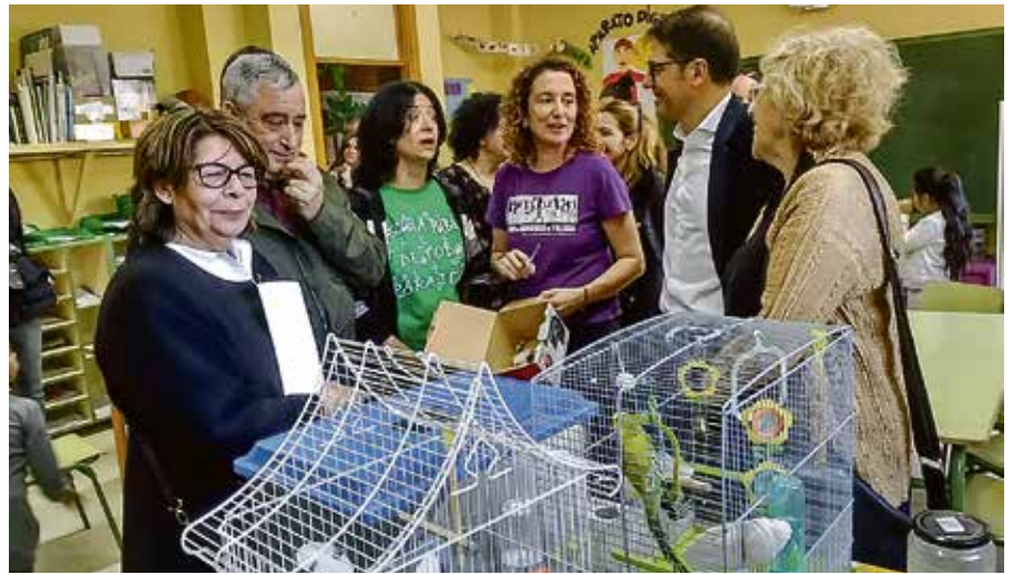
La presentación del programa tuvo lugar en el CEIP Núñez de Arenas.

La entusiasta respuesta de muchos de nuestros vecinos y vecinas se materializó en la firma de decenas de postales dirigidas al presidente mexicano Enrique Peña Nieto, que, a buen seguro, servirán para recordarle al Gobierno mexicano su obligación de investigar y castigar a los responsables de tan atroces crímenes. Solo así, algún día, la impunidad en materia de violaciones de derechos humanos dejará de ser la triste norma en la hermana república mexicana. ■