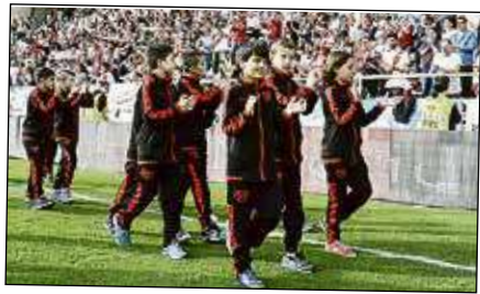
El Benjamín A del Rayo dando la vuelta de honor al Estadio de Vallecas.