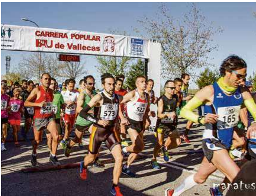
Salida de la prueba.

No hace falta mirar 90 años atrás para buscar la historia del Rayo Vallecano. Hace tan solo unos días, una gloriosa página de la reciente historia del club de la franja roja se ha escrito muy cerca de nosotros, y por rayistas pequeños en altura pero grandes de corazón. Los jugadores del Rayo Vallecano Benjamín A se proclamaron subcampeones de la prestigiosa Iscar Cup tras vencer al Arsenal, Milan y FC Barcelona, y caer derrotados en la final ante el Real Madrid en los penaltis. La gesta de estos pequeños futbolistas se vio recompensada durante el descanso del Rayo-Lugo, en el que los futbolistas dieron una vuelta al terreno de juego y pudieron cantar La vida pirata megáfono en mano, coreada por todo el Estadio de Vallecas.