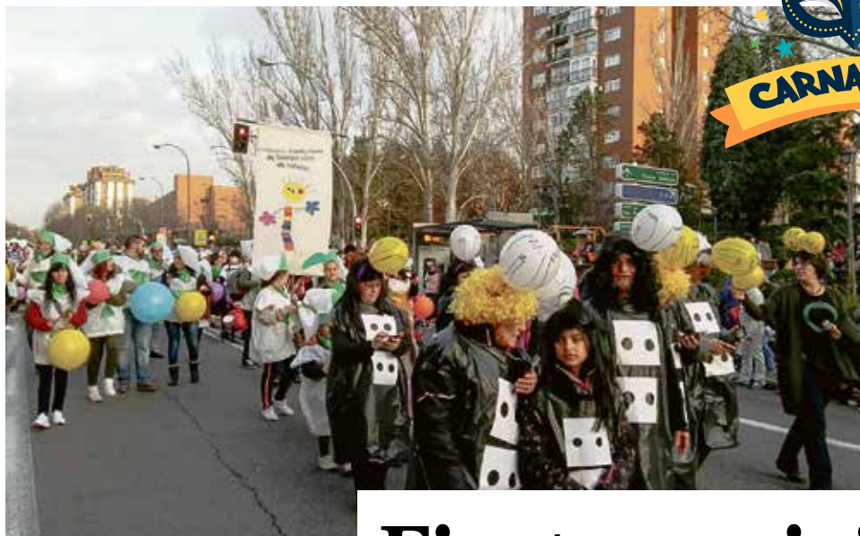
COMISIÓN DE CARNAVAL VK