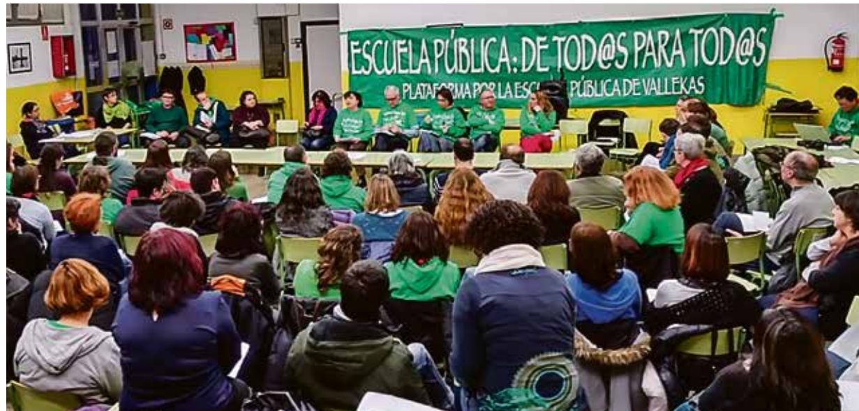
La asamblea del 8 de febrero tuvo una nutrida asistencia.

— Los continuados recortes en educación afectan muy seriamente al funcionamiento de nuestros centros: reducción de profesorado, con el consiguiente incremento de ratios, que muchas veces son desmesuradas y no tienen en cuenta las características del alumnado; drástica disminución de recur-