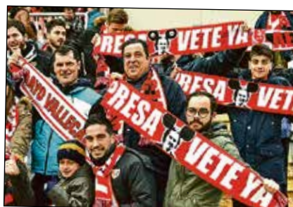
Los aficionados pidieron la dimisión del presidente con cientos de bufandas como éstas.

Con una situación deportiva delicada, en la que el equipo roza los puestos de descenso mientras las relaciones entre los aficionados y la directiva saltan por los aires, lo normal es que surgieran acciones de protesta. Y así ha sido. Entre las más llamativas se encuentra la edición de varios miles de bufandas, como las que aparecen en la foto, para pedir que el presidente del Rayo Vallecano abandone la entidad. El club ha dado la llamada por respuesta, pero pidió por bufofax a un conocido bar donde se encuentra la sede de la Peña Rayista Bus Uno que dejara de utilizar los símbolos del Rayo en la fachada de su restaurante, so pena de ejercer acciones legales. El revuelo fue tal que finalmente no se llevó a efecto ningún tipo de medida contra el bar.