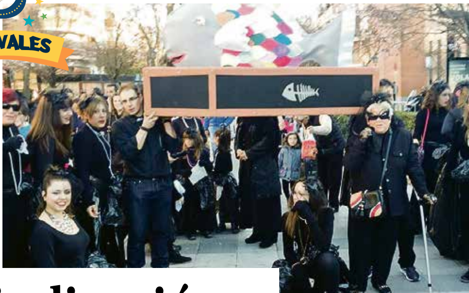
COMISIÓN DE CARNAVAL VK