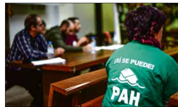
El acto tuvo lugar el 25 de febrero.

drid. El pasado 16 de febrero, representantes del grupo promotor registraban dicha iniciativa en la Asamblea de Madrid. Ahora, en el plazo de tres meses, es necesario recoger al menos 50.000 firmas entre la ciudadanía para que se admita su tramitación. ■