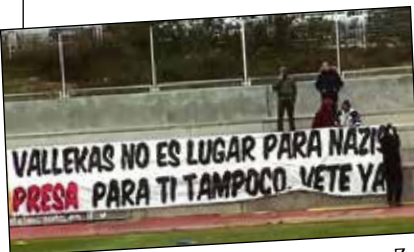
Con esta pancarta fue recibido Roman Zozulya en Vallecas.