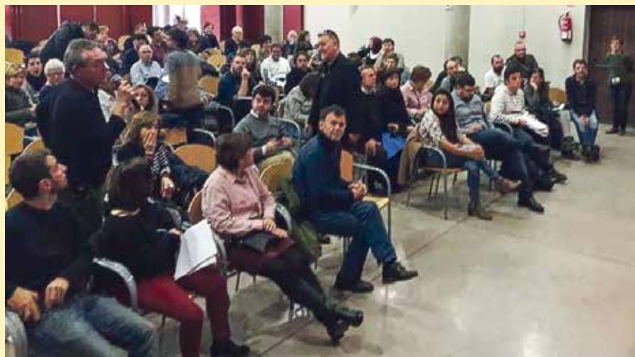
En Villa de Vallecas se registraron más de un centenar de personas.

Finalmente, el acuerdo también contiene distintas medidas relacionadas con el ámbito deportivo, entre las que se incluyen el mantenimiento y ampliación de Vallecas Activa, la construcción de un campo de rugby y la instalación de césped artificial en el campo de fútbol de El Pozo. ■