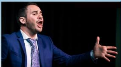
Paco del Pozo

Maestro de maestros, ha protagonizado, junto con figuras como Paco de Lucía, la renovación del flamenco.