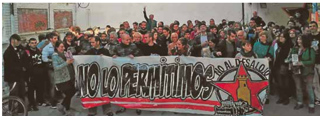
El apoyo vecinal y del tejido asociativo del barrio es bien visible.