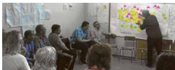
S. DE CONV. INTERCULTURAL