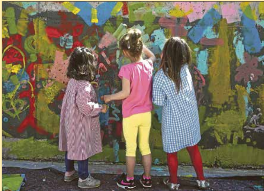
El domingo 22 de mayo tuvo lugar un encuentro vecinal.

En este día se hace más visible y abierta la información a la población, pero cada día trabajamos desde las consultas la deshabituación tabáquica de la población fumadora y la formación por parte de todos los profesionales que trabajamos en el Centro de Salud Vicente Soldevilla para ofrecer una mejor calidad asistencial. ■