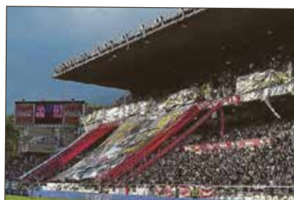
Pancarta gigante desplegada por Bukaneros en la avenida de la Albufera.