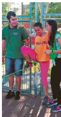
El encuentro tuvo lugar en el Polideportivo Alberto García (El Pozo). MPDL

El guardameta rayista destacó por su compromiso con el juego limpio y el respeto a los valores éticos en el deporte