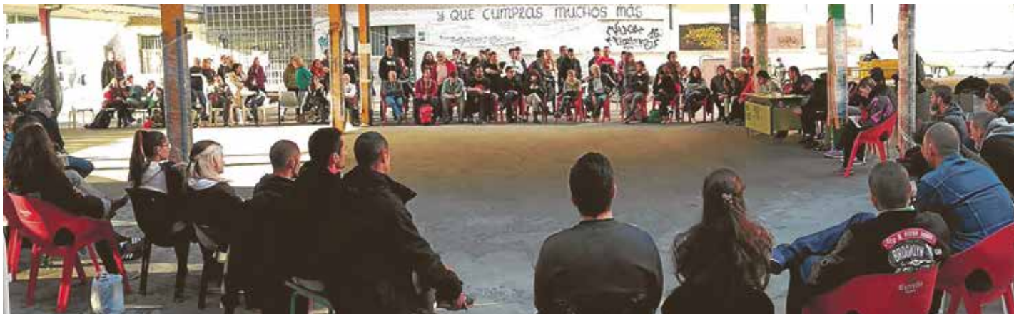
Asamblea abierta al movimiento asociativo vallecano el pasado 28 de abril.

➔ Los proyectos y actividades para el barrio florecen en este centro social amenazado de desalojo por la Comunidad de Madrid