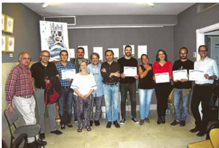
Entrega de premios a los finalistas de la Comunidad de Madrid.