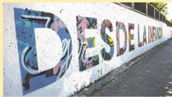
Así quedó el muro de la escuela.