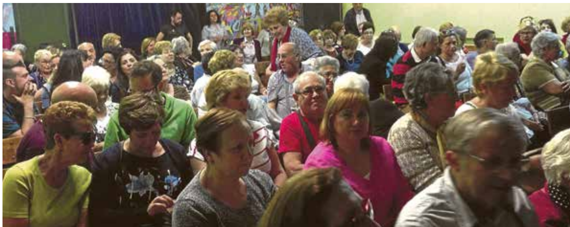
Esta edición ha vuelto a recordar la importancia del grupo en nuestras vidas.

Hubo un espacio destacado para la música desde diferentes registros. El excepcional grupo de clarinetes "Llave 12" nos regaló un precioso concierto, y la formación de viento "La Camarilla" nos deleitó con su espléndido reperto-