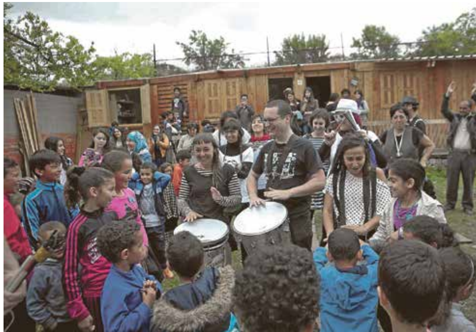
En la jornada se llevaron a cabo actividades muy diversas.

Los sectores 5 y 6 de la Cañada Real Galiana acogieron un encuentro de personas que viven o trabajan en el territorio para demostrar el orgullo de pertenecer a un barrio que trabaja cada día por superarse. Bajo el lema "Yo soy Cañada", 25 entidades y más de 80 personas entre técnicos y