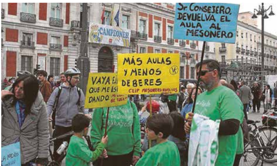
Los centros vallecanos estuvieron presentes en la movilización de Sol.

→ Fin de curso y matriculaciones, acompañados de protestas en distintas enseñanzas