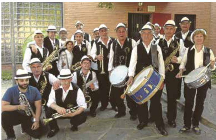
Charanga "La Sonora Refrescante".