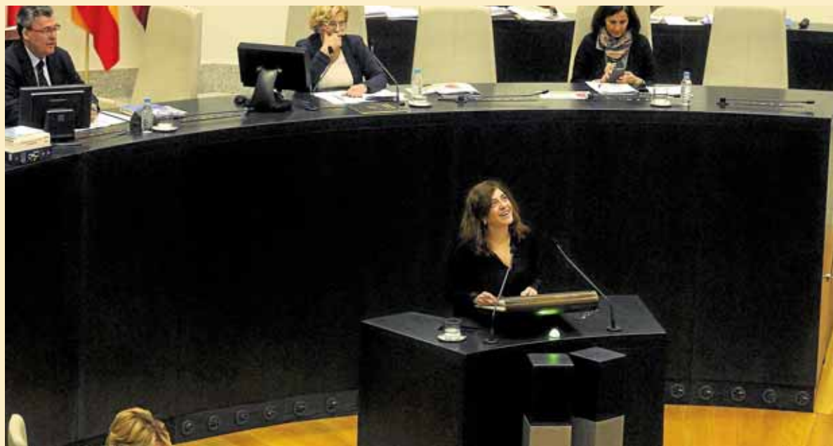
La medida era adelantada en el pleno municipal del 22 de diciembre.