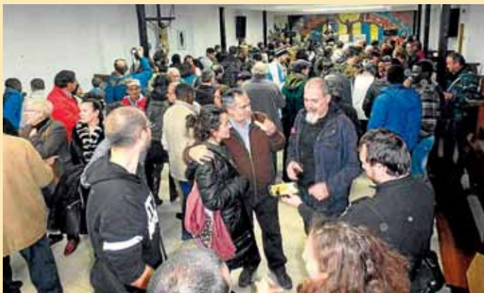
Estupendo ambiente el 11 de diciembre en San Carlos.

La fiesta que tuvimos el 11 de diciembre en la parroquia fue fruto de la intencionalidad al recoger el premio: el único merecimiento para el mismo es el privilegio del encuentro y vinculación que durante estos años hemos tenido. Por eso se llamó a más de 400 personas para participar en la celebración que, por distintas causas, habían tenido relación con San Carlos. El premio fue la excusa para este encuentro. Vino gente de Murcia, Ávila, Tanager, Burgos, Coruña, Santiago, Valencia, Salamanca... donde durante estos años hemos ido tejiendo amistad y so-