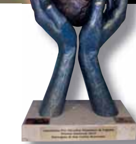
Detalle del premio.

Pero si hay algo que defina esta parroquia, este espacio liberado, como le llama alguna madre, son las mujeres. Es el nuestro un espacio definido en femenino. No solo porque sigue siendo "la-parroquia" o "la-borromeo"; sino porque nuestra historia no hubiera sido posible sin el carisma, empuje, valentía y firmeza de cuantas mujeres la han habitado.