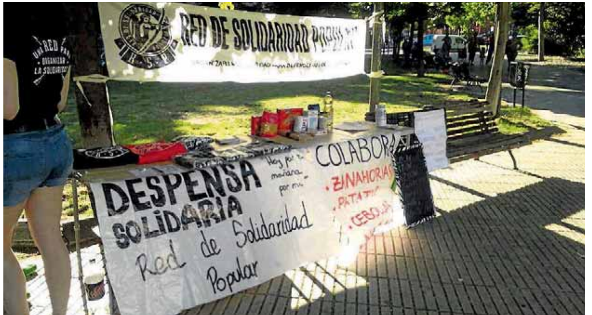
Recogida de alimentos para la despensa.

do al pleno de la junta municipal de Villa de Vallecas durante los últimos 8 años, en estrecha colaboración con las asociaciones de vecinos La Colmena y La Unión. En la actualidad, para acceder al hospital hay que dar un rodeo de varios kilómetros, teniendo que hacerlo desde la avenida de la Democracia, lo que, como comentan desde el grupo socialista, "supone una pérdida de tiempo importante que, en el caso de una ambulancia, puede ser vital". ■