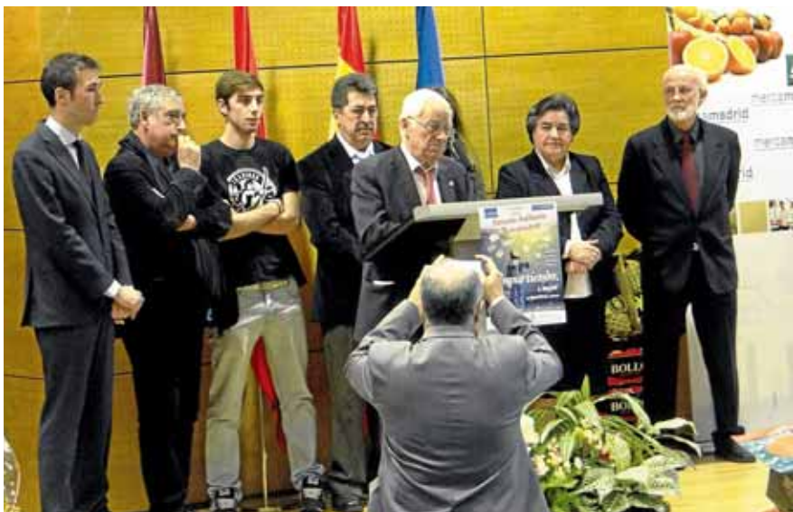
Acto oficial de entrega de las donaciones.