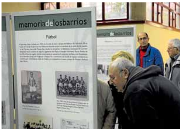
La muestra podrá visitarse hasta el 31 de mayo.

Memoria de los Barrios es un proyecto de digitalización de fotografías y otros documentos de particulares en el que colaboran la red de Bibliotecas Públicas Municipales de Madrid y la Biblioteca Digital memoriademadrid . El objetivo es conservar e integrar en la colección digital de patrimonio bibliográfico y documental del ayuntamiento de Madrid la documentación aportada por los ciudadanos. De esta manera se puede reconstruir la historia de cada uno de los barrios de la ciudad.