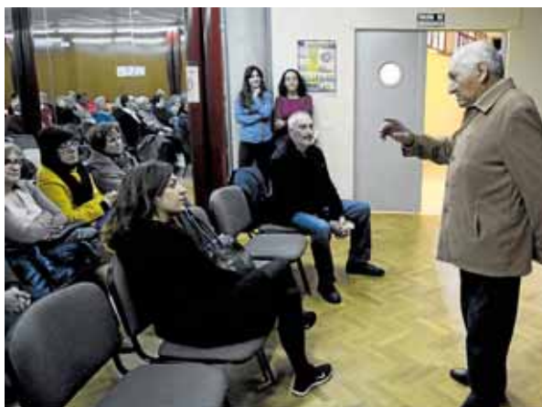
La mirada de estas imágenes pertenece a los vallecanos.