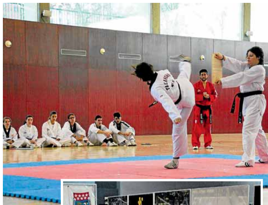
Otro momento del festival (arriba), y puntuaciones en el I Campeonato CDM Entrevías (derecha). ESCUELA M.G.P.

zando un pumses con una música de fondo preciosa de Merche, dedicándosela a su madre fallecida hace algún tiempo, en la que todo el pabellón se puso en pie; y más cuando el maestro, al finalizar la canción y por arte de magia, se sacó una rosa roja y, mirando al cielo, la dio un beso y la dejó suavemente en el tatami. Todo el público estuvo más de 5 minutos aplaudiendo su actuación.