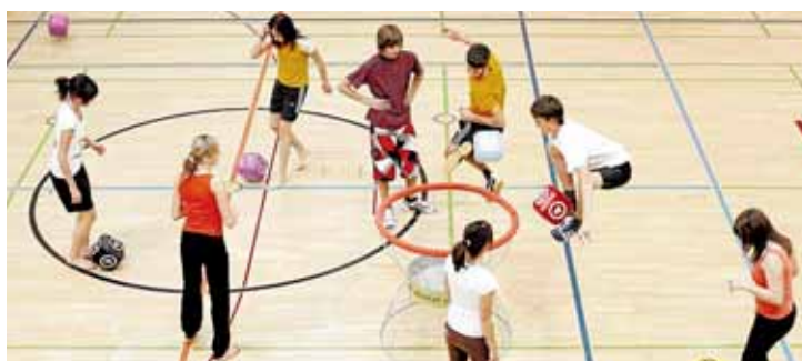
IMPULSO, EDUCACIÓN Y DEPORTE