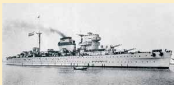
El crucero pesado Baleares.

➔ En esta primera fase, los cambios tienen lugar en 16 distritos y se ejecutarán a partir del segundo trimestre del 2016. Puente de Vallecas modificará dos calles