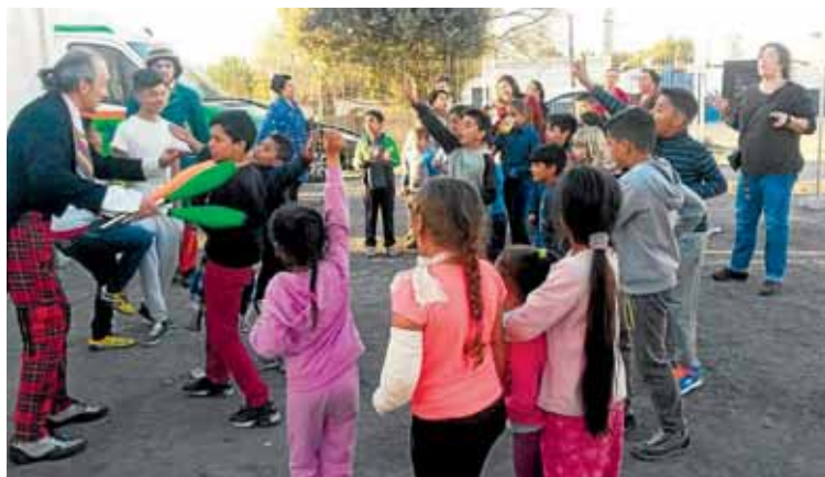
Fue una fiesta divertida y emocionante.