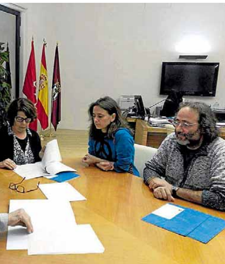
La reunión con el área de Medio Ambiente tuvo lugar el pasado 14 de diciembre. A.V. PAU DEL ENSANCHE DEL VALLECAS

La firma del convenio con el ayuntamiento de Madrid ha supuesto la paralización de la demanda interpuesta en abril. Esta decisión, tomada en asamblea por mayoría de los demandantes, supone dejar el procedimiento judicial en suspenso hasta obtener del Ayuntamiento un plan de actuaciones con fechas y presupuesto para la aplicación de las medidas correctoras aportadas en el estudio olfatométrico, momento en que se desistirá de la demanda.