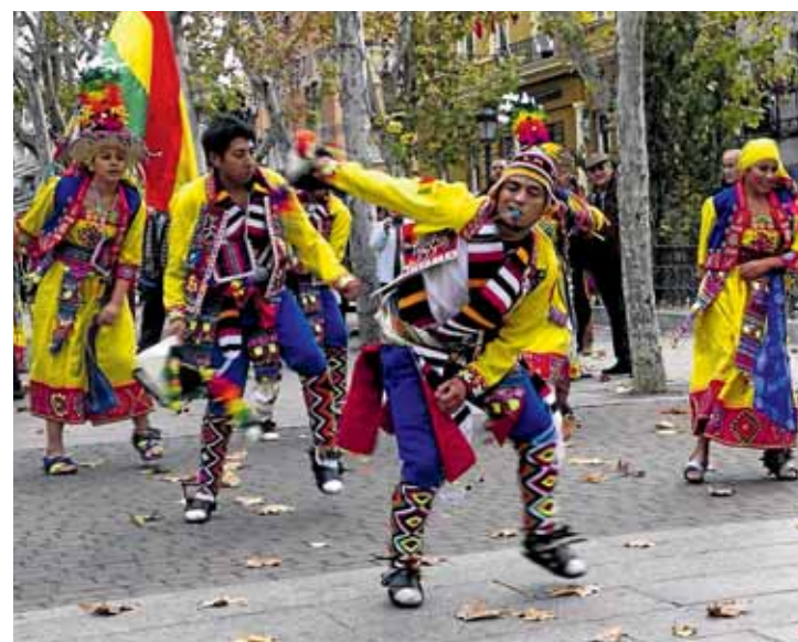
Un pasacalles recorrió el barrio invitando a los vecinos a participar.

De todos estos asuntos, y de otros, aportaron su visión e ideas las personas que se acercaron al bulvar del Puente de Vallecas animadas por el bullicio en sus calles aledañas. Un pasacalles que recorrió la avenida de