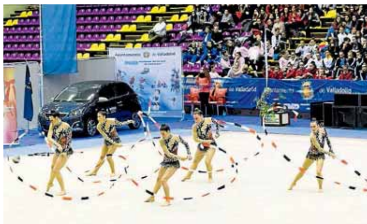
C.E.P. RÍTMICA VALLECAS