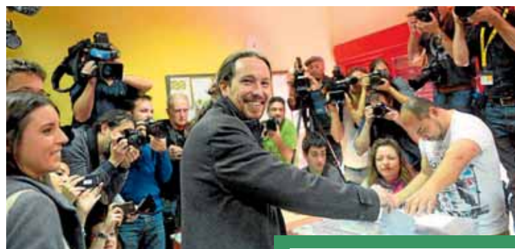
Iglesias, votando en Vallecas.