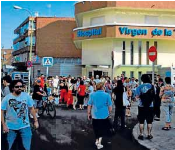
Finalmente no habrá movilizaciones en el hospital.

El sindicato médico había presentado una solicitud de concentración a las puertas del centro para el lunes 11 de enero, así como una convocatoria de 26 jornadas de huelga, "todos los martes y jueves de enero, febrero y marzo, para los facultativos del Servicio de Medicina Interna del Hospital Virgen de la Torre". Todas estas movilizaciones han quedado desconvocadas como resultado del acuerdo alcanzado. ■