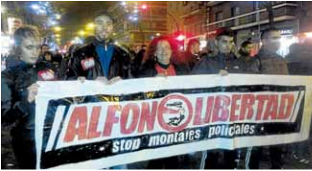
La marcha recorría la Albufera en la tarde-noche del 17.