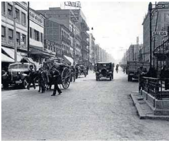
VALLECAS TODO CULTURA

No. Aquí las características negativas, si las hay, vienen impuestas desde arriba, en favor de otros barrios de más bronce y lámina, como los que albergan al-