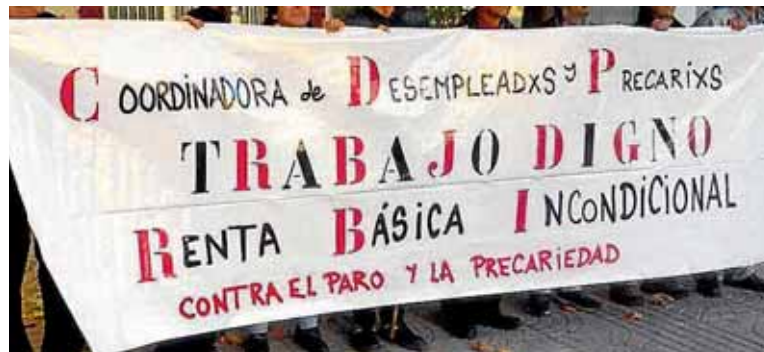
La coordinadora reclama empleos dignos y un ingreso mínimo garantizado.