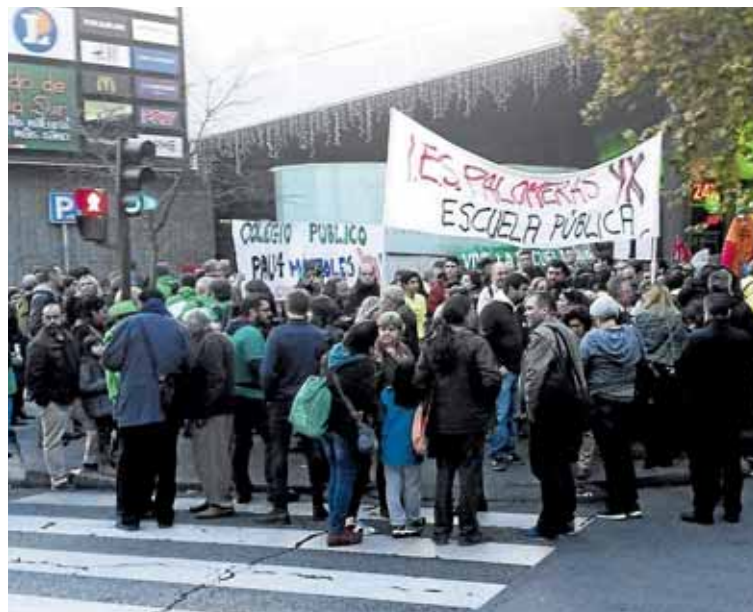
La convocatoria reunió a varios cientos de personas.

ción de asociaciones vecinales considera "absolutamente necesario revertir esta política de austeridad que no ha servido sino para incrementar las desigualdades sociales". La Plataforma de Vallecas por la Escuela Pública apunta que la Comunidad de Madrid necesita unos presupuestos que garanticen suficiente profesorado —demandando la vuelta de los interinos despedidos—, la gratuidad de la enseñanza de 0 a 16 años y la reducción de las tasas universitarias, recursos de material y libros a los centros y a las familias, construir los centros necesarios y dignificar la Formación Profesional. ■