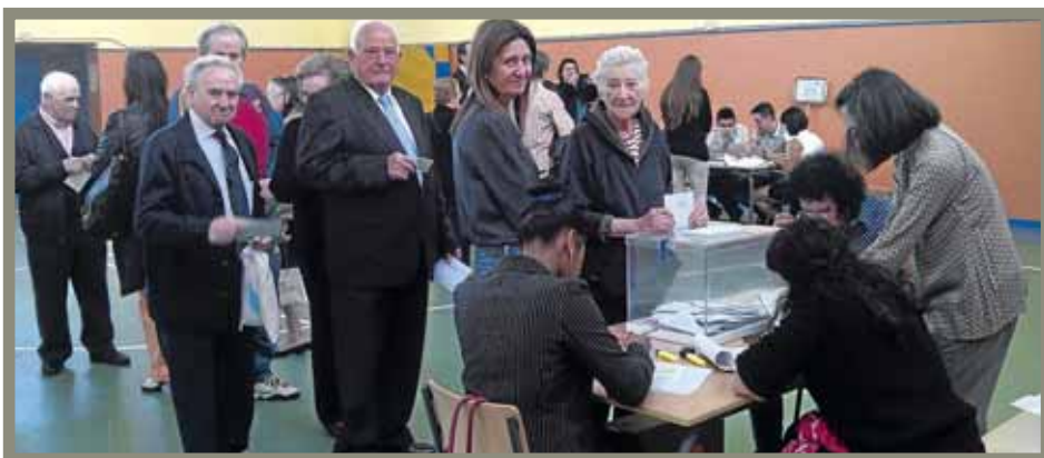
Colegio electoral en Vallecas durante las pasadas elecciones europeas.

Pudiera interpretarse que cada muy poco tiempo "aparecieran" a una velocidad trepidante nuevas