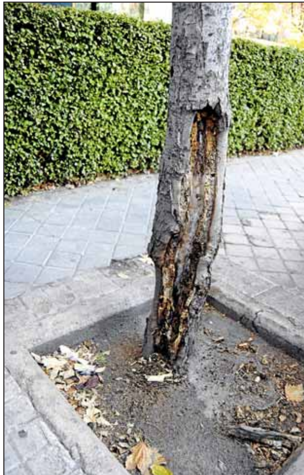
Árbol en Nuevas Palomeras. El riesgo de caída es evidente.