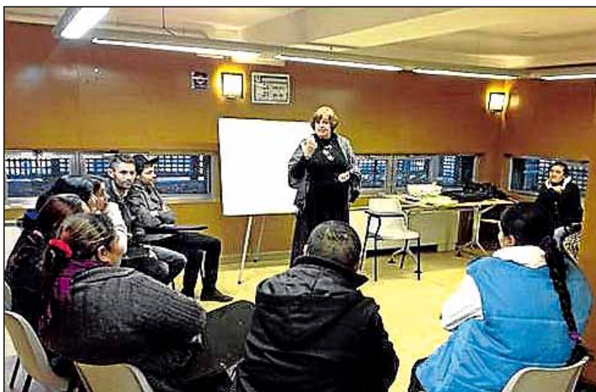
Curso de mediadores.

De los quince alumnos que han participado en estos cursos, diez han obtenido el diploma de mediador. De ellos, cuatro han sido con-