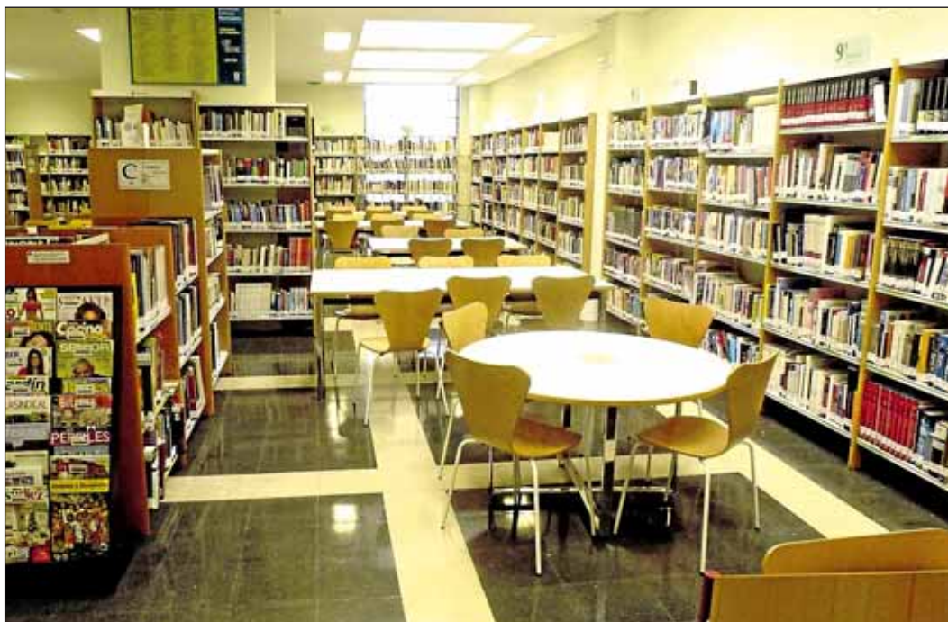
Sala de lectura de la biblioteca.