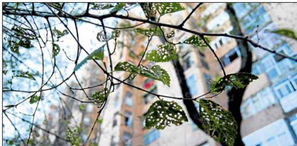
Hojas afectadas por plaga de insectos.