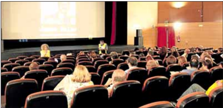
En el acto se recordó también el caso de James Balao.