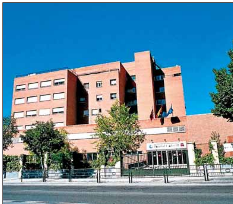
Hospital Virgen de la Torre.

Como se recoge en el informe, "desde hace décadas asistimos a un progresivo aumento del envejecimiento de las poblaciones". Entre los países a la cabeza se sitúa España, estimándose que para el año 2050 el 35% de su población tendrá más de 65 años. Esto, entre otras cosas, tendrá como consecuencia "el rá-