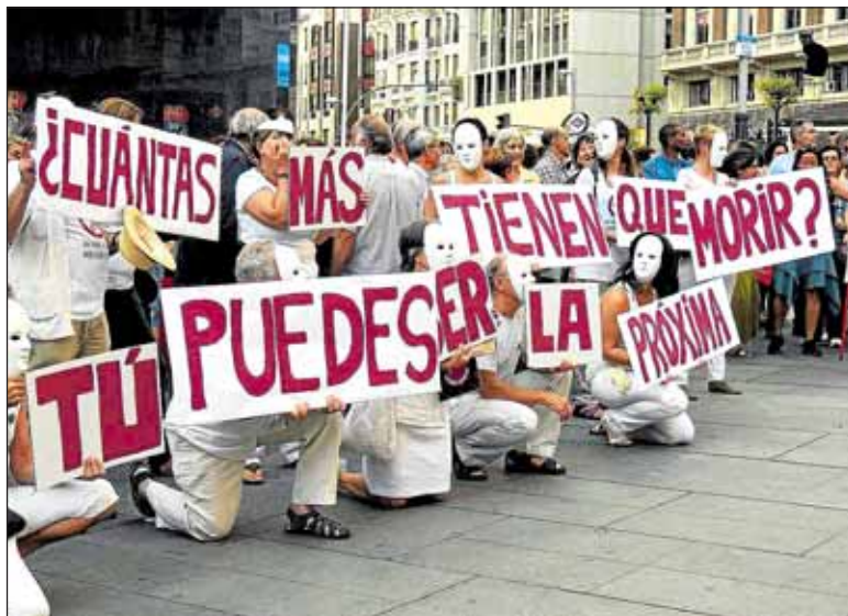
Un mensaje que conviene no olvidar.