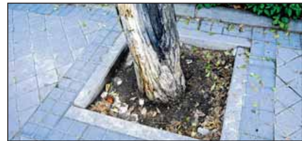
El deterioro afecta a todos los barrios de la capital.

El Ayuntamiento ha negado responsabilidad alguna relativa al cuidado de los árboles, extremo en el que vecinos y trabajadores no coinciden, y están indignados. La Asociación de Vecinos La Colmena ha iniciado una recogida de firmas para exigir una revisión exhaustiva del arbolado y medidas "para que no sucedan cosas así". También realizaron el fin de semana siguiente a este trágico suceso un acto de homenaje cerca del lugar del "accidente", guardando dos minutos de silencio en recuerdo del vecino fallecido, y una manifestación el día 18 desde ese mismo lugar hasta la junta de distrito de