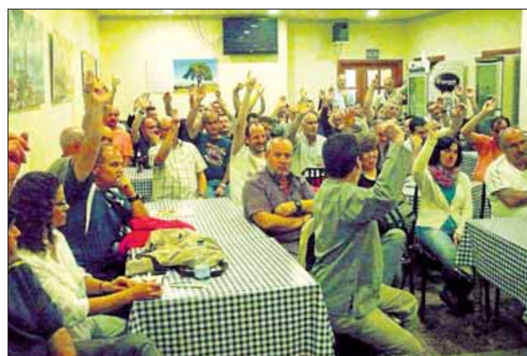
Asamblea de trabajadores el pasado 22 de septiembre.

Si dichas negociaciones no se iniciaran en quince días, a contar desde la asamblea, los trabajadores han advertido de que "inmediatamente después se reanudarán el calendario de movilizaciones hasta que se aplique la sentencia en todos sus términos. Estas movilizaciones darán comienzo con una concentración frente a las oficinas de UPS en Alvento", precisaban en la misma resolución.