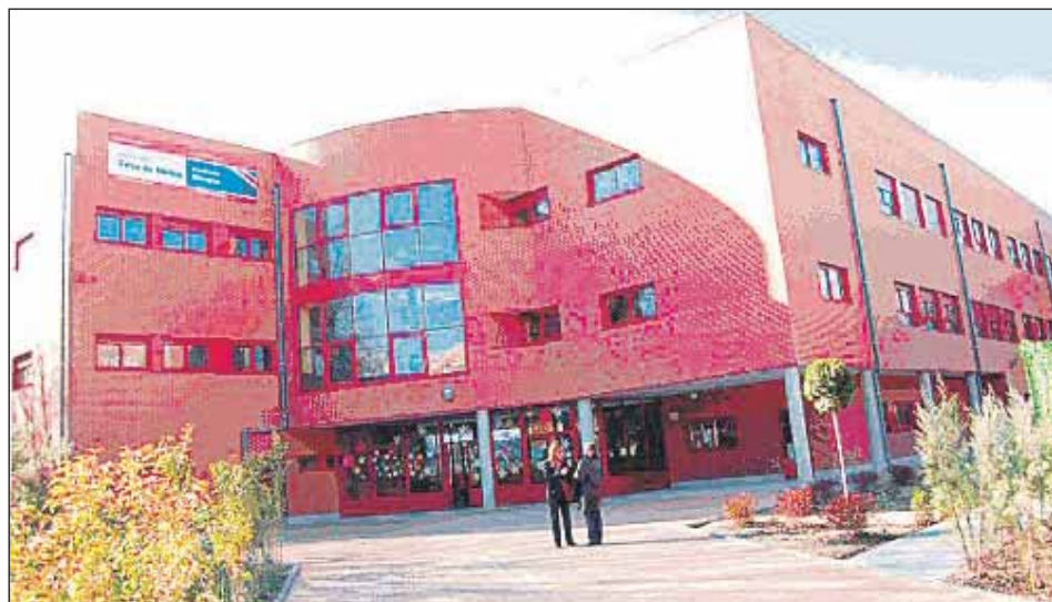
Fachada principal del centro.