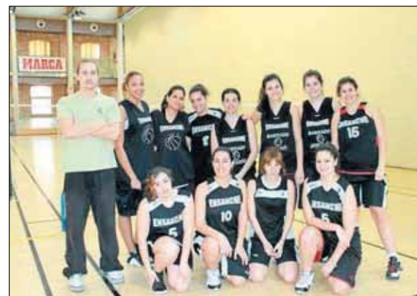
Conjunto Sénior Femenino.

Buscamos jugadoras con ganas, independientemente de su nivel deportivo o su estado de forma física. Vamos a entrenar durante los próximos meses para tener un equipo perfectamente constituido y listo para competir en Segunda Autonómica, o en su defecto en los Juegos Deportivos Municipales.