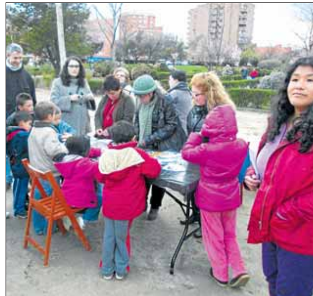
La iniciativa tendrá lugar en el Parque Campo de la Paloma.

¡¡Anímate y demuestra con nosotros que Vallecas sigue siendo un barrio sin fronteras!!