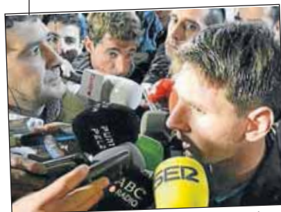
Leo Messi responde a los periodistas tras enfrentarse al Rayo Vallecano.