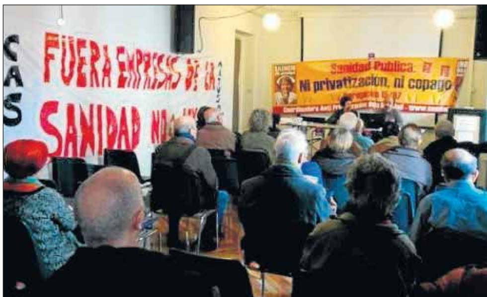
La presentación tuvo lugar el pasado 20 de febrero.

En el caso de la Comunidad de Madrid, con las políticas del PP a partir de 2004, se han puesto en manos privadas: 10 hospitales, 400.000 habitantes cedidos a la Fundación Jiménez Díaz (IDC Salud) junto con los ambulatorios públicos de Quintana y Pontones, otro hospital privado modelo PPP (Villalba) cerrado por el que pagamos mensualmente 900.000€, un macrolaboratorio al que son derivadas las muestras de 1 millón de