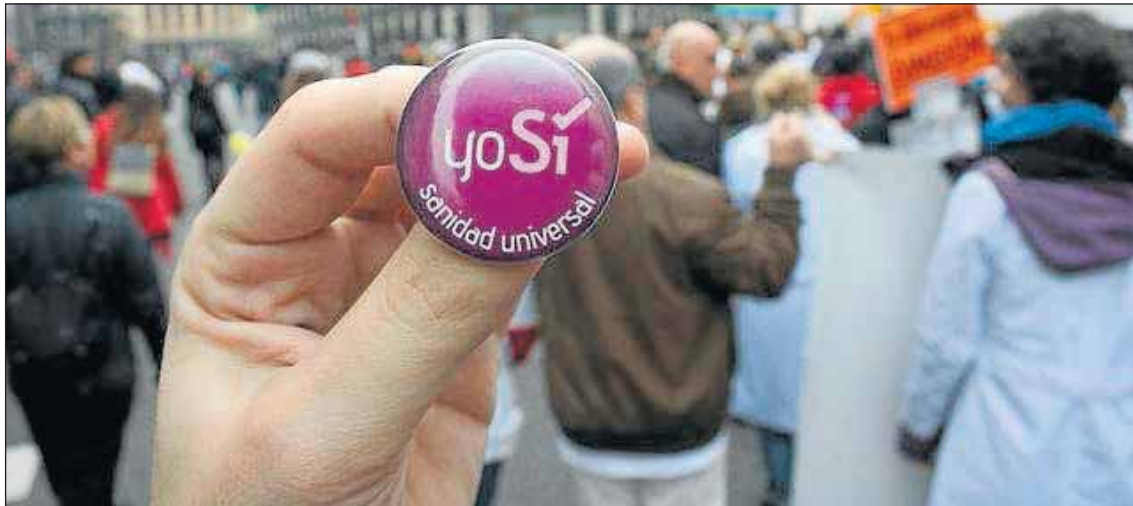
Se han ido creando grupos de acompañamiento en distintos barrios de Madrid.

Las consecuencias concretas del Real Decreto son un efecto disuasorio no solo en las personas enfermas, sino también en los profesionales, incluso en situaciones en las que está garantizada la asistencia sanitaria (embarazadas, menores, urgencias, enfermedades