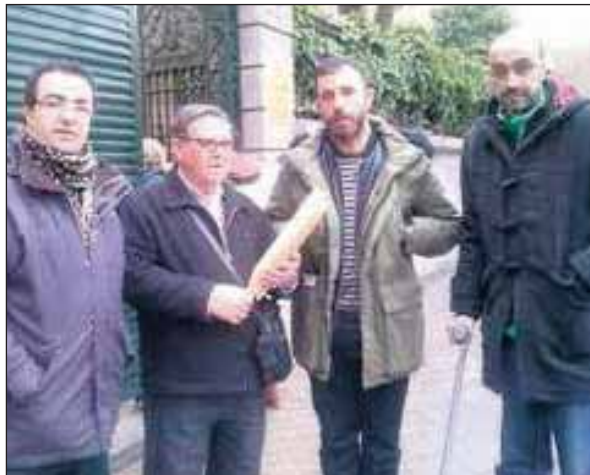
Representación de afectados que entregó las firmas.

Por la 'vulneración de derechos y libertades' provocada por la operación