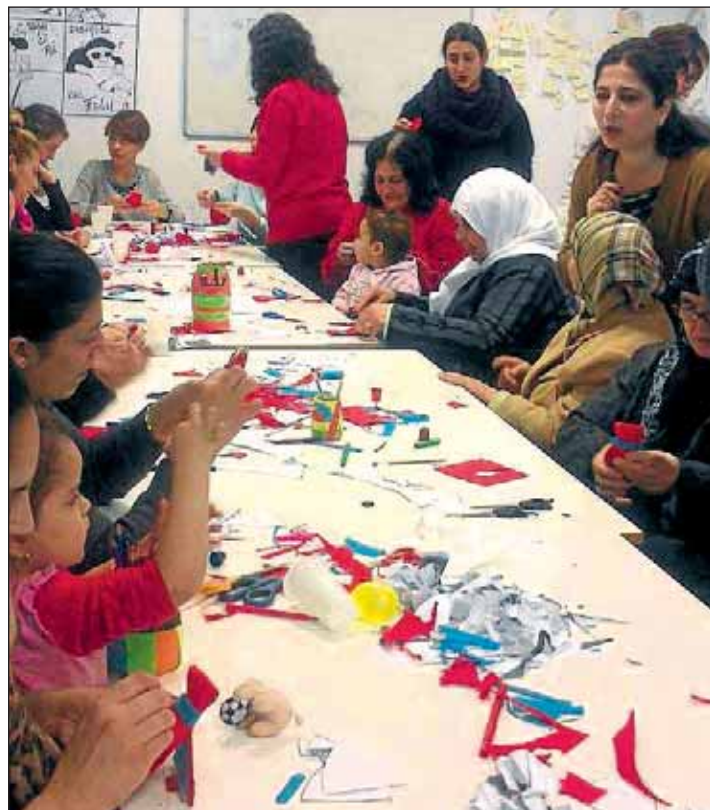
A través de la escuela se llevan a cabo actividades interculturales y de ocio.

La última iniciativa intercultural que se ha puesto en marcha desde la Escuela de Convivencia es la preparación de la celebración del carnaval, donde se espera implicar a los adultos sea cual sea su etnia, cultura o nacionalidad. Este proyecto cuenta con el apoyo de Obra Social "la Caixa".