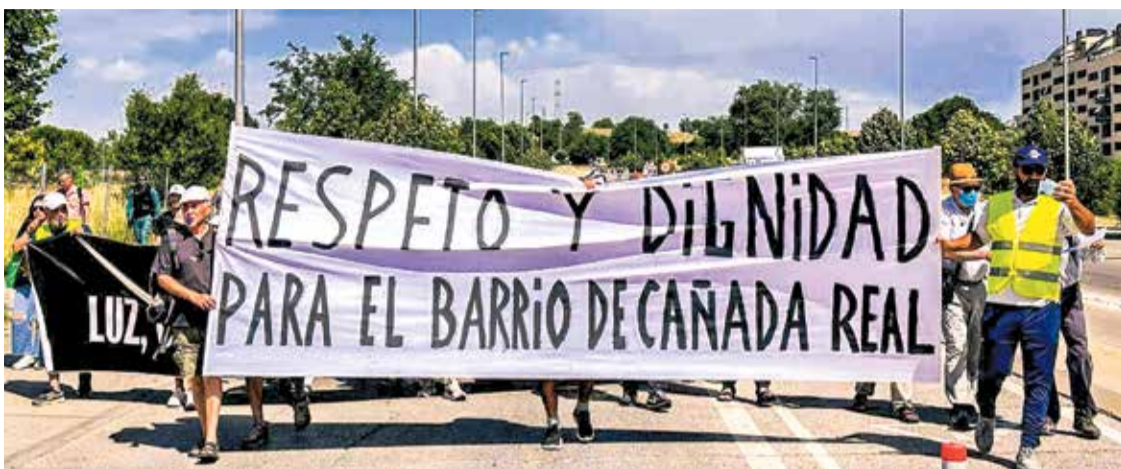
▲ El vecindario de diferentes sectores de Cañada Real y de otras partes de Madrid, en la manifestación del pasado 14 de junio PLATAFORMA LUZ