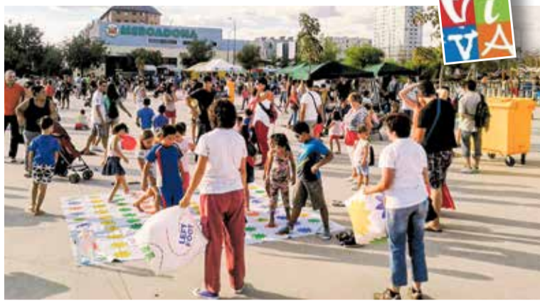
▲ Actividades en la explanada de las Suertes

El consejo para madres y padres sería este: miralo con amor. Pon límites, sí, pero no te retires emocionalmente. Hazle sentir que sigues a su lado, incluso cuando no sabe expresarse bien. Nuestros hijos necesitan padres que no dejen de intentarlo. Padres que sepan escuchar, esperar, sostener y recordarles, incluso en los momentos difíciles, que no tienen que sufrir solos.