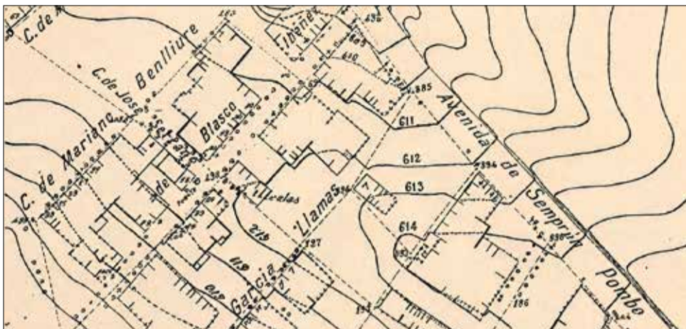
▲ La Avenida de Semprún Pombo