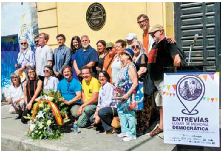
▲ Los asistentes al descubrimiento de la placa en San Carlos Borromeo F. BÓDALO