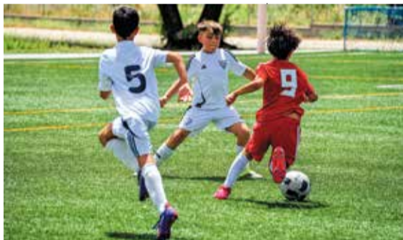
◀ Una de las jugadas del torneo APELAYOREY

La competición se articuló en torno a dos jornadas. El sábado