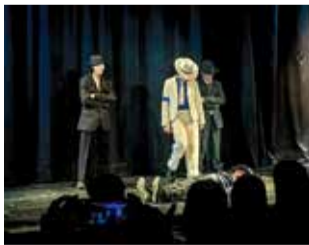
◀ La actuación inspirada en Michael Jackson A. D.

El festival «Mil Colinas», que surge del programa «Semillas» del Instituto Madrid Sur, se ha consolidado como una de las citas más significativas del ámbito estudiantil, combinando talento artístico, participación intergeneracional y un claro compromiso solidario. La primera de las dos jornadas de la edición de este año, celebrada el 11 de junio en el Centro Cultural Lope de Vega, estuvo marcada por una elevada implicación del alumnado y por una notable respuesta del público, que llenó el espacio de aplausos, vítores y complicidad.