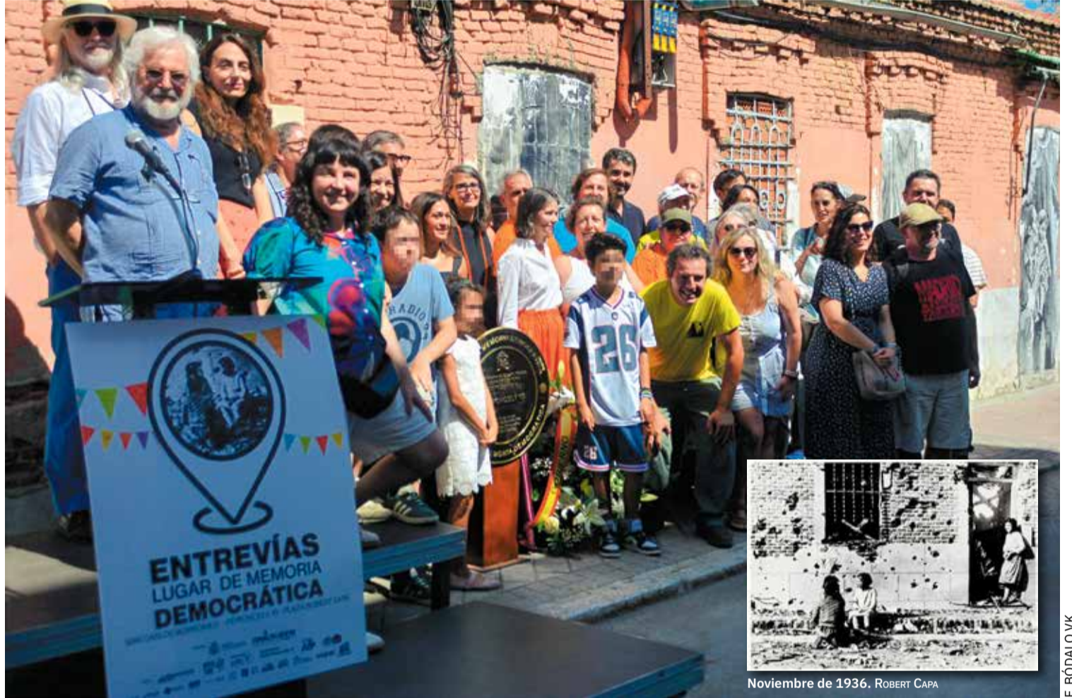
Noviembre de 1936.