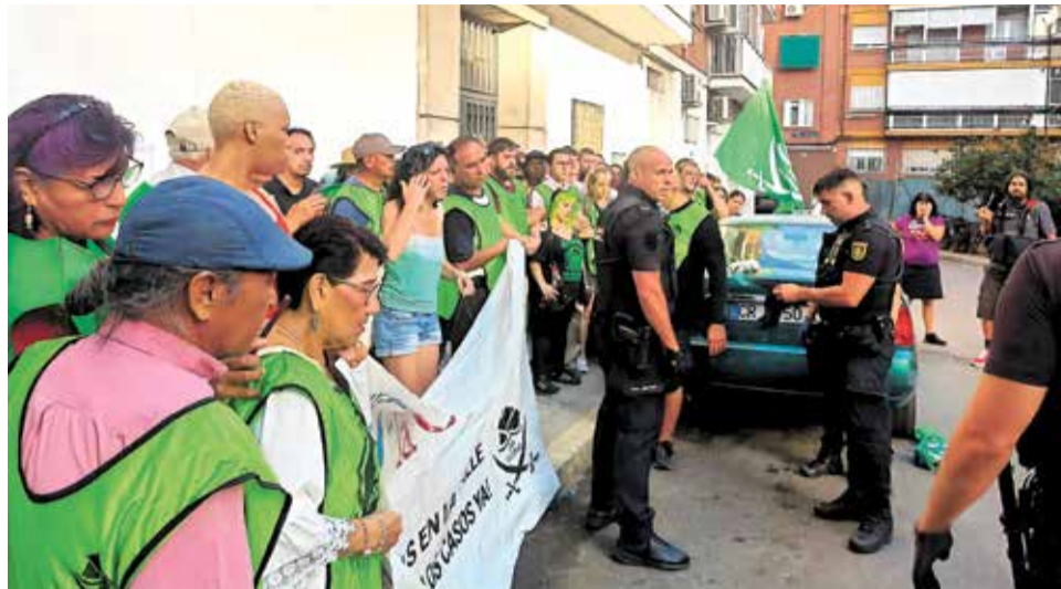
▲ Activistas de PAH Vallekas en un intento de desahucio en Vallecas PAH VALLEKAS

Frentes de lucha. En PAH Vallekas tenemos tres grandes frentes de lucha contra CaixaBank. Uno es el hipotecario: la entidad sigue reclamando miles de viviendas en ejecuciones hipotecarias iniciadas con la crisis de 2008. La casuística es enorme y no es lo mismo llevar años de impago que estar al borde del impago con la hipoteca prácticamente ya amortizada. En todo caso, negociamos mejor si nos agrupamos que por nuestra cuenta, y alertamos del fraude existente entre algunos