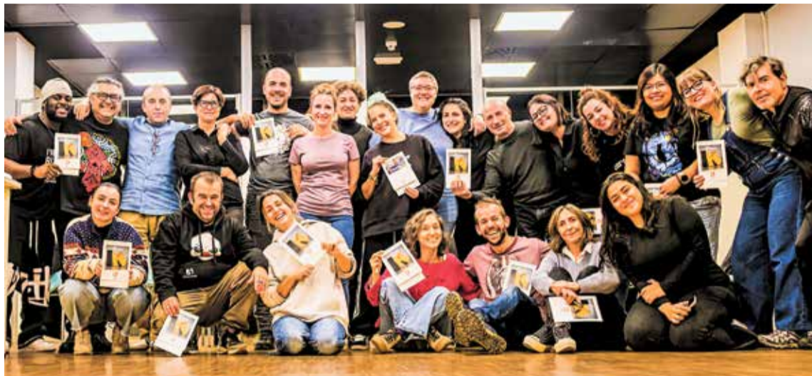
▲ Miembros de la Asociación Cultural La Kalle