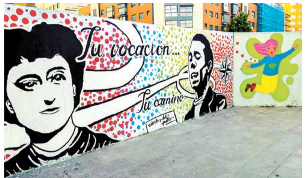
▲ El mural pintado en una de las paredes del instituto María Rodrigo

La figura de María Rodrigo completa ese diálogo entre arte y memoria. Compositora brillante y pionera, simboliza la capacidad de la cultura para resistir al olvido. Su nombre preside