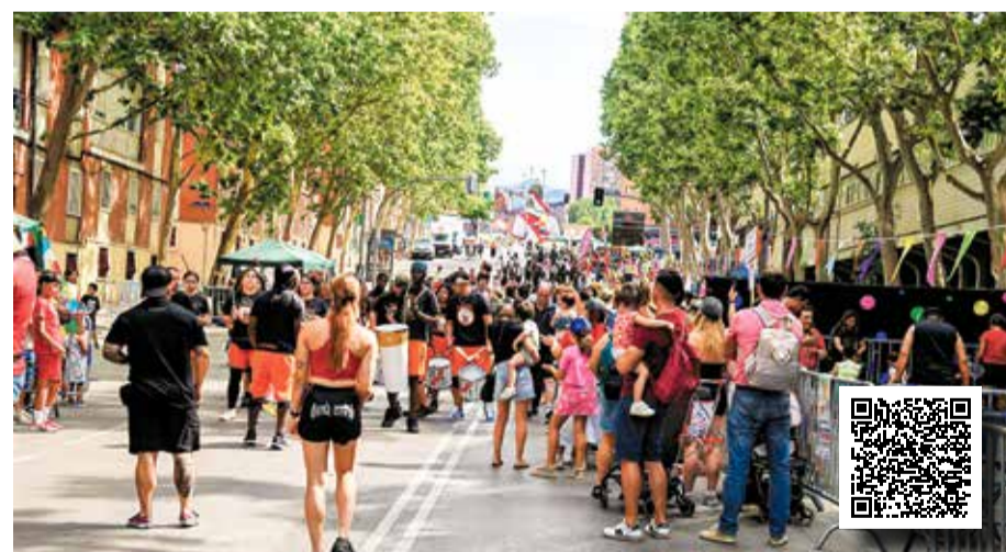
▲ El entorno de la calle de Payaso Fofó J. INASTRILLAS

Los espectáculos también se hicieron un hueco entre las diferentes actividades programadas a lo largo de la mañana. El Desván de Vallecas organizó una representación protagonizada por varios payasos que realizaron un truco de magia con una campanilla y repasaron algunas operaciones matemáticas