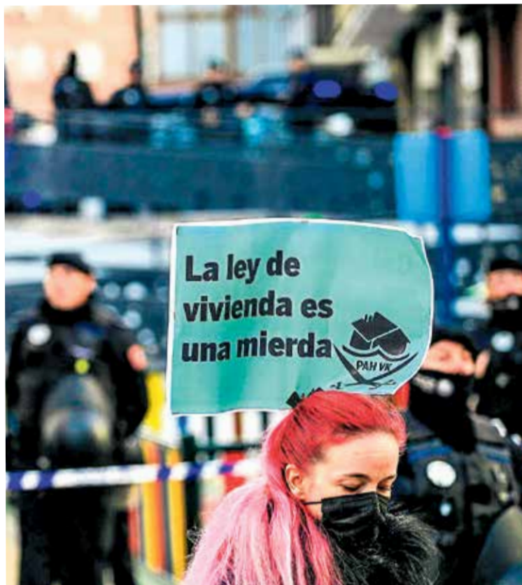
▲ Una de las protestas ciudadanas PAH VALLEKAS

Más grave aún es comprobar quién ha consolidado esta deriva. El autodenominado Gobierno progresista prometió derogar la 'ley mordaza' nada más comenzar su mandato. PSOE, Sumar,