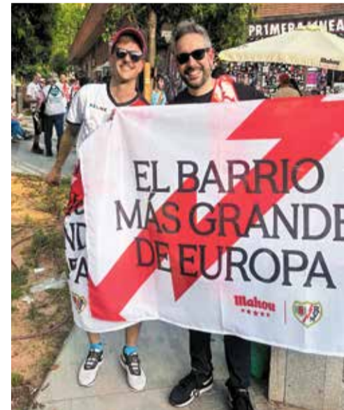
▲ Dos aficionados muestran una bandera en los alrededores del mercado de Numancia M. J.