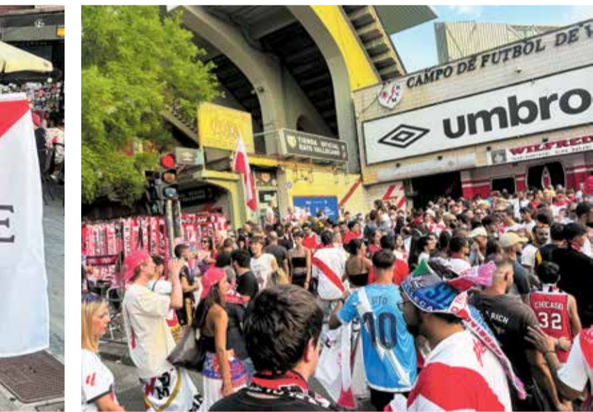
▲ Seguidores esperan acceder al estadio del Rayo M. J.

mejor preparada que nunca para abordar, como los piratas que son, un nuevo gran botín.