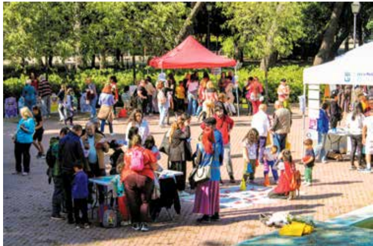
▲ El II Encuentro Intergeneracional Red VIVA 2026

La jornada intergeneracional tuvo lugar el 8 de mayo en el Parque de las Cataratas