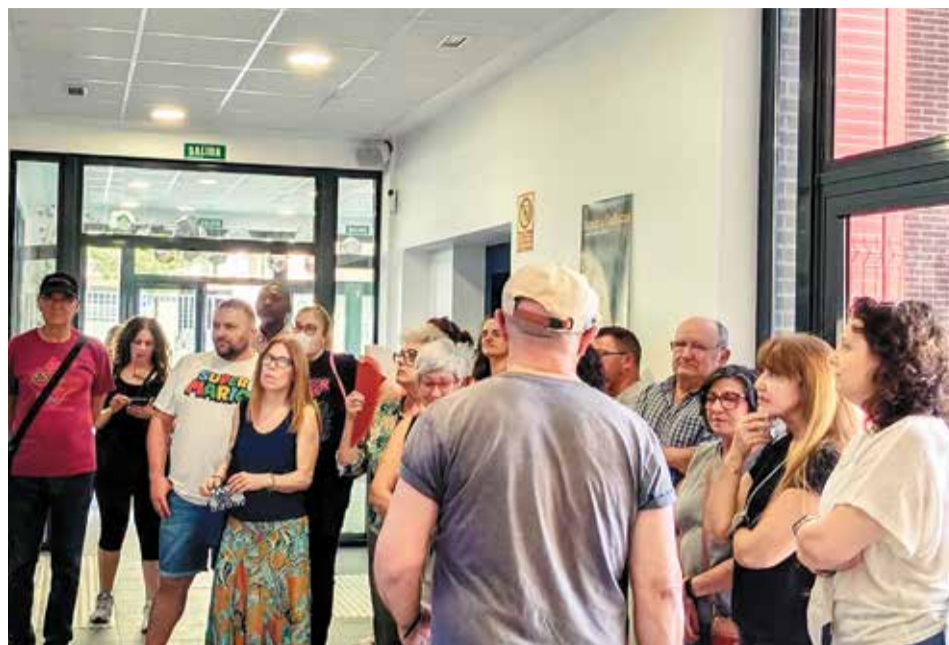
▲ Un momento del encuentro vecinal en el María Rodrigo

La charla recordó, además, algo esencial: detrás del pan hay también una historia de emigración. Muchos panaderos, como la figura de Francisco Malasaña,