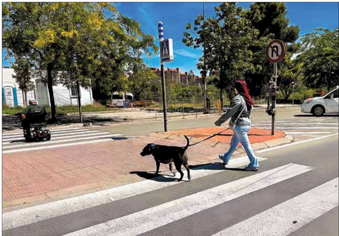
▲ Varios vecinos cruzan la Avenida de Rafael Alberti y Díaz

Pese a que ya parece que tienen una solución entre sus manos, para algunos no es suficiente. «El semáforo vale, pero, ¿y el badén qué?», se quejan otros de los ciudadanos. El vecindario está cansado de la espera, de tanta insistencia y con mucho descontento, sobre todo por la irresponsabilidad de los conductores al transitar por la vía. Vallecas VA, en primera persona, visualizó cómo algunos circulan a gran velocidad causando riesgos extremos.