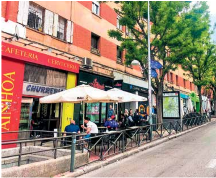
▲ El eje comercial de la Avenida de la Albufera M. T.