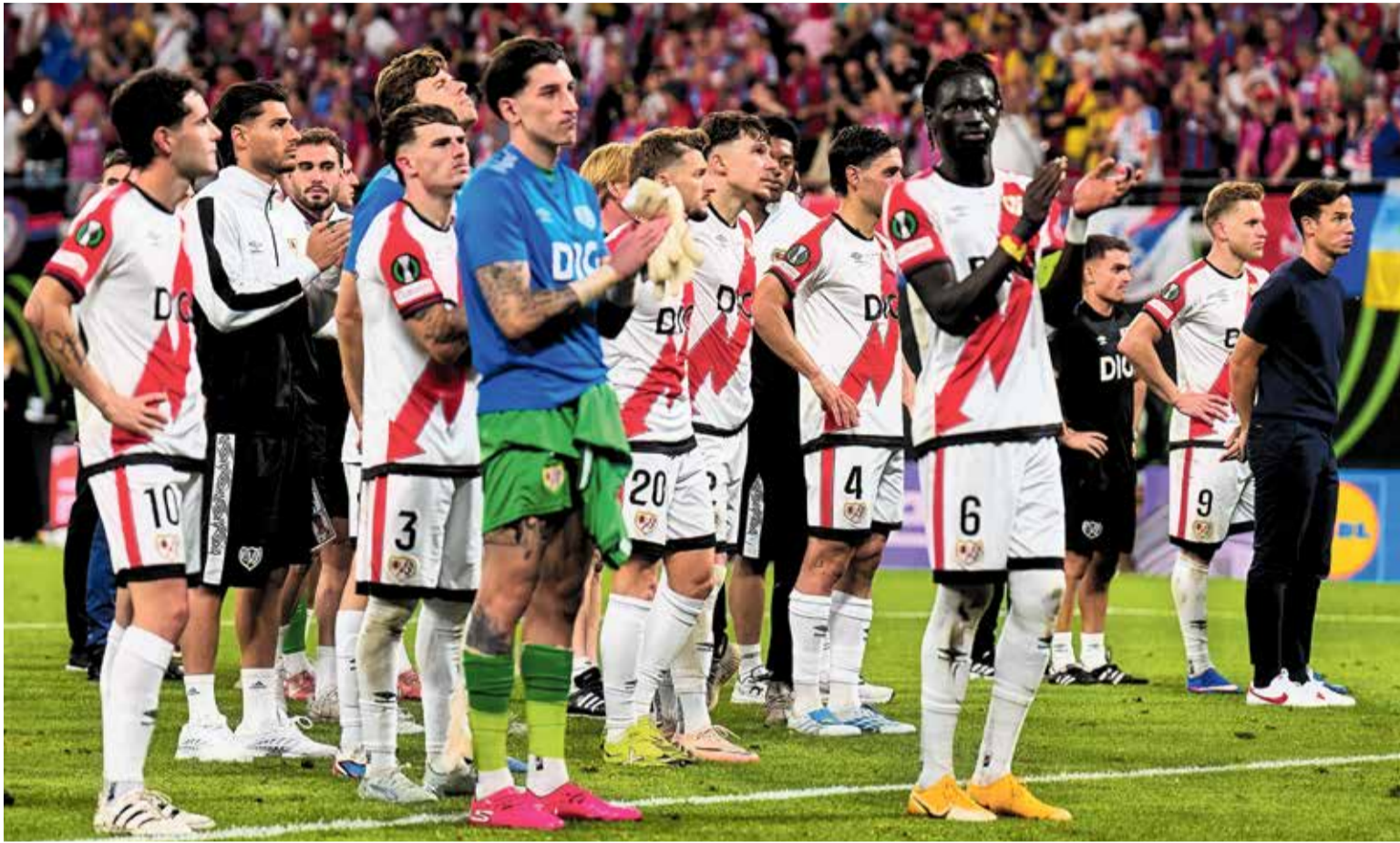
▲ Los jugadores del Rayo agradecen el apoyo de su afición, al término del partido RAYO VALLECANO