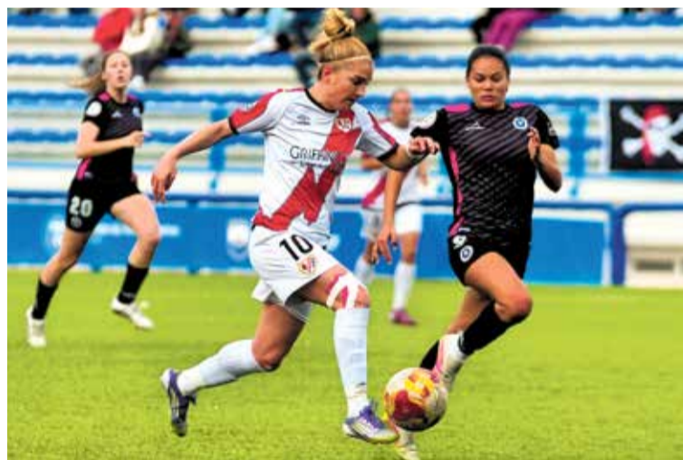
▲ Una de las jugadas del partido entre el Rayo femenino y el Zaragoza CFF @FUNDRAYOFEM

noticias tiene nombre propio, Sergio Camello. El delantero madrileño recuperó su olfato goleador en un momento clave de la temporada, firmando el tanto de la victoria ante el conjunto perico y otro más ante la Real de Matarazzo.