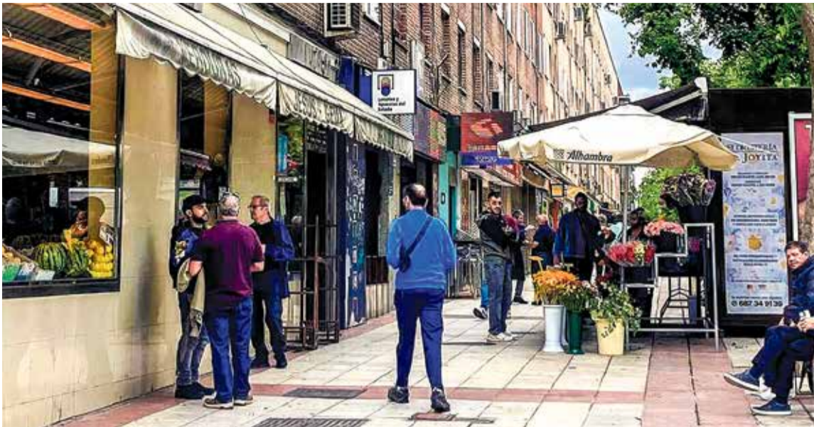
▲ El eje comercial de la calle de Pedro Laborde M. T.

a servicios esenciales, como los relacionados con la salud, y desaparecería ese trato humano y personalizado que solo ofrece el comercio de barrio. Detrás, hay personas, vecinos que han decidido emprender para aportar valor y vida a su propia comunidad. Apoyar al comercio local significa fortalecer la economía del barrio, generar empleo y mantener vivo ese tejido social que nos conecta como comunidad. Mantener un negocio implica un gran esfuerzo diario, y nuestra mayor satisfacción es poder ofrecer un servicio de calidad que contribuya al bienestar de nuestros vecinos. Si cuidamos de quienes tenemos cerca, lograremos que el barrio siga siendo un lugar lleno de vida, cercano y humano».