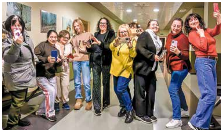
▲ Algunas de las participantes en el programa A. C. M. ASHABÁ

Esta iniciativa se estructura en tres talleres principales: creación de vídeo con teléfono móvil, fotografía digital y producción de podcast. A través de estas disciplinas, las participantes no solo aprenden técnicas audiovisuales básicas, sino