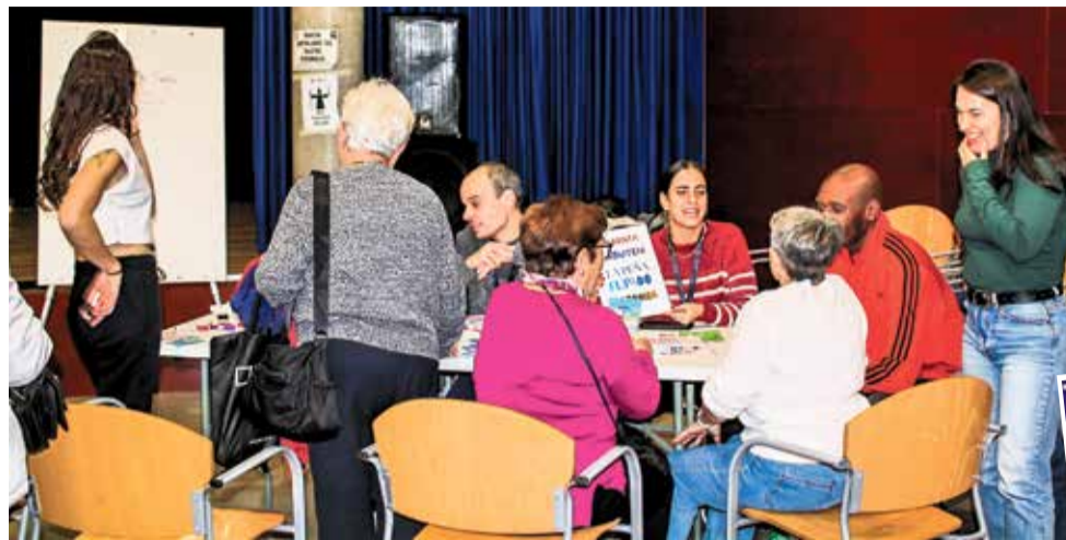
▲ Una de las actividades del primer encuentro celebrado en noviembre del año pasado CUIDANDO_CONACCION

Durante la tarde se desarrollarán diversas actividades pensadas para disfrutar en familia y entre vecinas y vecinos: petanca, el juego de la rana, dinámicas al aire libre, talleres creativos como