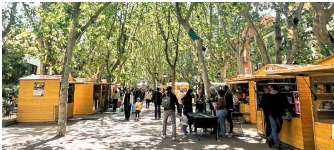
▲ La última edición celebrada en el bulevar de Peña Gorbea I. MENDI.

20 h. Actuación poético-musical «Poesía de ensueño», por Notting Hill.