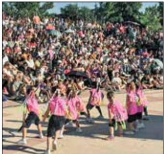
AV PAU ENSANCHE