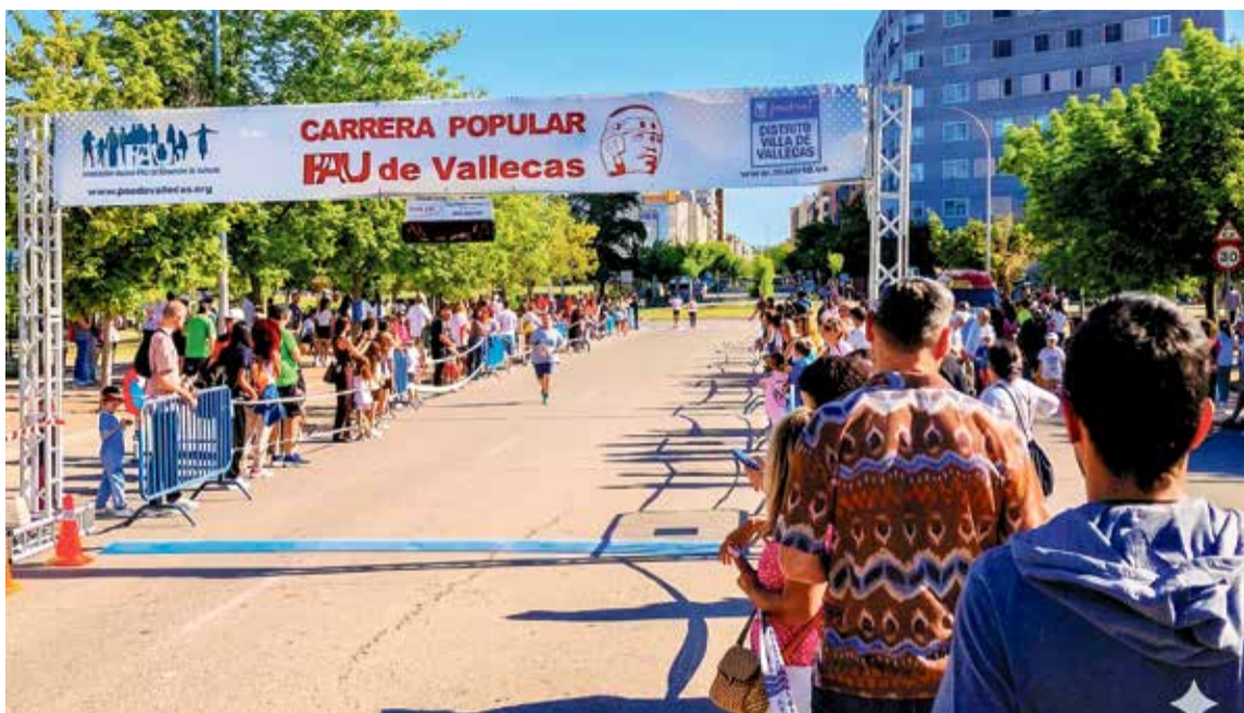
▲ La línea de meta instalada en la Avenida de Peñaranda de Bracamonte J. L.

La carrera popular del Ensanche disputó su decimocuarta edición en la calurosa mañana del domingo 19 de abril