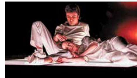
▲ Itzan Escamilla y Elena Rivera dan vida a Tristán y a Connie