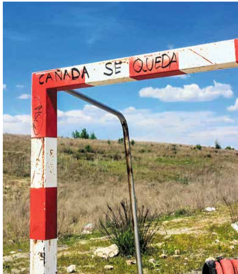
▲ Una de las porterías del campo de fútbol de Tabadol