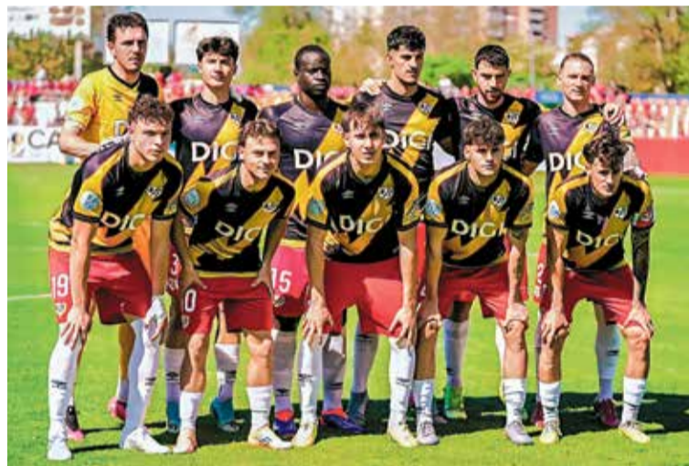
▲ El once inicial del Rayo B frente a la RSD Alcalá @RAYO_ACADEMIA

Abril fue un mes bueno en cuanto a resultados para el Rayo Vallecano, tras la consecución de 7 de los 12 puntos en juego en las cuatro jornadas disputadas, un bagaje que le sitúa, al cierre de esta edición, en la undécima posición de la Liga de Primera División con 39 puntos, a 5 puntos de puestos europeos y a la misma distancia de la zona de descenso. Una de las claves fue, sin duda, que los de Íñigo Pérez volvieron a hacerse fuertes en Estadio de Vallecas, con el apoyo incondicional de su afición. Ganaron por la mínima 1-0 a Elche y Espanyol, dos rivales directos por la permanencia, y empataron frente a la Real Sociedad en un polémico encuentro marcado por errores arbitrales, que merecieron ganar y del que no se fueron de vacío gracias a un gol en tiempo de prolongación de Alemão. Otra de las buenas