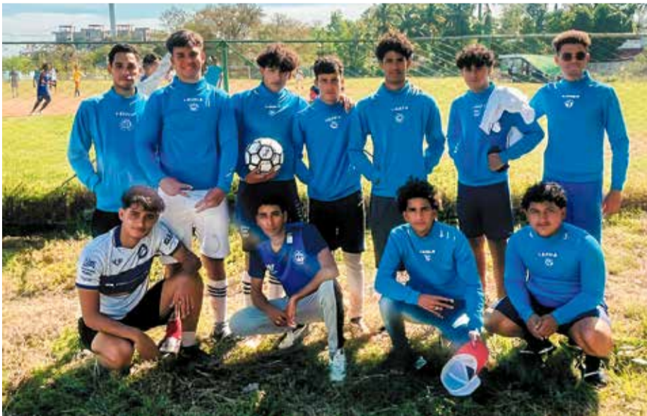
▲ El Juventud Madrid de Bayamo Granma, filial del «J» en Cuba