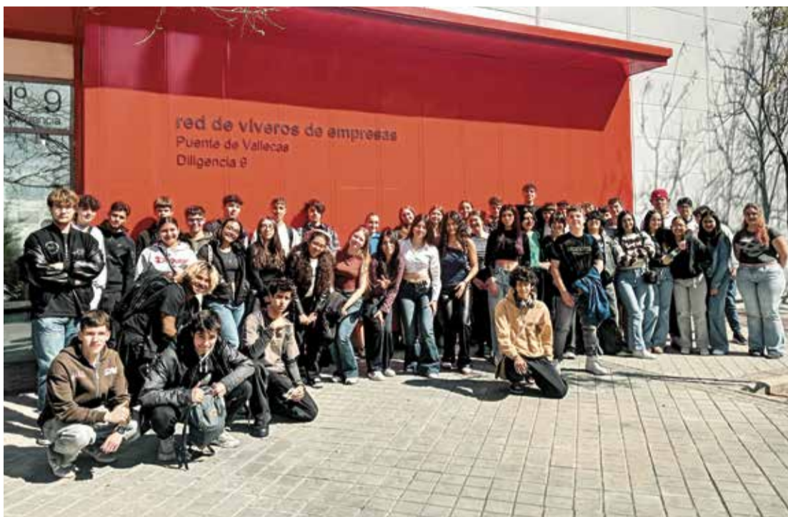
▲ Foto de familia del alumnado a las puertas del Vivero de Empresas de Puente de Vallecas J. ARGUEDAS