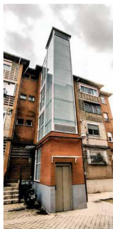
▲ Uno de los elevadores instalados en el exterior de los edificios F. B.

El problema de accesibilidad en Entrevías no es nuevo, pero sí cada vez más urgente. La falta de previsión en los años 50 ha