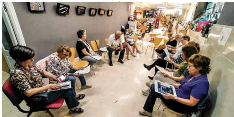
▲ Una de las actividades de lectura de ediciones anteriores

El autor del que conmemoramos su 200 aniversario será el italiano Carlo Collodi. Quizá su simple nombre no nos recuerde nada, pero si escarbamos en su obra, sobresaldrá su reconocido «Pinocho», que ha trascendido países y culturas. Este personaje y el recuerdo de Collodi llevará a colegios y asociaciones a presentar sus