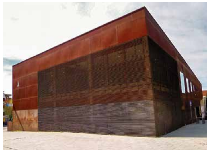
▲ El Sitio de mi Recreo está situado en el número 39 de la calle de Real de Arganda

De espacio juvenil en 2006 a Centro de Ocio y Asesoramiento Juvenil (COAJ) en 2026