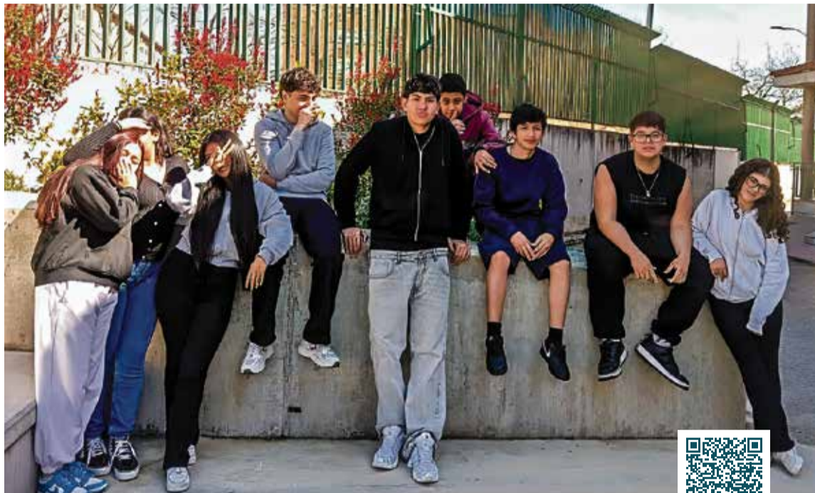
▲ Los alumnos de 3.º de Diversificación del IES Madrid Sur que han elaborado el texto