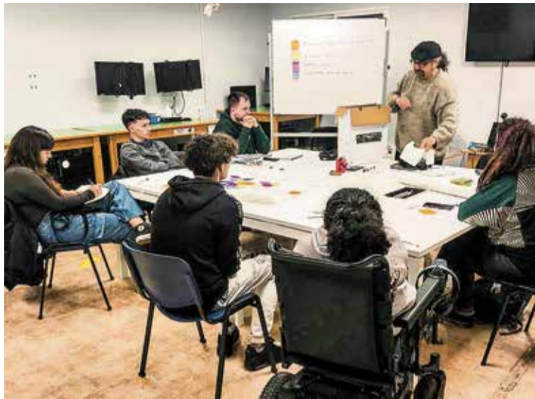
▲ Una de las actividades de Ciudad Sur A. C. LA KALLE

De estas reflexiones hay muchas ideas que se repiten: un fuerte sentimiento de pertenencia al barrio, la importancia de