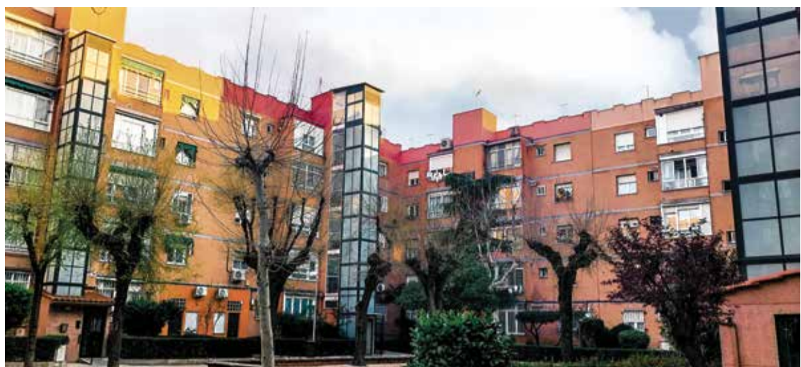
▲ Una de las zonas del barrio de Entrevías que dispone de ascensores exteriores

A ello se suma una gestión administrativa compleja: proyectos técnicos, solicitudes, plazos, requisitos y trámites digitales que no siempre resultan