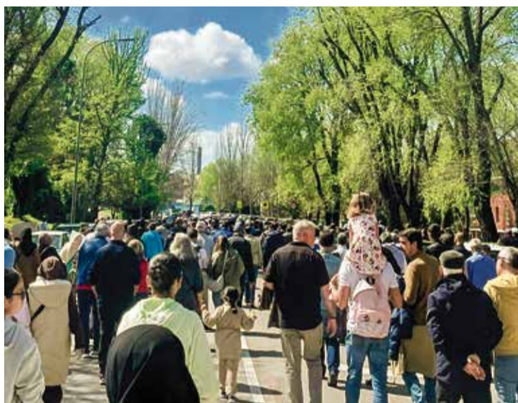
▲ La lucha unida y organizada será clave para la victoria final PLATAFORMA LUZ

POR PLATAFORMA CÍVICA DE APOYO A LA LUCHA POR LA LUZ DE CAÑADA REAL GALIANA