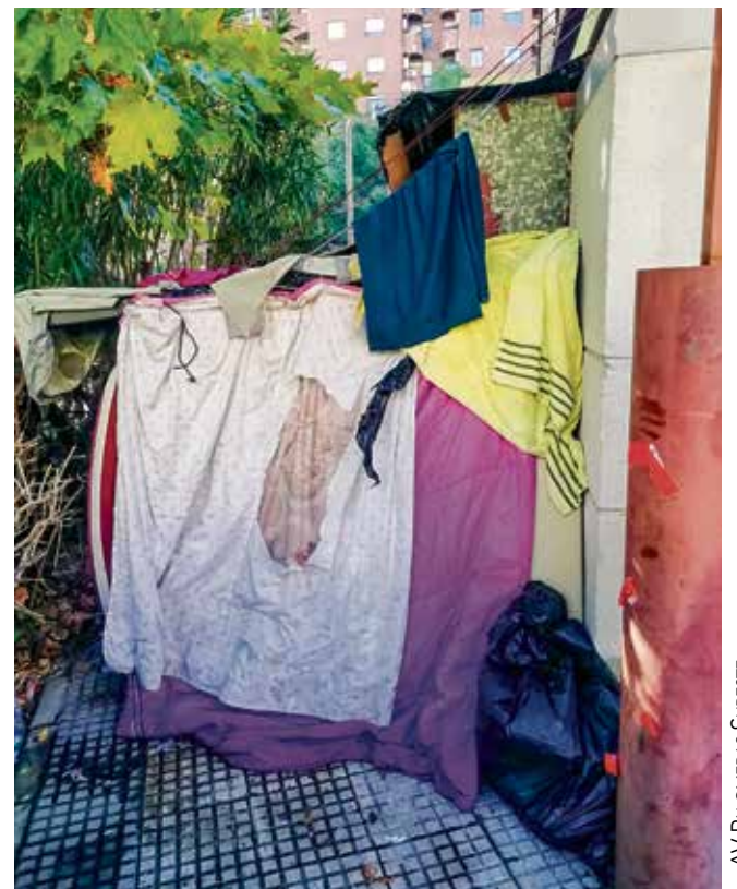
AV PALOMERAS SURESTE