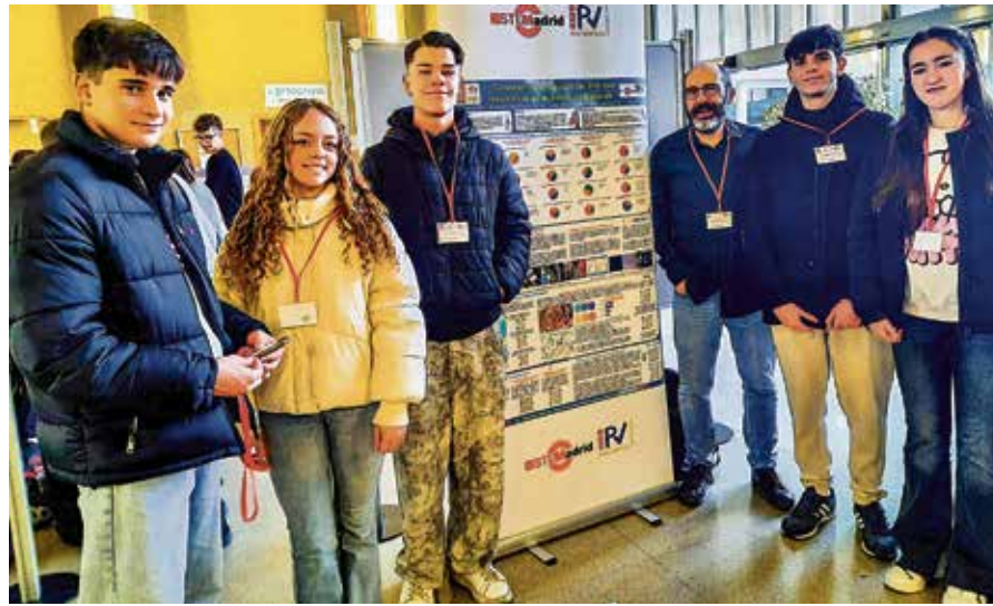
▲ La representación del Palomeras Vallecas en el Congreso STEMadrid 2025

«El desarrollo de esta investigación STEM sobre calidad del aire no solo ha generado datos valiosos, sino que también ha empoderado a los participantes, ha mejorado la educación ambiental de nuestros estudiantes y ha promovido acciones concretas para tener un aire más limpio», concluyen desde el instituto vallecano.