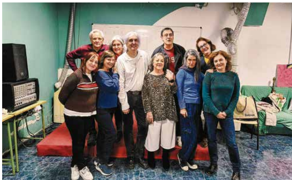
▲ Los integrantes de Peripatétikas Vallekanas posan después de un ensayo en el Centro Social La Brecha

V allecas siempre ha sido un barrio con carácter, reivindicativo, pero también muy cultural. En este último ámbito se mueve Peripatétikas Vallekanas, cuya historia no es la de un grupo de teatro al uso. Nació casi por casualidad entre bancales y tomates, en el Huerto Utopía (Avenida de Palomeras, 2), calificado por sus integrantes como "el más bonito del mundo". Allí, tras un reto lanzado por el grupo de eventos de este espacio, un puñado de vecinos y vecinas sin experiencia teatral decidió decir "sí"