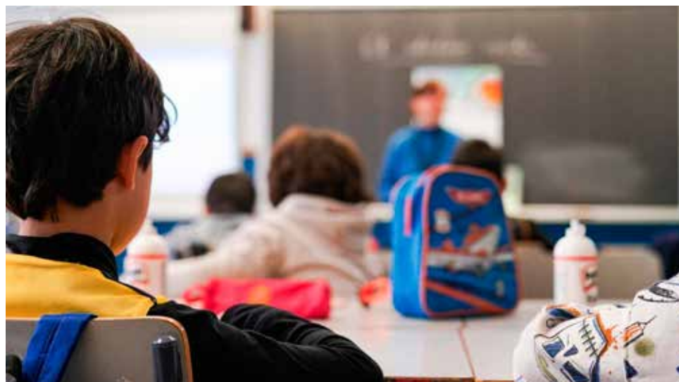
▲ Unas 150.000 familias de la región buscarán plaza para sus hijos

primer ciclo de Infantil se tendrá en cuenta al concebido no nacido a efectos de determinar los miembros de la unidad familiar y para la aplicación del criterio de familia numerosa, algo que ya se incluía en las instrucciones de admisión de enseñanzas de régimen general.