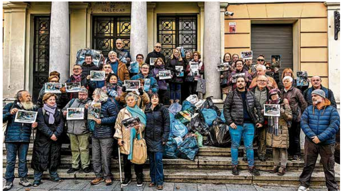
▲ Los vecinos, en la sede de la antigua Junta de Puente de Vallecas, en la avenida de la Albufera

Pero la plataforma no se limita a enumerar problemas. Desde su creación, ha apostado por la movilización y la visibilización como herramientas políticas legítimas. El pasado 12 de enero, con motivo de la convocatoria de un Pleno extraordinario de limpieza a petición de Más Madrid y el PSOE, se concentraron en la puerta de la