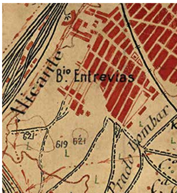
◀ Entrevías en 1957 (MTN50-0559-1957-nnn-Madrid)