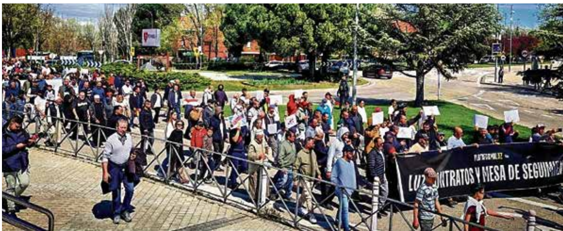
▲ Los habitantes de la Cañada Real continúan luchando por su barrio y por sus derechos PLATAFORMA LUZ