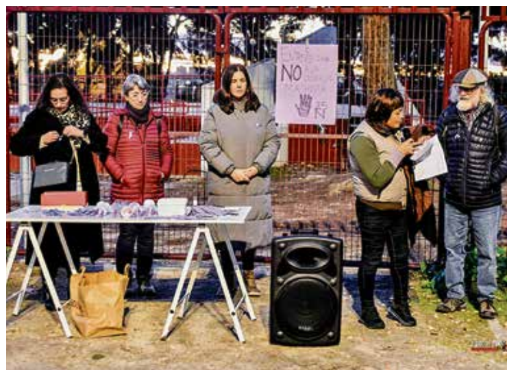
▲ Una de las intervenciones de los residentes

combatir la desinformación y garantizar que todas las mujeres puedan acceder a protección real, independientemente del barrio en el que vivan.