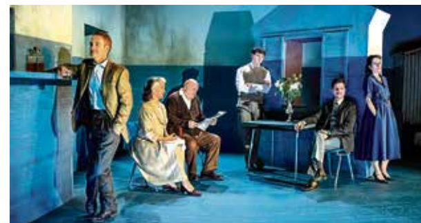
▲ El elenco de 'El desconocido' | JAVIER NAVAL