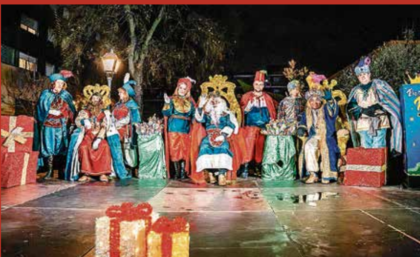
▲ La recepción de los Reyes Magos a los niños de Villa de Vallecass de este año