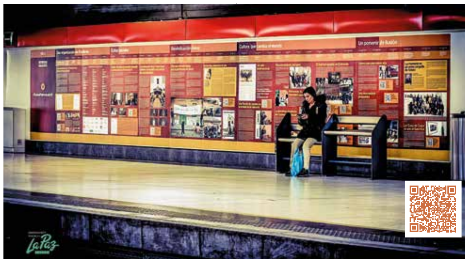
▲ Una viajera espera el tren en uno de los andenes tematizados de la estación de tren Asamblea de Madrid-Entrevías