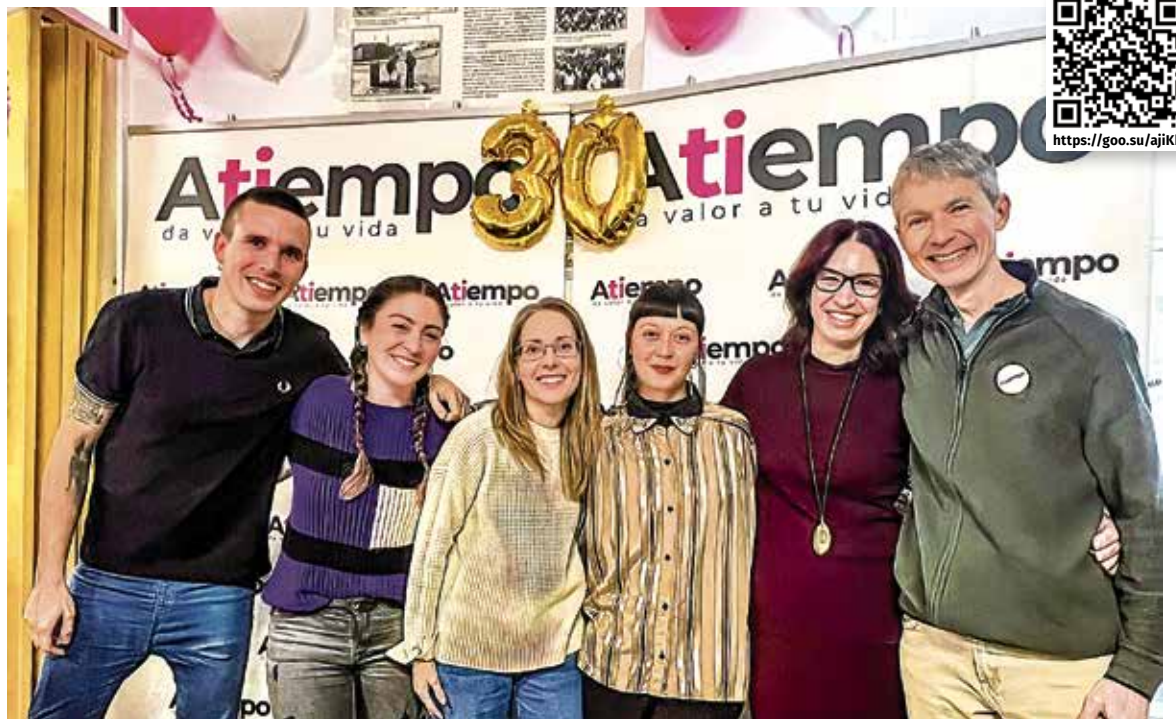
▲ Varios de los integrantes de la asociación Atiempo

Se volvió a constatar la necesidad de estos encuentros. De estas celebraciones surge la vida, y la solidaridad vecinal y humana. Además, hicieron reparar en que hay gente en los barrios vallecanos que sigue queriendo luchar por los demás, que lo hace con espíritu altruista y con generosidad. Y que personas rescatadas de ese agujero negro que es la droga también se suben al vehículo de la lucha compartida, del compañerismo, porque se ven tratadas con la dignidad que merecen, más que juicios y condenas, que es a lo que están acostumbradas. Una usuaria atendida por Atiempo dijo que de no ser por