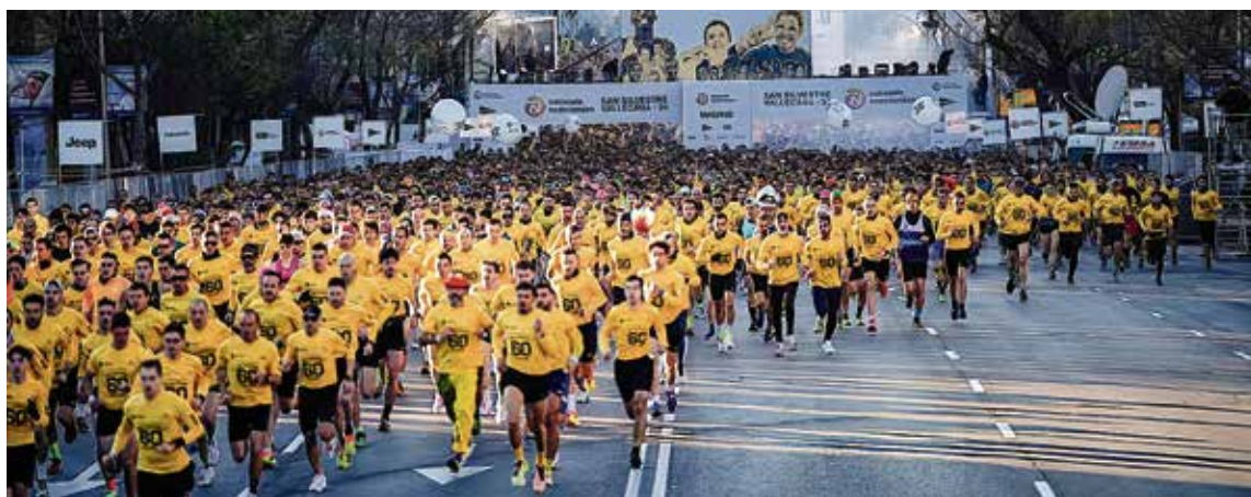
▲ La salida del año pasado | @SSVALLECANA

La primera de las modalidades, en la que abundan los disfraces y es eminentemente festiva, arrancará a partir de las 16:55 horas. La salida, situada en la calle de Concha Espina, se organizará por tiempos, con diferentes oleadas, para intentar que la carrera sea más rápida. Por su parte, la de élite dará