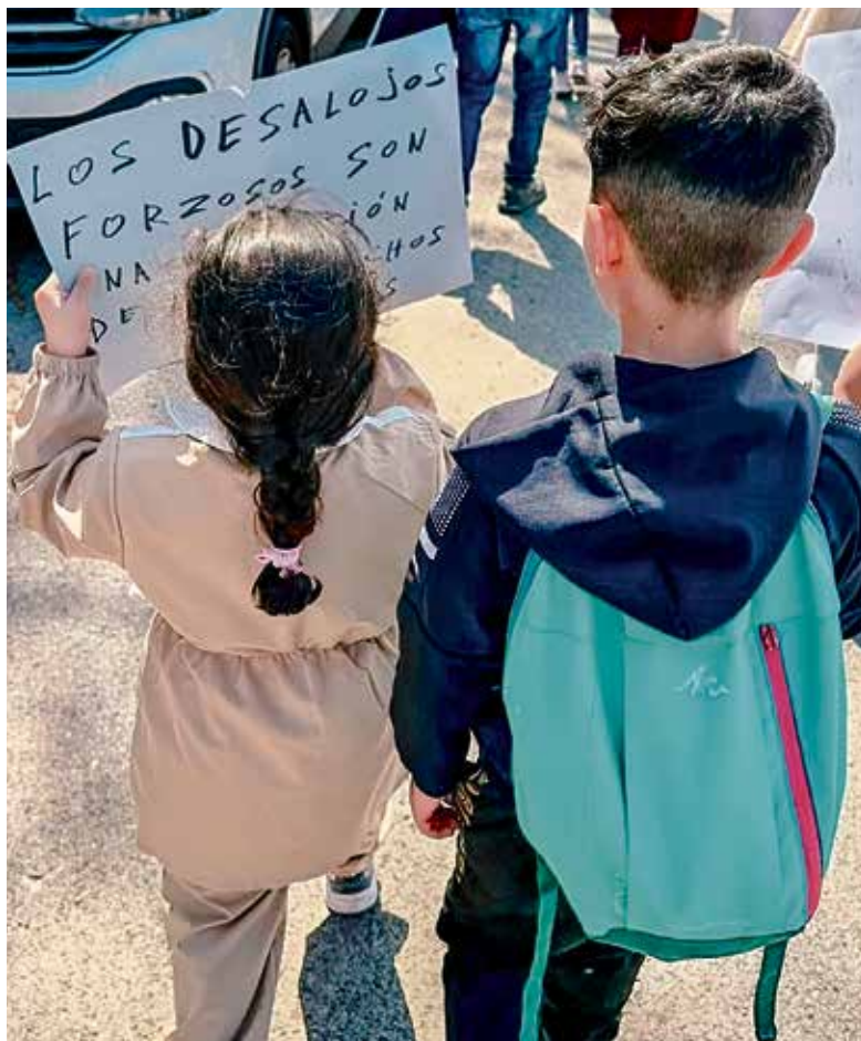
▲ Dos niños portan carteles en protesta contra los desalojos en Cañada PLATAFORMA LUZ

La segunda razón es la justicia de su causa. Los habitantes del barrio son plenamente conscientes de que tienen derecho a vivir