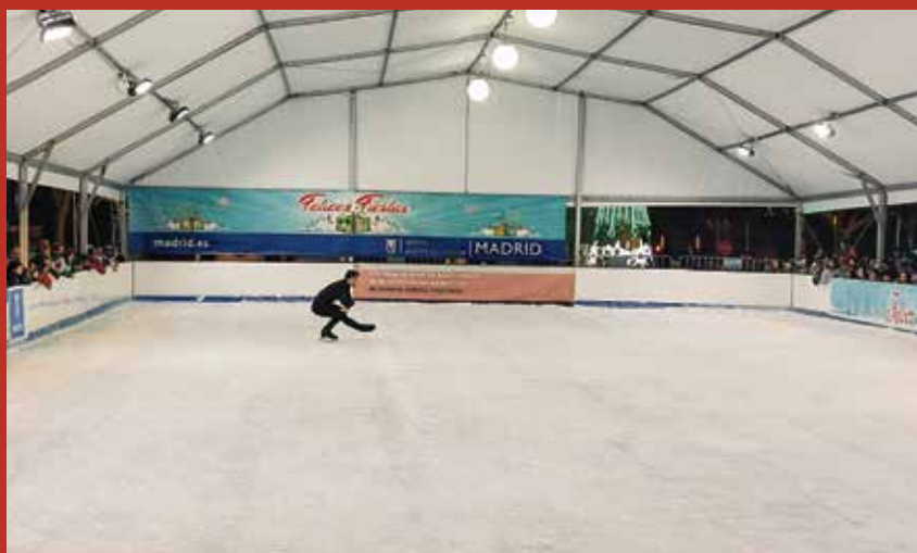
▲ La pista de hielo de Entrevías

La Navidad llegará a los distritos de Puente y Villa de Vallecass con una programación especial de actividades, donde no faltarán los tradicionales belenes, villancicos y cabalgatas. Además, habrá propuestas de ocio para toda la familia, como talleres y espectáculos, para vivir la ilusión de estas fiestas tan entrañables. A continuación, las citas más destacadas.