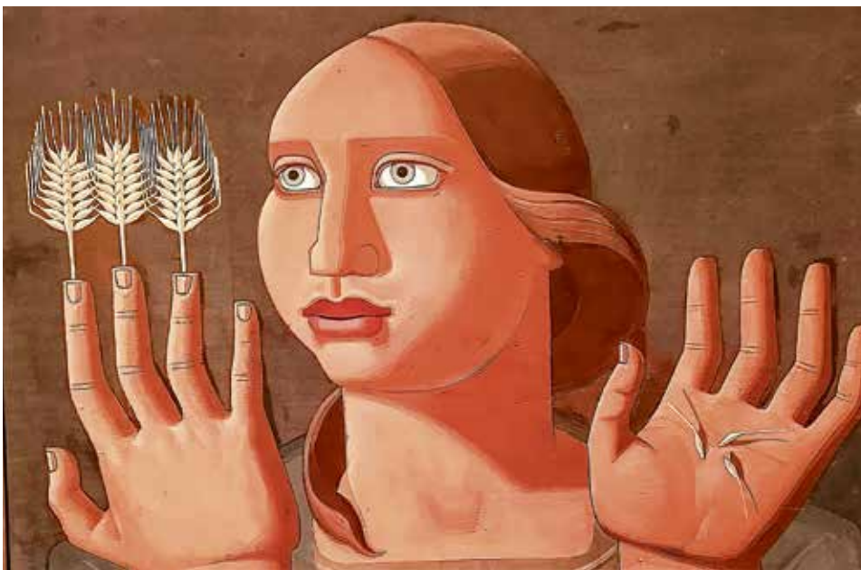
▲ El cuadro «La Sorpresa del Trigo», pintado por Maruja Mallo en 1936

Su visión anticipó, sin proponérselo, la exposición permanente 'El pan de Vallecas', que hoy se conserva en el instituto público María Rodrigo, un testimonio humilde pero poderoso de la misma idea: el pan como arte, el trigo como conocimiento.