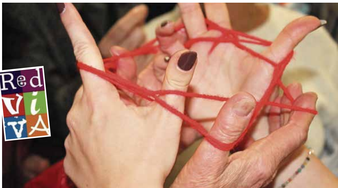
▲ Una de las actividades de la jornada

En total se realizaron ocho talleres durante toda la tarde del viernes. En la actividad de conservación de alimentos, los asistentes pudieron aprender sobre seguridad alimentaria y en la de reciclaje qué hacer con los residuos. Por su parte, en el taller de recetas de cocina, se elaboró un recetario con platos tradicionales y modernos. Además, los