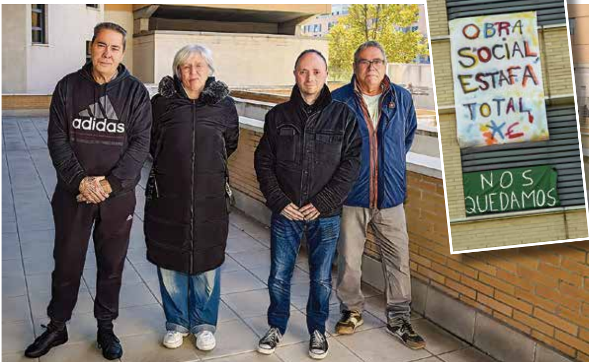
▲ Cuatro de los vecinos afectados por la venta de sus casas ▲ Dos de los carteles colocados en las viviendas de la urbanización JESÚS INASTRILLAS