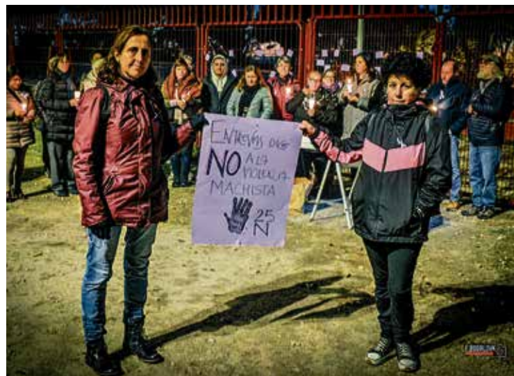
▲ Dos vecinas muestran una pancarta

Los asistentes reclamaron más recursos, políticas eficaces y una respuesta institucional ágil. Por otro lado, subrayaron la necesidad de reforzar la prevención,