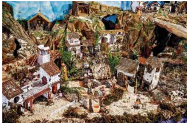
▲ El Nacimiento instalado en la parroquia

Domingo 4 de enero , 17:30 horas. Calle de Rayo Vallecano de Madrid.