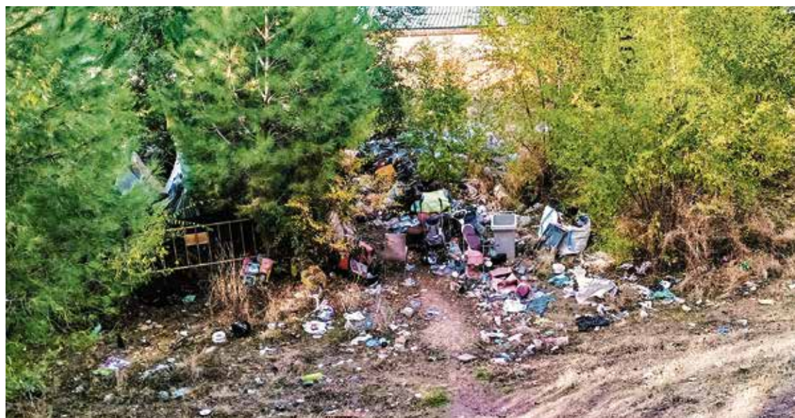
▲ Uno de los descampados del barrio lleno de suciedad

La indignación lleva a muchos a formular una pregunta obvia: ¿podemos imaginar ratas merodeando entre contenedores desbordados en el barrio de Salamanca? La respuesta es evidente. Ese contraste resume, para los residentes, una realidad que lleva años repitiéndose: no todos los barrios reciben el mismo trato.