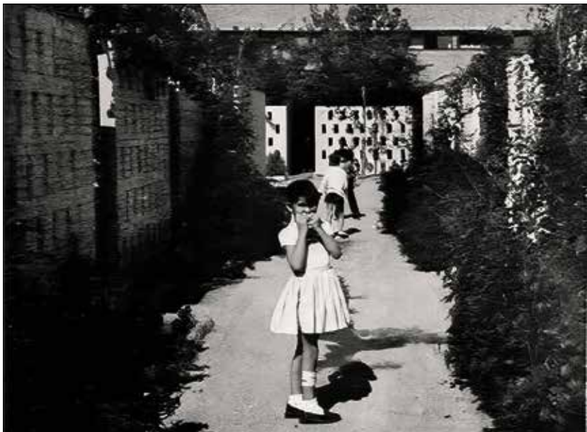
▲ Una niña posa en una de las calles de Entrevías