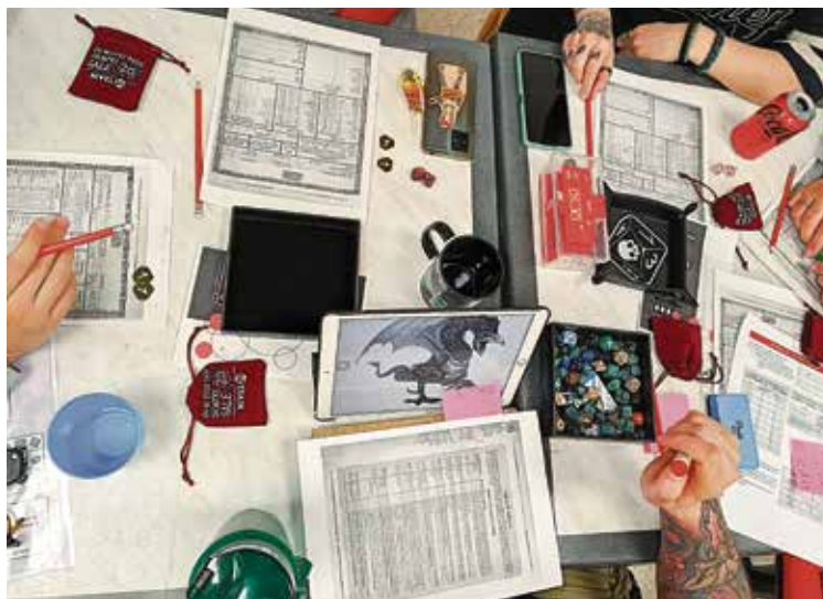
▲ La asistencia habitual a estas jornadas es de 600 personas

Sus promotores aseguran que la asistencia habitual es de alrededor de 600 personas cada año, repartidas entre aficionados habituales del ocio lúdico y personas interesadas en conocerlo, tanto de dentro del distrito como de los alrededores. Además, habrá actividades para todos los públicos, con una gran zona Infantil y familiar, que