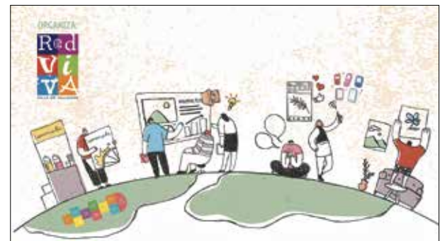
▲ El cartel de esta actividad organizada por Red VIVA

«Se trata de una oportunidad para compartir, aprender y disfrutar entre generaciones, conectando pasado y presente a través de la cultura y el ocio. ¡Participa y conoce los recursos y a las personas de tu distrito!», dicen los promotores de esta iniciativa.