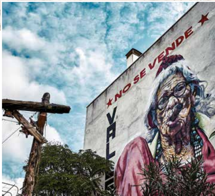
▲ El mural de arte urbano, situado en el Parque Vecinal Sputnik Vallecas. N. GOYTRE

un caos que se me antoja hermoso», dice el fotógrafo.