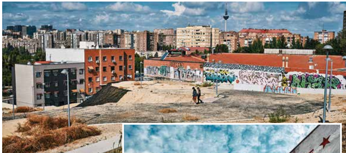
▲ Uno de las imágenes tomadas por el autor. N. GOYTRE

al barrio en que nació». «Vallecas tiene una potente identidad que se nota en su gente y en sus calles. Una identidad marcada por su historia, por cómo se ha ido construyendo el barrio. En ocasiones, los paseos se convertían en una especie de expedición arqueológica donde, como capas de sedimentación, encontraba lugares con huellas de diferentes épocas del barrio. Casas semiderruidas mezcladas con el ladrillo de los años 70 y 80 y al fondo edificios de nueva construcción, todo embarullado en