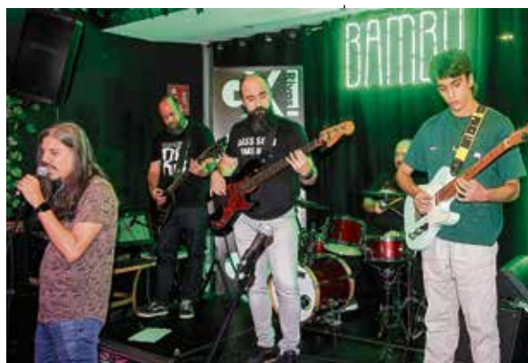
▲ Una de las actuaciones del festival.