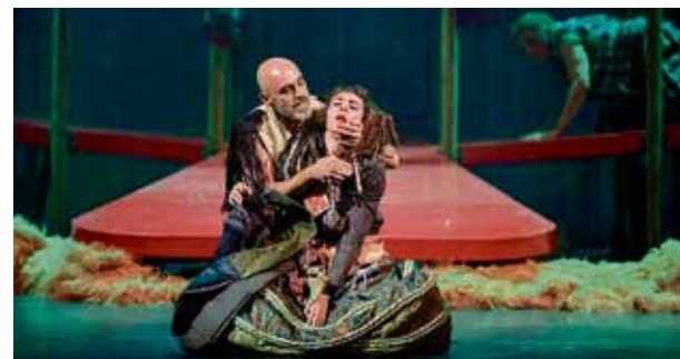
▲ Un momento de la función TEATRO DE LA COMEDIA

En cuanto a la población previa a la contienda civil y la composición de Entrevías, según datos oficiales, en 1930 había 51.767 habitantes censados en Vallecas, siendo Nueva Numancia –a 4 km. de Vallecas y 500 metros de Madrid, residencia del Ayuntamiento– el barrio más poblado con diferencia, mientras el barrio de Entrevías u Obrero tenía unos 4.000. Huerta del Manco, Huerta de Zabala, Mesa del Margen Obrero y Picazo eran barrios anejos a Entrevías (Sandra Isabel Souto Kustrín, T. D. UCM).