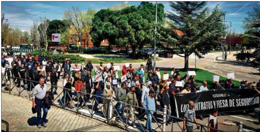
▲ Una de las movilizaciones de los vecinos de Cañada Real para pedir el restablecimiento del suministro eléctrico PLATAFORMA LUZ

Las causas más valiosas son sostenidas sólo por las personas más dignas, independientemente de sus condiciones y circunstancias