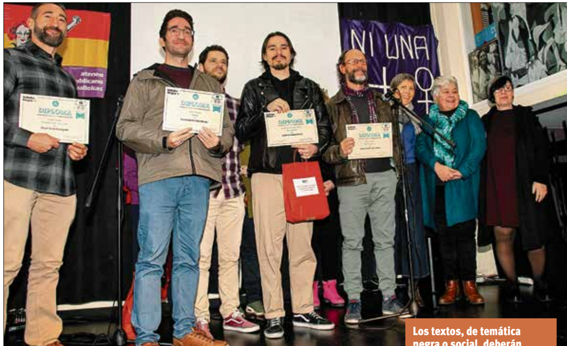
▲ Los ganadores de la segunda edición del certamen VALLEKAS NEGRA

También es posible entregar el relato de manera física en un sobre cerrado con tres copias del