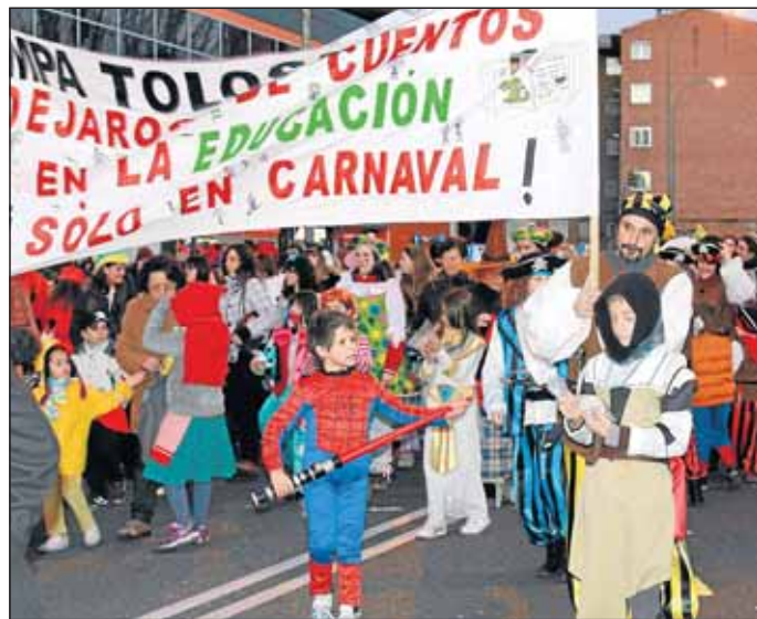
Imagen del carnaval del año pasado.

Una vez terminado el desfile en la Plaza Vieja, se servirá un chocolate caliente con bizcocho a precio popular, amenizado musicalmente por las charangas y batukadas participantes.