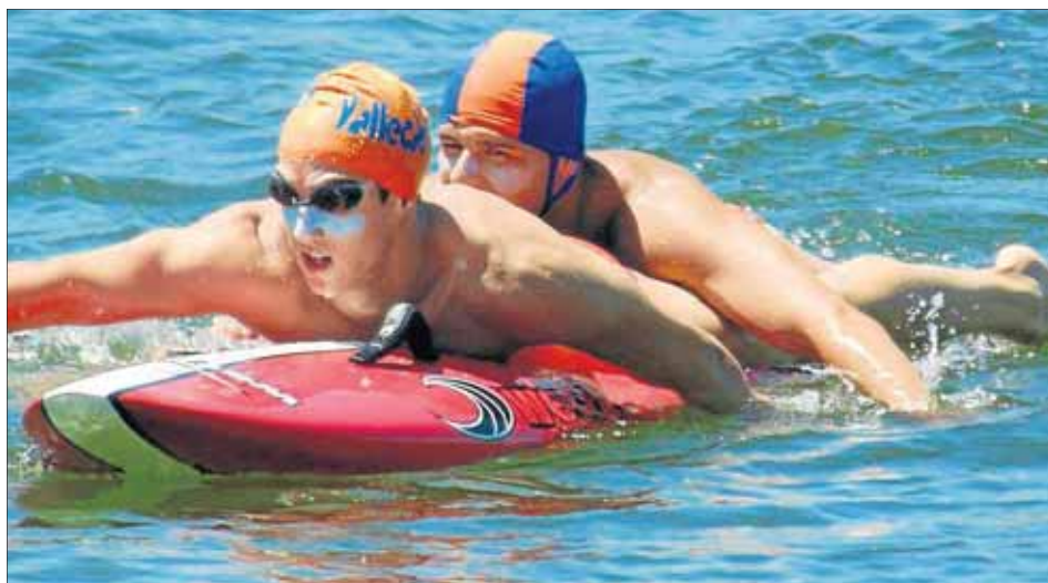
Los deportistas, en el Trofeo Comunidad de Madrid del año pasado.