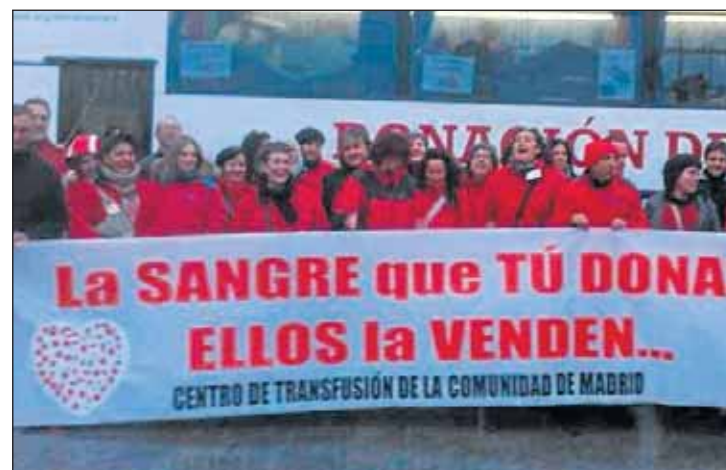
Trabajadores del centro de transfusión.

En nuestra comunidad no existe una hermandad de donantes (fue disuelta en 1994). En Cantabria, por ejemplo, con 600.000 habitantes, la hermandad cuenta con 88.000 miembros. Es necesario que los donantes de Madrid nos organicemos nuevamente en una asociación de