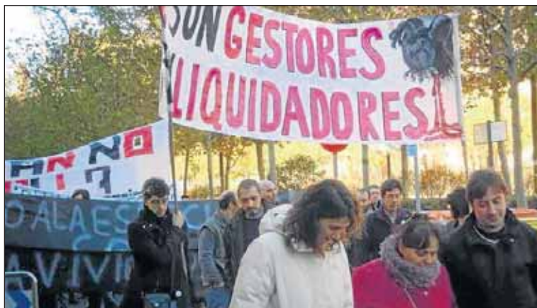
Manifestación en Ventilla, el pasado 14 de diciembre.

Entre el Ayuntamiento y la Comunidad de Madrid han malvendido recientemente 5.000 viviendas a Blackstone y Goldman Sachs por 128 y 201 millones de euros, respectivamente. Esto es, cada vivienda les ha salido a estas empresas por unos 68.000€ de media; un precio bastante menor de lo que nos costó construir las a los contribuyentes madrileños y muy por debajo también del que estos