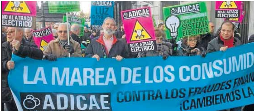
Los consumidores se manifestaron el día 1 en 23 ciudades españolas.