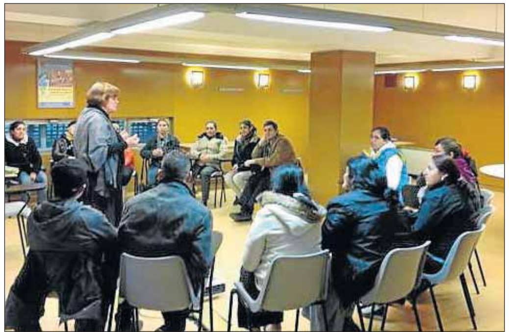
Sesión de formación de mediadores.