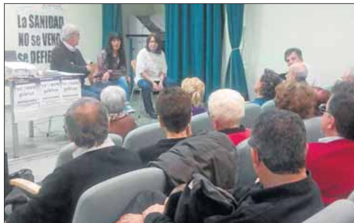
El acto informativo en el centro de mayores tuvo lugar el 27 de enero.

"A finales del año pasado —continúa—, ya desde Patusalud, donde nos agrupamos distintas plataformas, pensamos en hacer una campaña para todo Madrid. Hemos comenzado preparando un folleto informativo donde explicamos a la población qué está pasando,