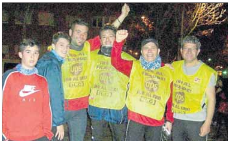
El conflicto de UPS también estuvo presente en la San Silvestre Vallecana.

Los autos recogen que “de la descripción de los hechos y la documental aportada se desprenden, en esta fase procesal y sin perjuicio del resultado de las diligencias que se practiquen, indicios de la posible comisión de delitos contra los derechos de los trabajadores de los artículos 311 y