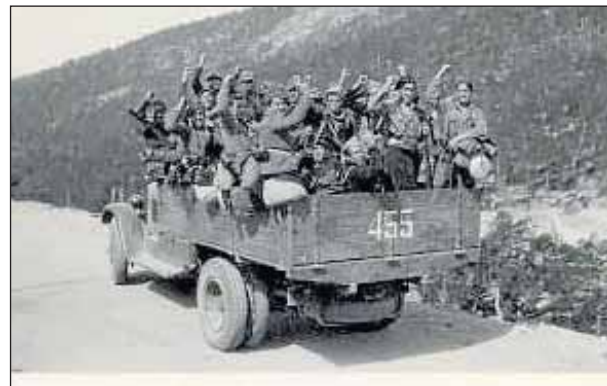
Una de las fotos que puede verse en la exposición.